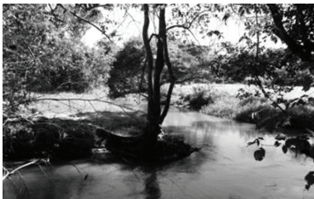
Figura 10 - Ponto GOI10.1, situado na Bacia do Ribeirão Sozinha, em Goiás, apresenta-se com mata ciliar desmatada