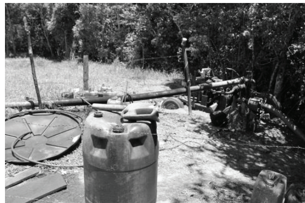
Figura 7 - No trecho GOI3, localizado na Bacia do Ribeirão Sozinha, em Goiás, há uma bomba para irrigar as margens do rio, além de diversos tonéis de óleo abandonados ao seu redor