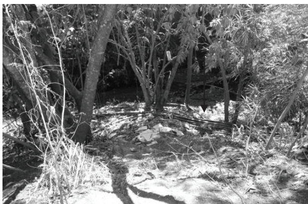
Figura 9 - Trecho GOI7, situado na Bacia do Ribeirão Sozinha, em Goiás, possui lixo (seta) e tubulações de esgoto