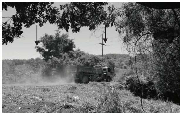
Figura 8 - Trecho GOI2, situado na Bacia do Ribeirão Sozinha, em Goiás, onde se pode ver o tráfego de veículos sobre o ribeirão

hídrico que está assoreado e as margens foram desmatadas e estão instáveis. Na região do ponto GOI3 há a presença de bombas (mecânicas) e encanamentos de água, utilizados para a irrigação de uma lavoura de tomate (Figura 7). Neste trecho havia muitos tonéis de óleo dispostos às margens do ribeirão.