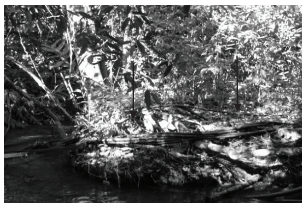
Figura 11 - No trecho GOI8.1, situado na Bacia do Ribeirão Sozinha, em Goiás, é possível ver tubulações (setas)