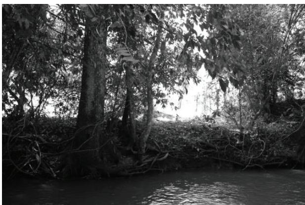
Figura 3 - Trecho GOI4, situado na Bacia do Ribeirão Sozinha, em Goiás, com mata ciliar desmatada e leito do ribeirão preservado