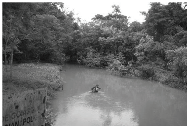
Figura 12 - O ribeirão do trecho Captação, situado na Bacia do Ribeirão Sozinha, em Goiás, possui as margens desmatadas e está represado