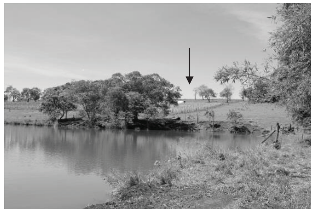
Figura 6 - Trecho GOI5, localizado na Bacia do Ribeirão Sozinha, Goiás, com margens desmatadas, acima se vê a plantação de tomate (seta)