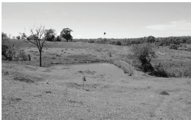
Figura 5 - Trecho GOI1, situado na Bacia do Ribeirão Sozinha, em Goiás, possui as margens do córrego desmatadas e córrego represado