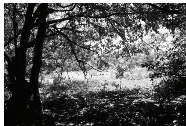
Figura 14 - Trecho GOI11.1, situado na Bacia do Ribeirão Sozinha, em Goiás, apresenta-se com mata ciliar desmatada

construção de uma avenida de grande tráfego de veículos (Figura 9). O riacho apresentava-se assoreado, havia lixo e erosões em sua margem. No ponto GOI10.1, o ribeirão possui mata ciliar estreita e em alguns pontos está completamente desflorestado (Figura 10), as margens possuem erosões e há a presença de lixo.