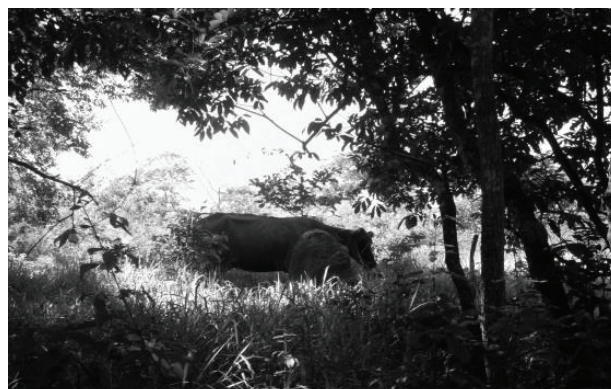
Figura 13 - Trecho GOI9.1, situado na Bacia do Ribeirão Sozinha, em Goiás, a atividade de pecuária às margens do ribeirão