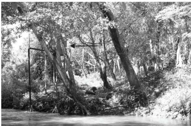
Figura 4 - Trecho GOI6, situado na Bacia do Ribeirão Sozinha, em Goiás, com bomba mecânica (seta)