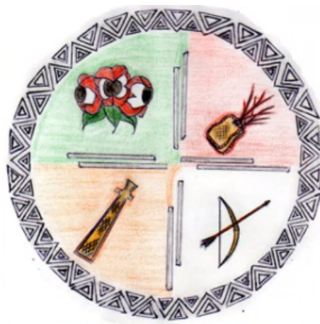
Figura 4 Representação Sateré-Mawé

No território Sateré-Mawé, existem várias escolas indígenas que atendem as aldeias. São organizadas pela comunidade e financiadas pelo governo. Não é incomum encontrar nesses lugares de ensino e nos prédios das associações uma figura circular com a representação das sementes de guaraná, da luva da tucandeira, do Porantim e do arco e flecha (Figura 4).