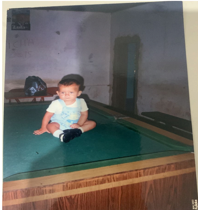
Figura 19: Foto do meu irmão caçula, em maio de 2003, tirada no bar do meu avô em Nova Franca, Bahia.