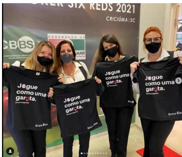
Figura 8: Imagem de mulheres com camisetas incentivando o jogo de sinuca entre elas, usada no Campeonato Brasileiro de Sinuca 2021 em Criciúma (SC).

sinuca no Brasil, e em 2021 ocorreu o I Simpósio Nacional de Sinuca Feminina, organizado em Criciúma (SC). Ações como essas ajudam não somente em dar visibilidade para essas mulheres em campo, mas também atuam como agentes precursores para incentivos de patrocinadores.