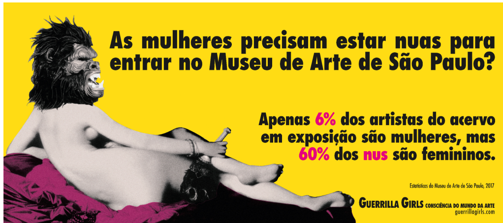
Figura 10: Autoras: Guerrilla Girls, "As mulheres precisam estar nuas para entrar no Museu de Arte de São Paulo?".

Historicamente, as mulheres aparecem nos museus como temas, e não como sujeitos. Ou seja, são representadas, muitas vezes nuas, idealizadas ou erotizadas, mas raramente reconhecidas como autoras, criadoras ou curadoras. Como foi provocado por uma exposição que ocorreu no MASP (Museu de Arte de São Paulo) em 2017, pelas artistas do Guerrilla Girls, um grupo de ativistas feministas que usaram o espaço para promover essa discussão, expor e criticar os preconceitos étnicos, de gênero e políticos existentes com tamanha relevância nesses espaços culturais.