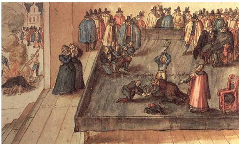
Figura 1: A Execução de Mary Stuart, no castelo de Fotheringahey, em 1587 (por autor desconhecido). Fonte: https://rainhastragicas.com/wp-content/uploads/2012/10/maria-stuart-execution.jpg . Acesso em 18 de maio de 2025.