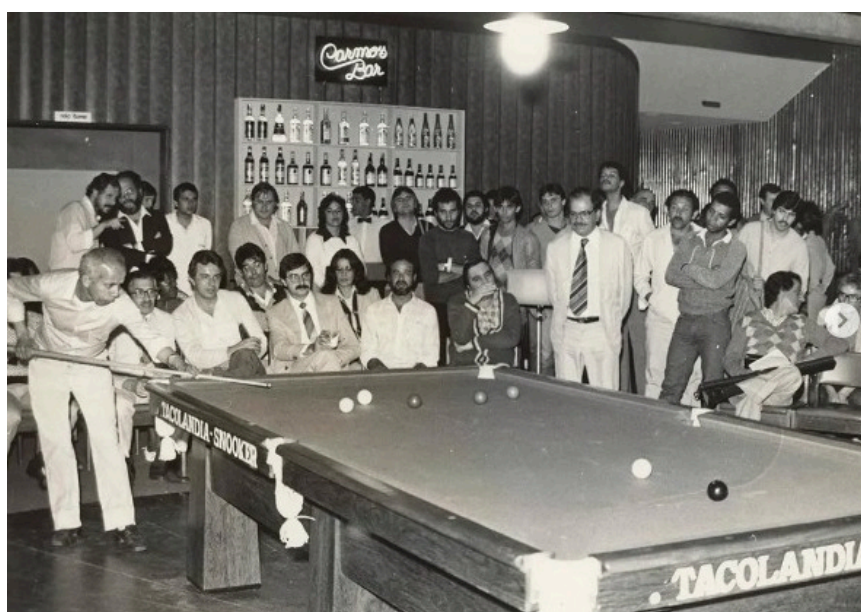
Figura 3: Registros da prática do bilhar no acervo do Sesc Memórias, registro datado de 1984. Fonte: https://www.instagram.com/sescmemorias/p/DCXF1OgP4E7/ . Acesso em 18 de maio de 2025.

Assim, algumas mulheres já começavam a praticar a sinuca de forma discreta, geralmente em ambientes privados, como em clubes femininos ou na companhia de familiares, como mostra na imagem no acervo sesc memórias de 1984. Essas primeiras jogadoras enfrentavam preconceitos tanto por estarem em um esporte considerado masculino quanto por frequentarem espaços tradicionalmente reservados a homens.