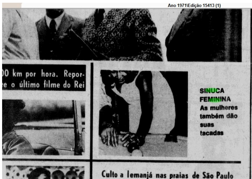
Figura 4: O Jornal, Rio de Janeiro, 28 de dezembro de 1971, Edição 15413.

Entre 1960 e 1970, as mulheres começaram a ganhar mais espaço na sinuca, tendo reportagens registradas em jornais locais da época, como na edição de 1971 de O Jornal, no Rio de Janeiro, e principalmente na Europa e nos Estados Unidos, onde algumas jogadoras começaram a se destacar no cenário competitivo. Nomes como Vera Selby, uma das primeiras campeãs britânicas de sinuca, trouxeram visibilidade para o esporte feminino, sendo pioneira no campo.