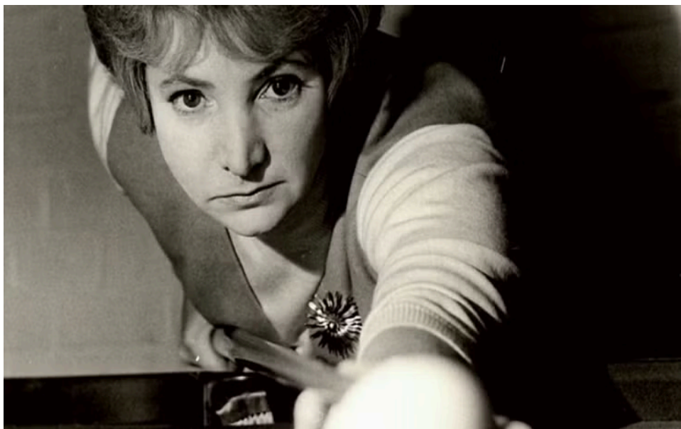
Figura 20: Vera Selby, imagem utilizada na exposição realizada pela Universidade de Northumbria.

Vera Selby, nascida em 1930, foi uma das pioneiras da sinuca feminina ao redor do mundo, conquistando o título de Campeã Mundial em 1976 e 1981. Como a primeira mulher a comentar partidas na BBC (British Broadcasting Corporation), tendo um papel central na ampliação da visibilidade das mulheres no meio esportivo. Além da carreira esportiva, foi professora de artes na Universidade de Northumbria, localizada na Inglaterra, que a homenageou lindamente com uma exposição em 2024, um ano após sua morte, que ocorreu em 13 de março de 2023. Seu legado inspira debates sobre gênero, memória e reconhecimento no universo da sinuca feminina ao redor do mundo.