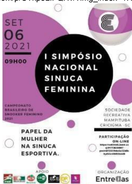
Figura 9: Cartaz de divulgação do I Simpósio Nacional Sinuca Feminina, organizado pelo grupo “Entre Elas” em 2021, na cidade de Criciúma (SC).