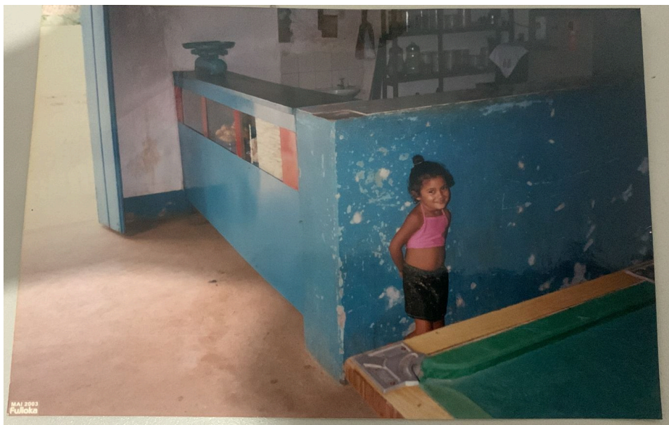
Figura 18: Foto minha tirada no bar do meu avô em Nova Franca, Bahia. Arquivo Pessoal, maio de 2003.