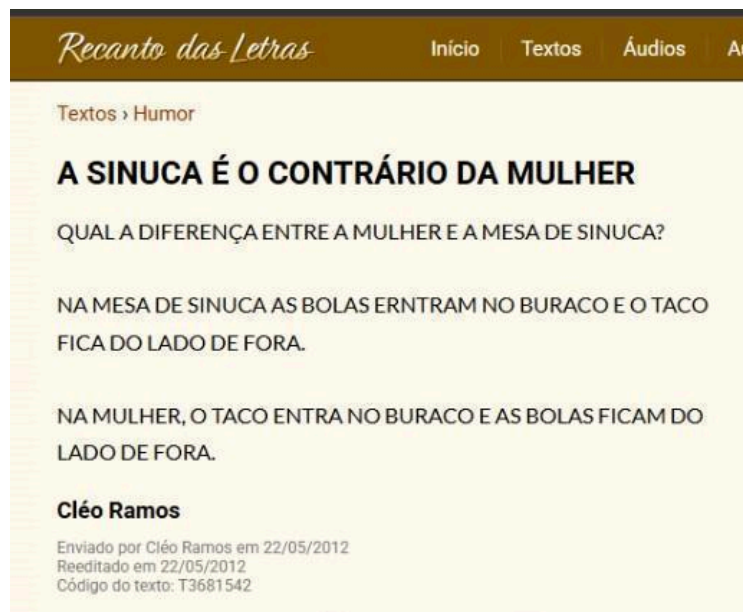
Figura 6: Comentários como esse nestes ambientes eram comuns, datado e publicado em maio de 2012 em um blog de textos chamado “Recanto das Letras”.

No Brasil, a sinuca costumava ser um esporte popular, mas com pouca visibilidade para as mulheres, nomes como Silvia Taioli e Carmelita Yumito se destacaram no cenário como pioneiras na categoria de sinuca feminina no país, abrindo portas para