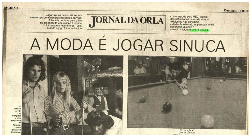
Figura 5: Jornal da Orla. São Paulo, 15 de setembro de 1991, Edição 00918.