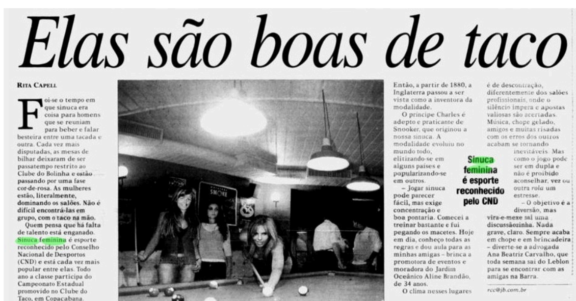
Figura 7: Jornal do Brasil, Rio de Janeiro, 09 de outubro de 2005, Edição 00184.

Embora o caminho ainda seja longo, especialmente em termos de igualdade de premiações e visibilidade na mídia, o aumento de competições femininas e a presença de mulheres em torneios mistos são sinais de um aumento da participação feminina nesse campo.