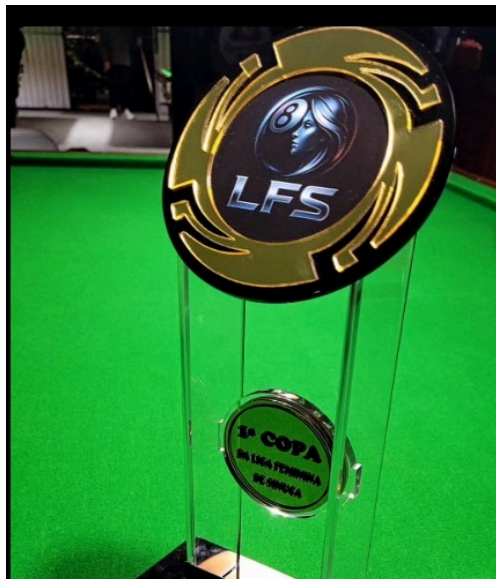
Figura 17: Troféu da Primeira Copa Feminina de Sinuca na modalidade bola 8, que ocorreu em 19 de julho de 2025.