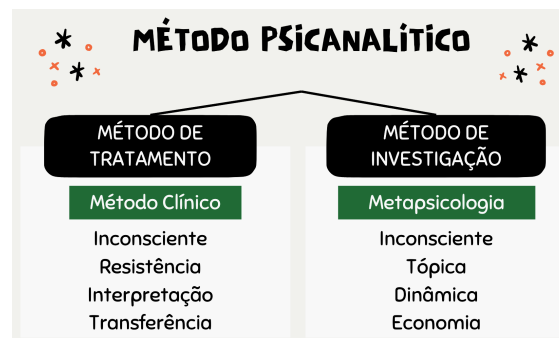
Figura 2: Esquema simplificado do método psicanalítico

Fonte: Anotações pessoais da disciplina de Psicanálise I (2020) e Mezan (1996).