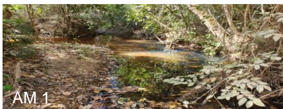
Figura 2. Representação fotográfica dos pontos amostrais AM1 – AM5.

Localização: (14°41'56.5''S, 49°12'27.1''W)