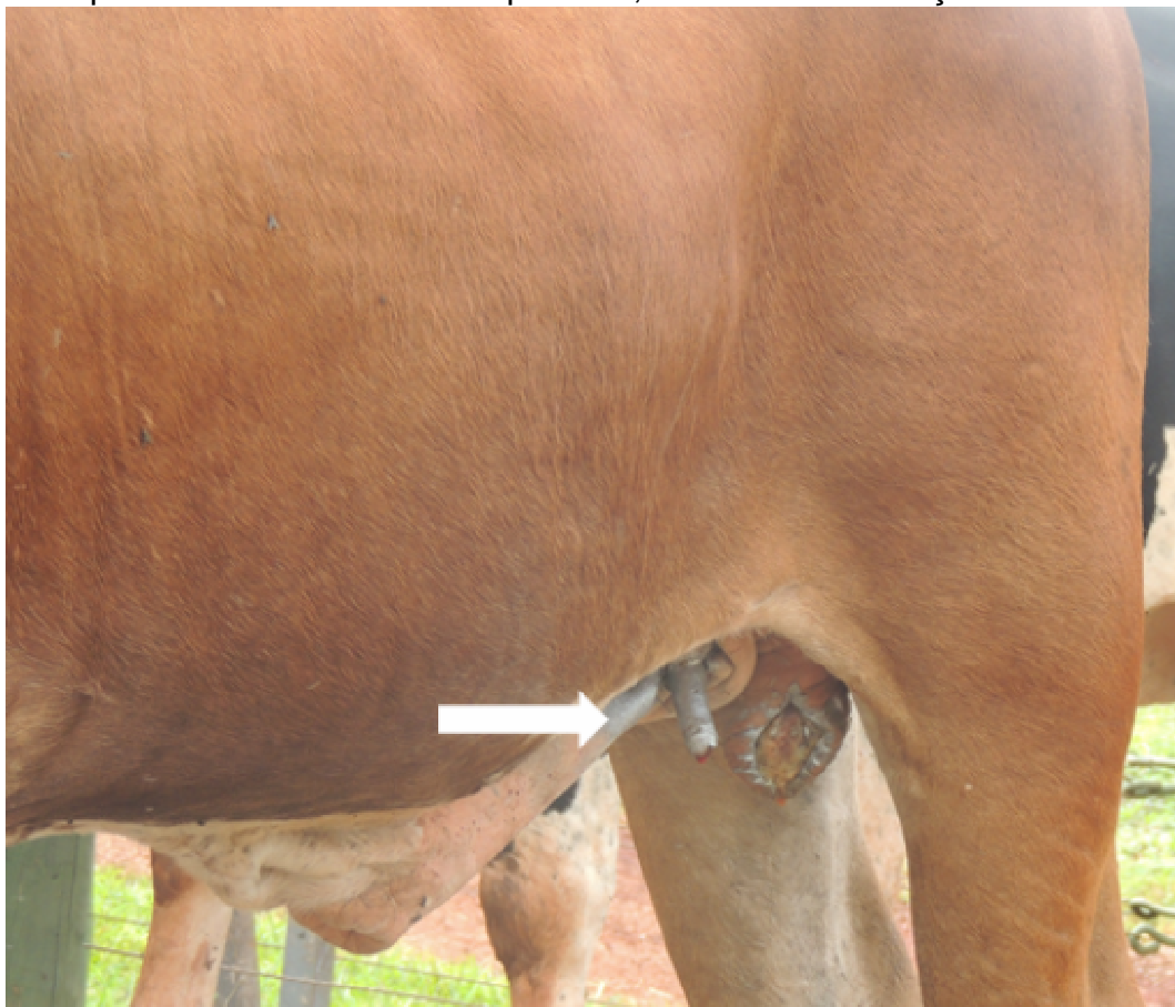
FIGURA 2. Coto peniano fixado a pele na região paraprepucial esquerda.

foi realizada em padrão Wolf, captonada, com fio de poliamida, tendo o cuidado de fixar os pontos somente no tecido peniano, evitando transfixação da uretra.