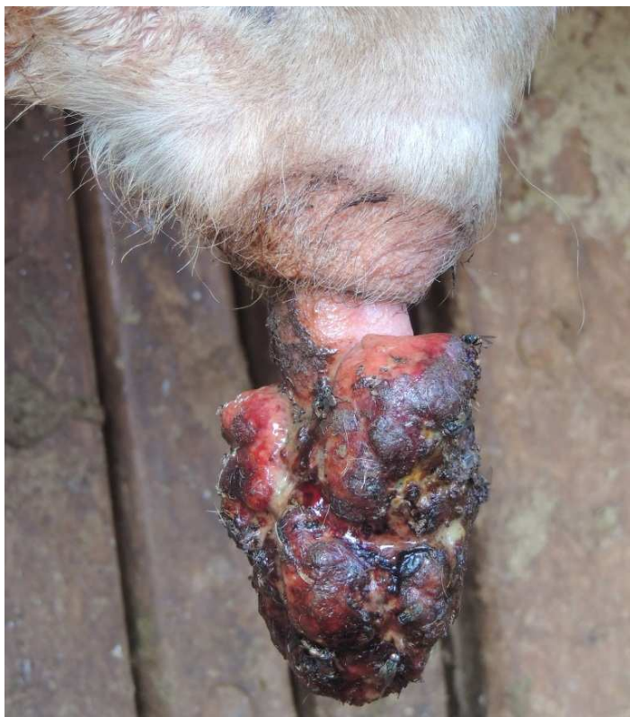
FIGURA 1. Massa tumoral de textura firme, avermelhada, com aspecto de couve flor, apresentando áreas de ulceração e necrose.