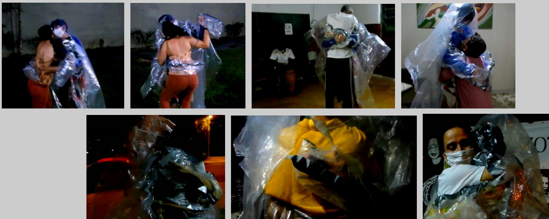
(frames do material bruto para o videodança) 9