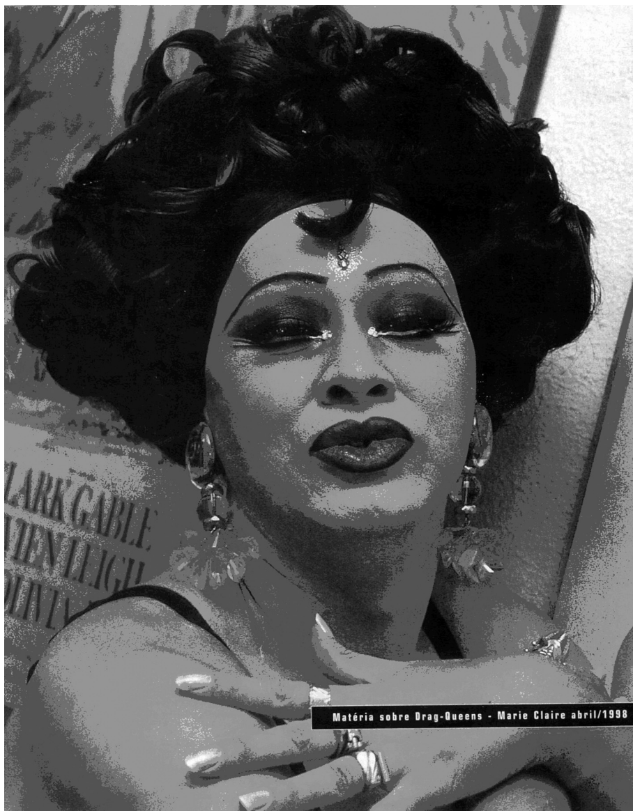
Revista Marie Claire, de 24 de julho de 2000.