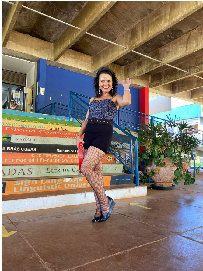
Imagem 2 - Mulher Maravilhinda