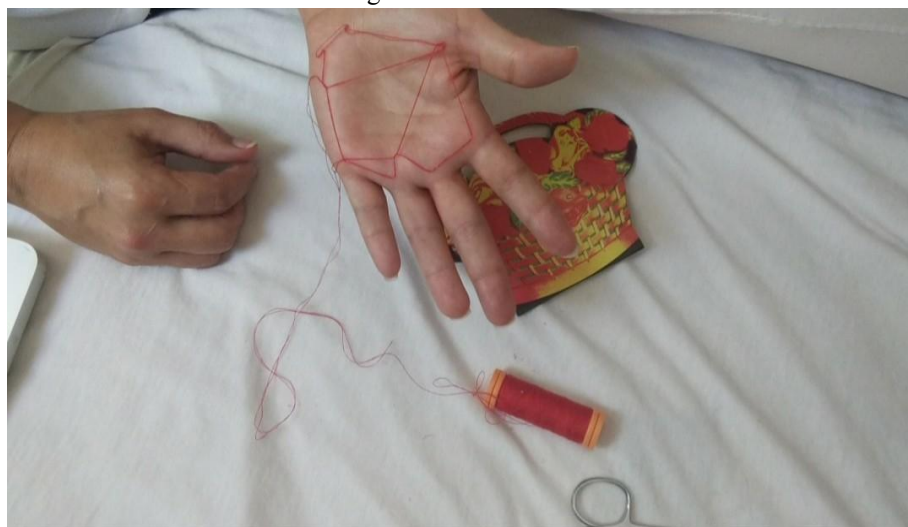
Imagem 3 - Emaranhados