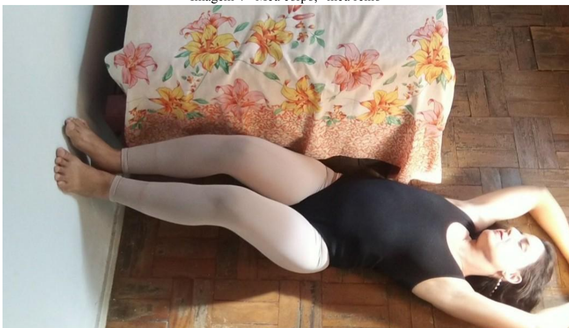
Imagem 4 - Meu corpo, meu reino”