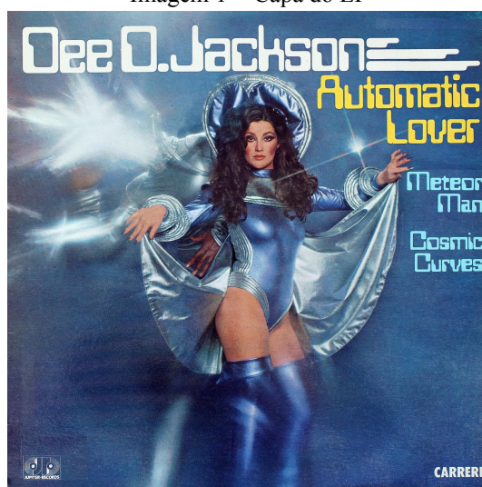
Imagem 1 - Capa do EP

Compartilho na sequência a capa do EP da artista Dee D. Jackson, o qual leva o nome da música Automatic Lover.