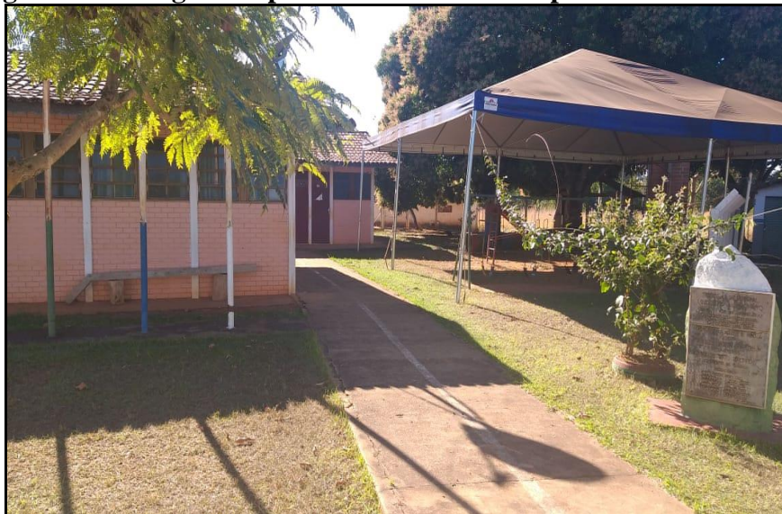
Autor: REIS, Walifer (2020).

A Escola Municipal José Cândido da Silva foi criada pela da lei nº 341 de 24 de novembro de 1978 e 1.197 de 20 de agosto de 1993, e está autorizada a ministrar a Educação Infantil – Modalidade Pré-escola (Jardim I e Jardim II) e o Ensino Fundamental do 1º ao 5º ano, de acordo com a Autorização de Funcionamento Resolução nº 645, de 14/10/1997 – do Conselho Estadual de Educação (CEE). Possui 03 (três) salas de aula, estando duas salas em funcionamento. Uma sala de Coordenação Geral, 01 sala de Professores, 01 sala do laboratório de informática, 01 cantina, 02 banheiros para uso de alunos e funcionários (PPP,2020).