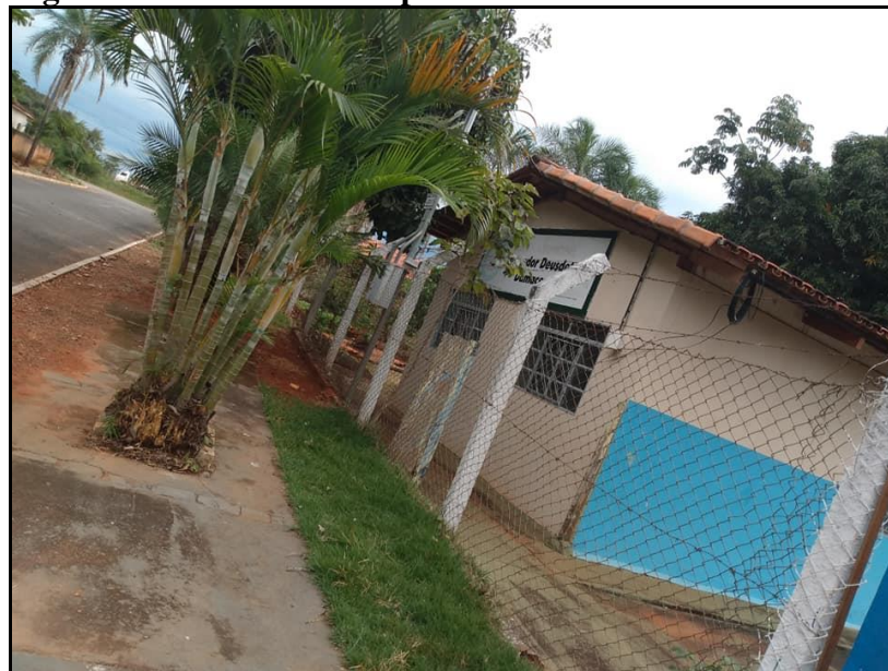
Fotografia 1: Escola Municipal Vereador Deusdete Damacena