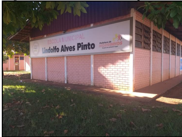
Autor: REIS, Walifer (2020).