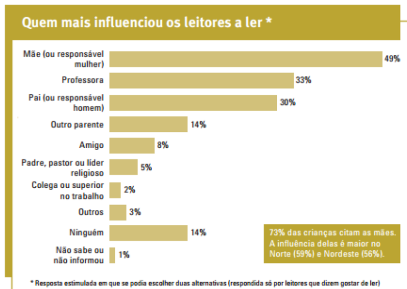
Gráfico 2 - Quem mais influenciou os leitores a ler *