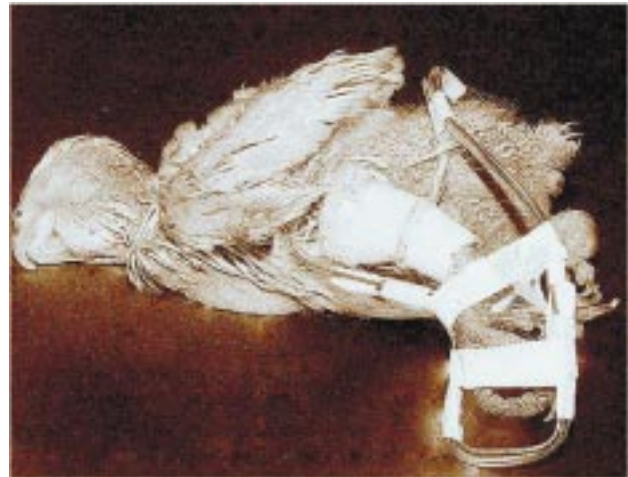
Figura 2. Fotografia da cacatua imediatamente após o procedimento cirúrgico, demonstrando a adequação do aparelho de Thomas modificado ao membro operado.

ao exame clínico, ausência de movimentação entre as extremidades ósseas da fratura. Além das informações obtidas no exame clínico, a avaliação radiográfica confirmou a formação e início da consolidação do calo ósseo. A remoção do fio intramedular foi realizada aos 35 dias decorridos da cirurgia, ocasião em que o exame radiográfico demonstrou que a consolidação óssea já era significativa.