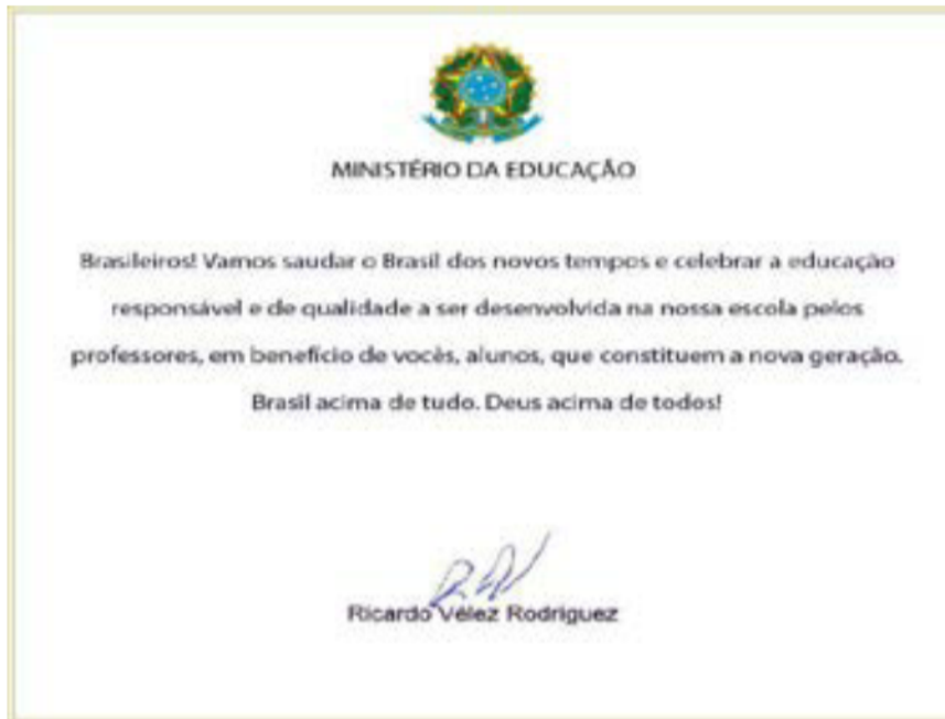
Figura 1 – mensagem encaminhada às escolas em 25 de fevereiro de 2019 pelo MEC 2 .

apareceu um enunciado e não outro em seu lugar (FOUCAULT, 2012, p. 33). Neste sentido, a carta encaminhada por e-mail para as escolas, tratada enquanto acontecimento discursivo, nos faz pensar, conforme Foucault (2011, p. 26), que “o novo não está no que é dito, mas no acontecimento de sua volta”. Deste modo, não há um modelo disponível, o que é dito é da ordem do acontecimento, se refere a condições de existência, estabelece relações, pode fazer surgir ou apagar determinados enunciados.