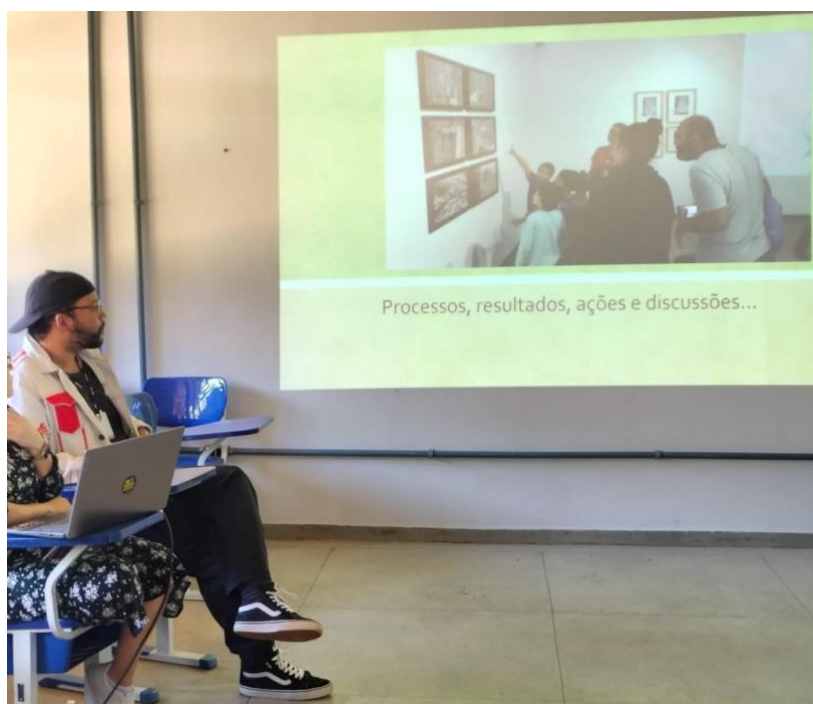
Foto 7 - Apresentação no Congresso de Arte e Educação Infantil, “Experiência Estética na Educação Infantil: Apreciação de Exposição Artística da Galeria de Arte”.