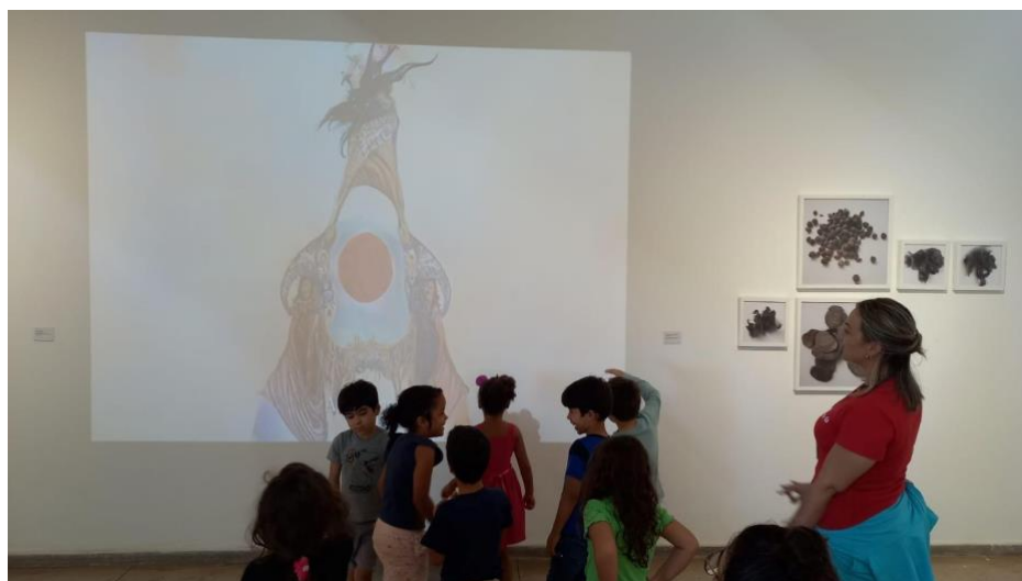
Foto 6 - Na galeria