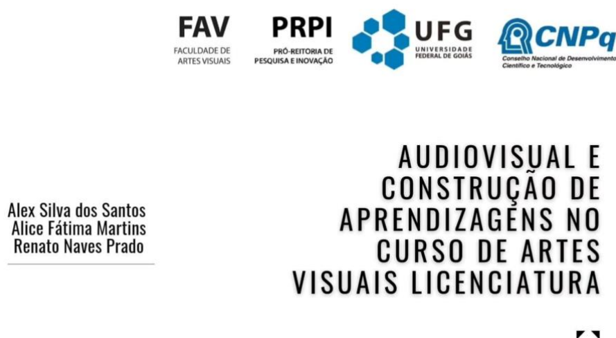
Figura 2 - Capa e tema da Iniciação Científica

artística tem a sua relevância junto com as disciplinas teóricas para a formação docente, escutar cada discente e seus pontos de vistas, fez chegar a resultados satisfatórios.