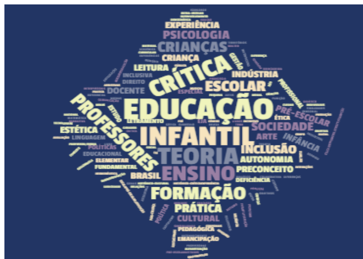
IMAGEM 1- Nuvem de palavras das palavras-chave dos trabalhos encontrados.

Outro dado analisado pelo levantamento bibliográfico foi a reincidência de palavras-chave nos trabalhos encontrados. Esses dados foram organizados em uma nuvem de palavras, a imagem 1, que apresenta todas as palavras-chave dos trabalhos encontrados. A tabela 2 apresenta as quatro palavras-chave com maior número de reincidência (as demais palavras tiveram reincidência menor do que 9 (nove) vezes).