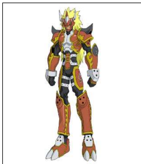
Imagem 15: Agnimon

Em uma conversa com um dos frequentadores do evento que estava vestido com um cosplay do anime Cavaleiros do Zodíaco e com uma armadura feita com EVA, ele relatou que possui mais de 80 personagens, sendo que a maioria tem armaduras. Sobre o uso das armaduras, esse experiente Cosplayer disse que a desvantagem desse tipo de personagem primeiro é o calor que faz embaixo da roupa e, segundo, que a armadura limita os movimentos. Outro participante que disse sofrer com a limitação de movimentos e o calor das armaduras foi o sujeito 18 que interpreta o personagem Agnimon do Anime " Digimon ". Seu Cosplay é feito com EVA e espuma, dando o formato da armadura, além do calor também impede determinados movimentos, principalmente de se sentar, o que é impossível vestido com ela.