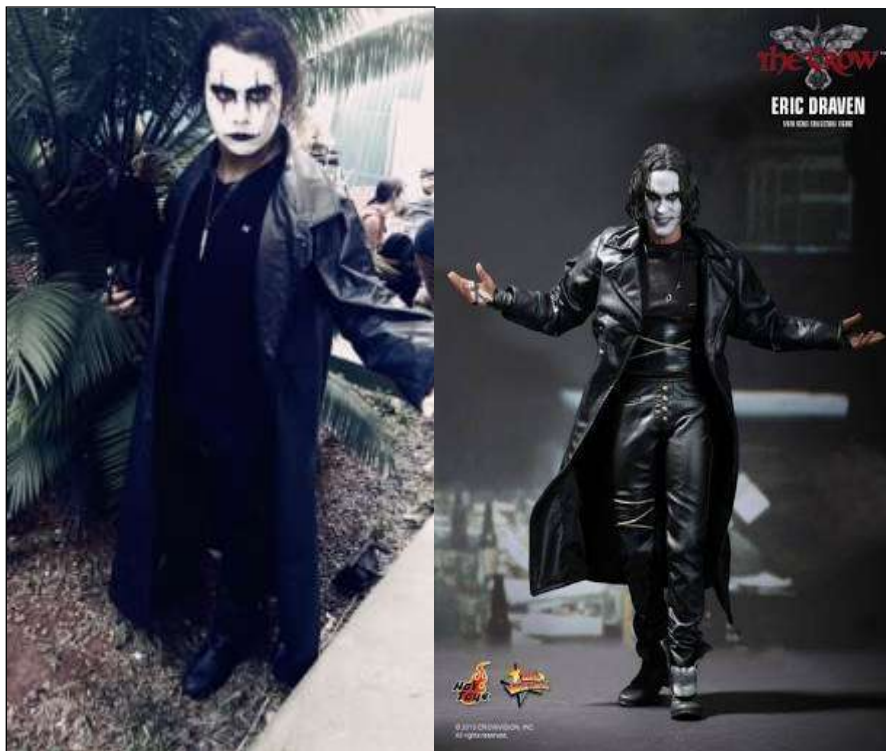
Imagem 12: Meu Cosplay O Corvo (2017) e o Personagem original do filme O Corvo (1994)

Pensando na identificação com os personagens e a influencia que isto pode ter na escolha deles, eu posso afirmar que me identifico com os personagens sombrios, os vilões. Um exemplo disto é meu cosplay do Corvo do filme "O corvo", eu gosto mais desses personagens, pois combinam mais com meu estilo e fisionomia.