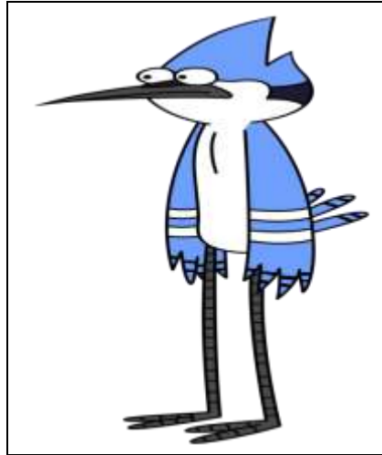
Imagem 8: Mordecai

Sobre outro aspecto, a escolha do personagem pode estar relacionada à nossa habilidade de interpretação e/ou personagens de histórias que nos identificamos. Quando eu escolhi o Jason dos filmes "Sexta Feira 13" observei o quão conhecido ele era, e também a facilidade que eu possuía em poder representá-lo. Colocar a máscara do Jason era fácil, no entanto, como já analisado, ser Cosplay não é apenas vestir uma fantasia, é preciso interpretar, se comportar como o personagem, agindo com movimentos cuidadosos para que as pessoas possam sentir que é o próprio Jason que está entre elas e não apenas uma pessoa fantasiada. Nesse sentido, minha identificação com o filme facilitou o processo de interpretação do personagem. O meu porte físico também era compatível, o que ajuda a dar credibilidade e realismo a experiência Cosplay. Abaixo algumas imagens do Jason original do filme e meu Cosplay desse personagem.