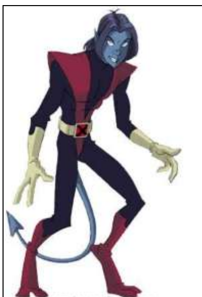
Imagem 14: Noturno de X-men Evolution

O material usado para confeccionar às vezes se torna complicado, pois nem todo material que é preciso para se fazer algumas peças é encontrado com facilidade em lojas. Neste sentido, grande parte dos cosplayers fazem seu personagem usando EVA, como o sujeito 15 que tem uma armadura do personagem Shiryu do Anime Cavaleiros do Dragão toda feita de EVA. Para o personagem do sujeito 15, o Noturno do desenho X-men Evolution , foi necessário construir um suporte para calçado de madeira no formato dos pés do personagem. Como é possível observar na imagem abaixo, o Noturno tem pele azul e três dedos em cada mão, para tanto a pele foi pintada com tinta, as mãos com luvas deram o formato dos três dedos. Nesse caso, a roupa em si não foi tão difícil de fazer, o desafio foi na interpretação do Cosplay, pois os pés geram dificuldades no equilíbrio e no caminhar por causa dos formatos dos pés.