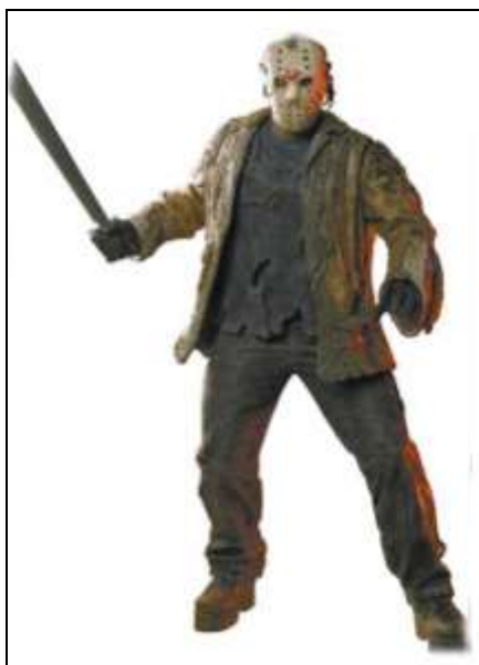
Imagem 9: Jason original do filme Sexta Feira 13