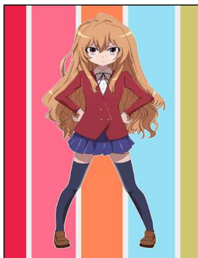
Imagem 11: Taiga Aisaka

Destacam-se questões de ordem prática, como ponderar as possibilidades concretas de confecção do personagem, e de ordem subjetiva, como as afinidades encontradas com os personagens, sejam afinidades físicas, de caráter ou de estilo. O que há em comum entre as escolhas é que essas ocorrem de forma diretiva, intencional, associando características da pessoa com seu Cosplay, como no caso do sujeito 6 que disse ter uma paixão por baixinhas, isto pode ser remetido a sua própria estatura, de modo que isso facilita a personificação de personagens de baixa estatura, um deles o qual a mesma mencionou é a Taiga Aisaka . Sobre esse caso, destaca-se ainda que a identificação com a personagem pode estar associada a tanto à identificação com a própria estatura como por se tratar de uma heroína.