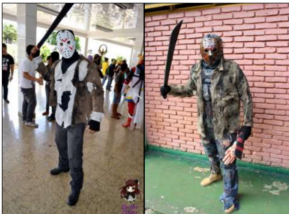
Imagem 10: Cosplay Jason 1ª versão (2014) e Cosplay Jason 4ª versão (2017)

Nessas imagens é possível observar duas versões de um mesmo Cosplay, a esquerda está minha primeira de versão (2014), já a direita é a última e atual (2017). Analisando a evolução do personagem, percebo um salto na transformação do Cosplay em sua caracterização, que vai do simples ao elaborado.