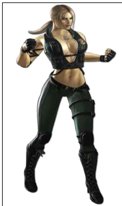
Imagem 4 Sonya Blade Mortal Kombat

Deste modo, pude observar que tanto no questionário quanto no meu ciclo de amizades é notório o interesse pela interpretação de personagens de gênero diferente de seu interprete. O interessante é que as mulheres parecem se sentir mais confortáveis em fazer esta troca, o que não impede os homens de fazer também, como podemos observar acima. Mas o que pode-se observar na sociedade em si é que quando se trata de mulher é algo aceito, mas quando se trata de homens fazendo papéis femininos ocorre mais facilmente à discriminação, até mesmo no meio Cosplay pode-se observar este comportamento.