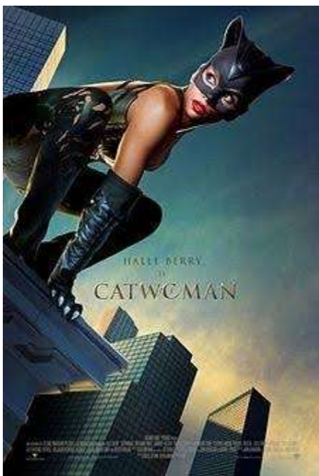
Imagem 3 Mulher Gato