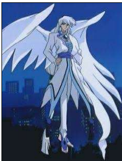
Imagem 13: Yui de Sakura Card Captor