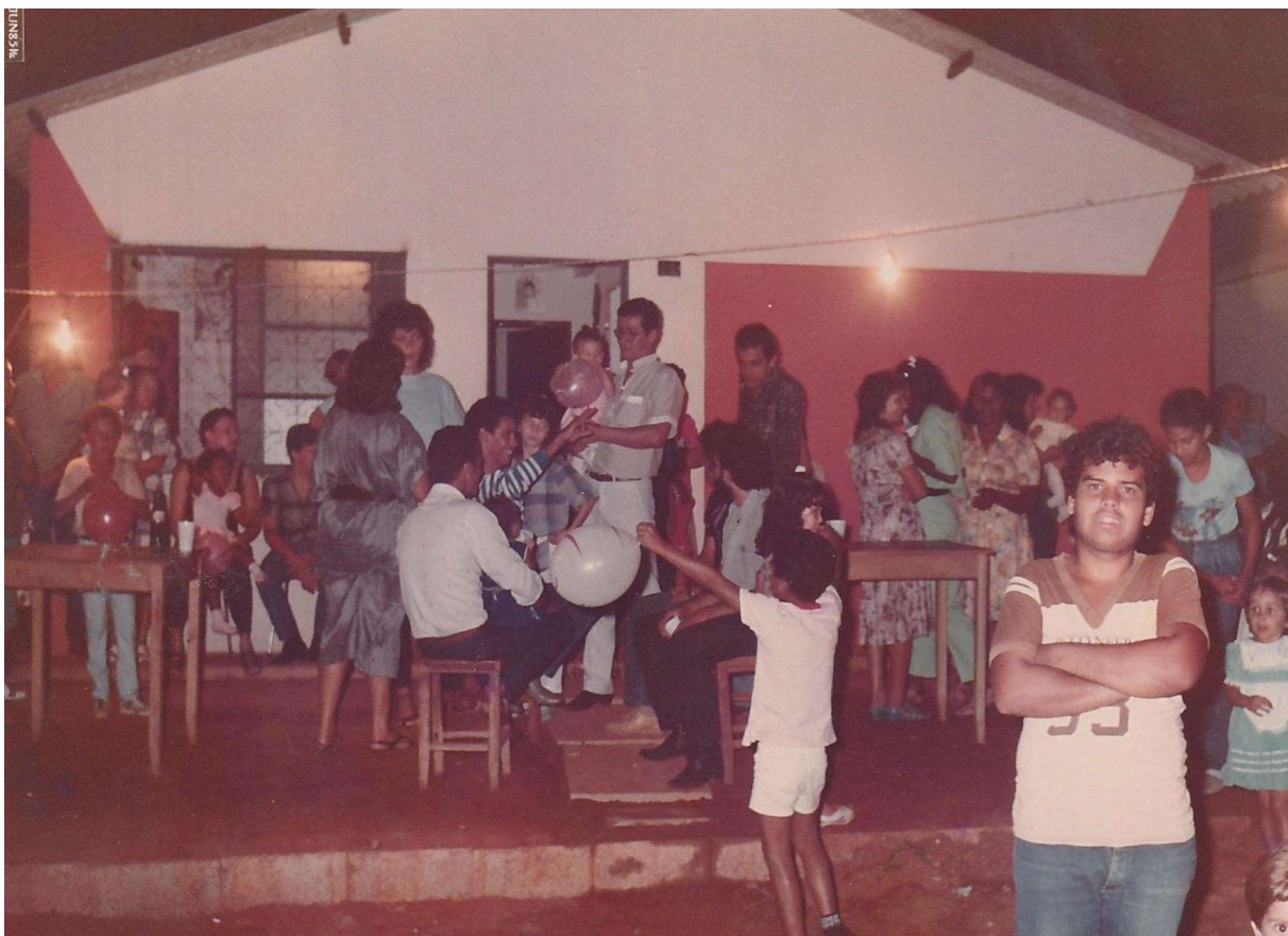
Figura 3 — Meu aniversário de 4 anos.

Não precisei saber da boca delas sobre o sentimento de saudade que elas tinham de sua terra natal, que, por muitas vezes, era suprida pela música do Rei do Baião. Esses saberes, assim como tantos outros, fui aprendendo a partir de escutas e observações, o que serviu de base para entender e encarar um mundo que me esperava lá fora, e nem sempre da melhor forma.