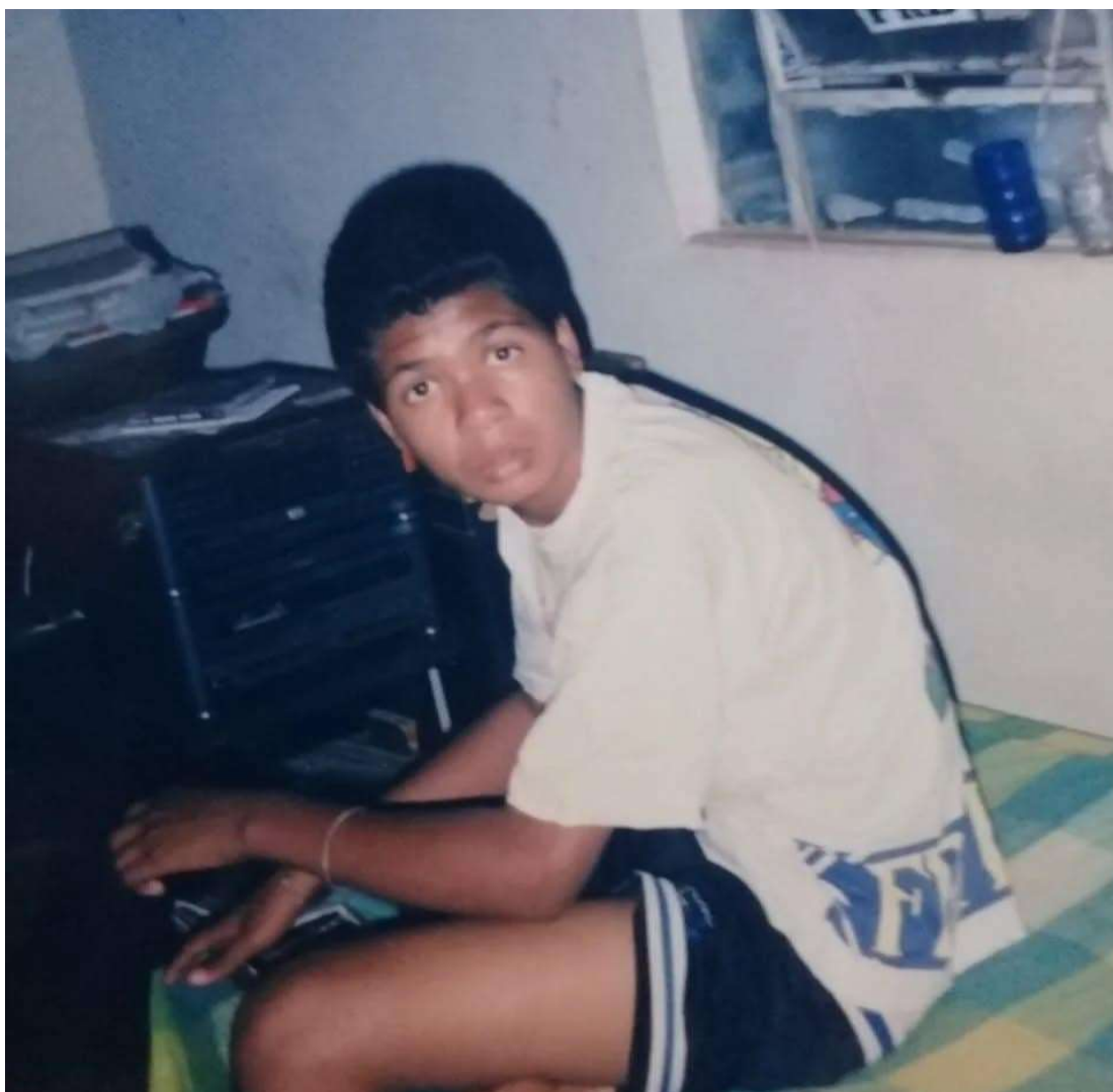
Figura 4 — No quarto do meu irmão ouvindo música.

Matam humilham e dão tiros a esmo E a polícia não demonstra sequer vontade De resolver ou apurar a verdade Pois simplesmente é conveniente E por que ajudariam se eles os julgam delinquentes E as ocorrências prosseguem sem problema nenhum Continua-se o pânico na Zona Sul” (Racionais MC’s, 1993)