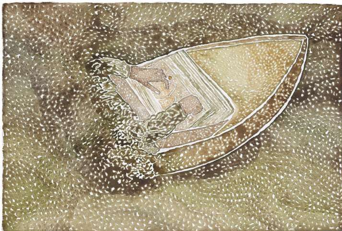
Figura 11 — Aquarela feita por mim em 2023.

Então, nesse imenso universo musical, alguns nomes são fundamentais para a minha trajetória: Luiz Gonzaga, Alcione, Tim Maia, Cassiano, Jorge Ben, Elza Soares, Trio Ternura, Chico Science & Nação Zumbi e Racionais Mc 's.