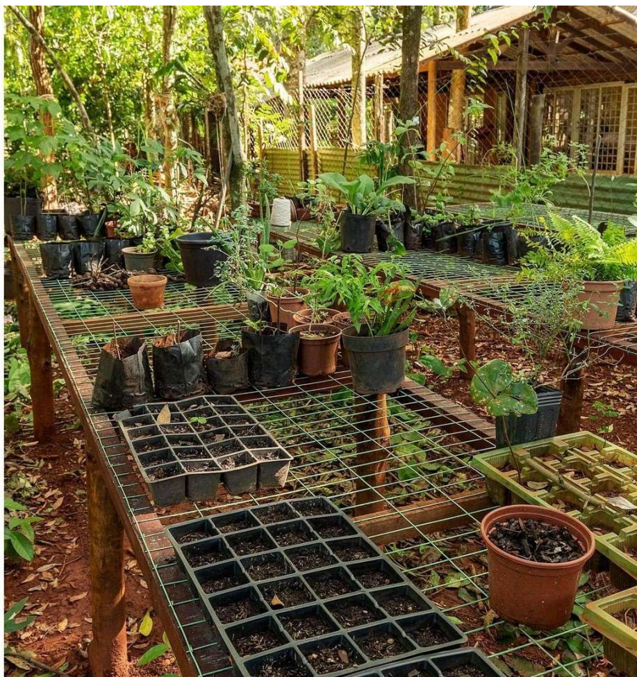
Figura 10 — Viveiro do Sertão Negro.

As aulas de cerâmica e de gravura nos fazem entender que o ensino é um trânsito, que tem aquele que passa a informação e que aprende com quem a recebe, num movimento cíclico. E é assim que se dá as dinâmicas das aulas, que seguem um plano de ensino, mas que dão espaço para a pesquisa e confluências entre os saberes, o que facilmente poderia ser entendido como uma metodologia baseada na A/R/Tografia, em que pesquisa, ensino e arte se entrelaçam.