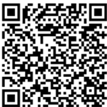
QR Code das músicas citadas neste trabalho

A frase acima foi retirada da música Periferia é Periferia (Sobrevivendo no Inferno, 1997), do grupo de rap Racionais MC's, e que sucede parte do título deste trabalho de conclusão de curso, da mesma música, e que se intitula “Nas ruas áridas da selva: vivência e produção artística para a contribuição pedagógica”.