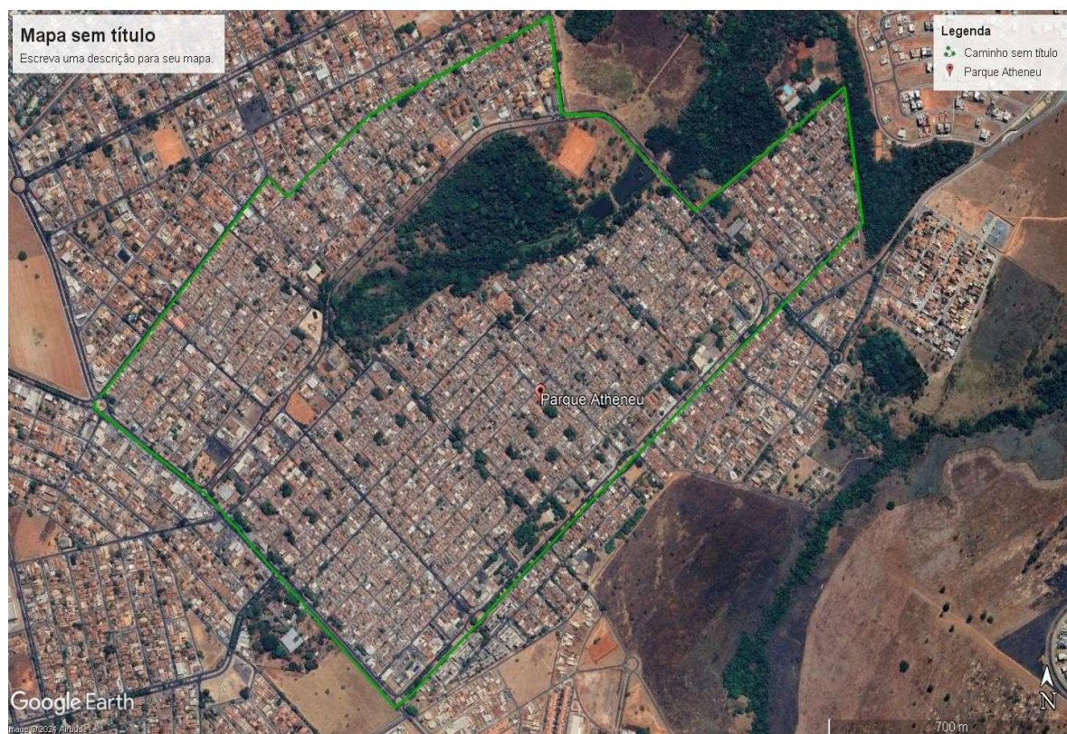
Figura 1 — Mapa do bairro Parque Atheneu.

O interior afetivo da morada, aquele pedaço de terreno em que se situa a casa onde fui criado, no Parque Atheneu, bairro deslocado do centro e situado na Região Sul de Goiânia, é um espaço muito representativo. Primeiro, pelo fato de ter crescido num lugar seguro afetivamente, diferente da realidade da maioria dos meus amigos e amigas daquele período de infância e adolescência. Outro fator importante, e que destaco neste trabalho, é a função educacional que a casa teve em minha infância.