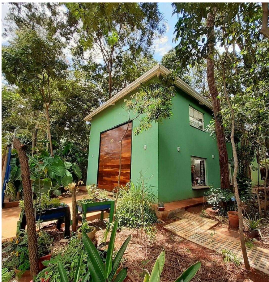
Figura 6 — Entrada do Sertão Negro Ateliê e Escola de Artes.

“seu boiadeiro por aqui choveu seu boiadeiro por aqui choveu choveu que abarrotou foi tanta água que meu boi nadou”