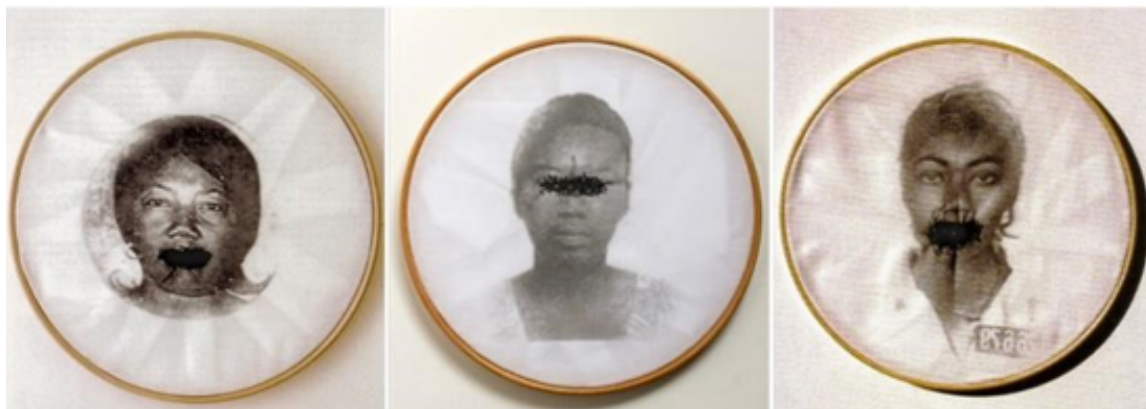
Figura 15: Rosana Paulino. Bastidores, 1997. https://www.bienalmercosul.art.br/bienal-12-obras/Parede-da-Mem%C3%B3ria-

Artista visual, pesquisadora e educadora, Rosana Paulino, foi homenageada na 12ª Bienal do Mercosul. Seu trabalho se destaca no debate em relação às manifestações contra o racismo e a posição social da mulher negra no Brasil e no mundo. Seu trabalho utiliza elementos considerados de uma “cultura feminina”, como bordados e costuras.