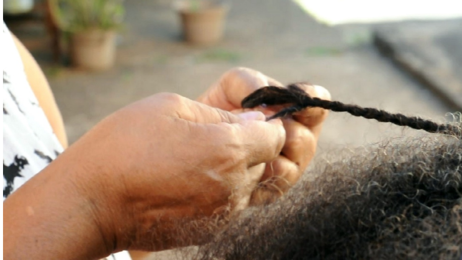
Figura 12: Estão sendo tecidos. Helô Sanvoy, 2013 – 2018. (Vídeo) https://www.bienalmercosul.art.br/bienal-12-obras/Est%C3%A3o-sendo-tecidos

No vídeo “Estão sendo tecidos”, o artista nascido em Goiânia, registra uma conversa com sua mãe, enquanto ela trança seu cabelo e com sua esposa, associando o momento de cuidados pessoais a reflexão sobre histórias particulares que se misturam com o contexto geral de famílias que vivem em cidade de interior: as condições, dificuldades e desigualdades sentidas por todos.