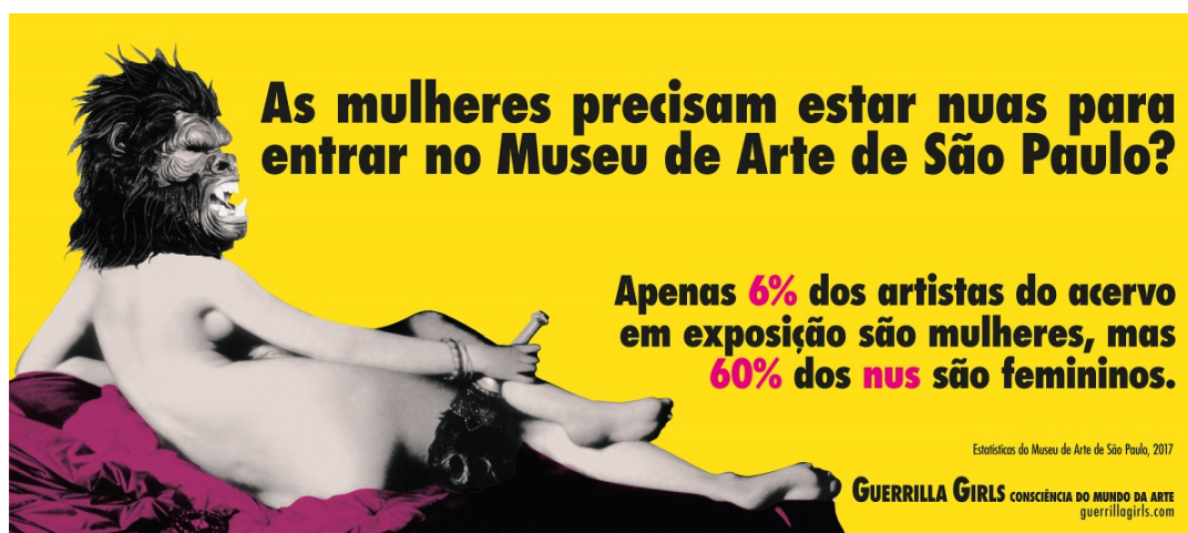
Figura 4: Arte gráfica para Museu de Arte de São Paulo Assis Chateaubriand (MASP). Guerrilla Girls, 2017/2018.

https://masp.org.br/acervo/busca?author=guerrilla+girls