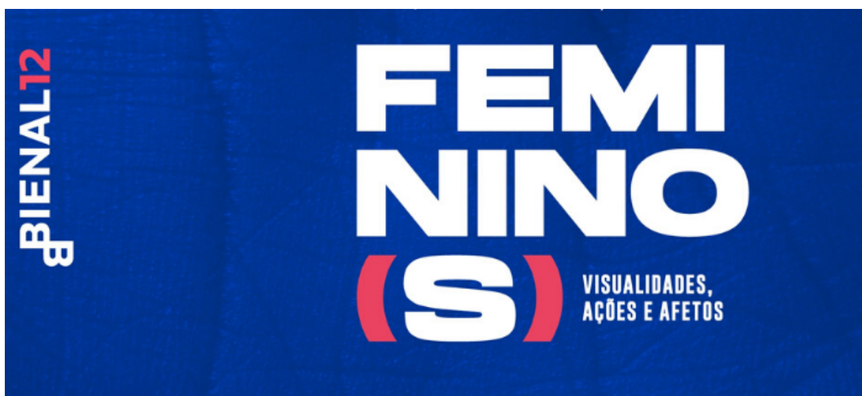
Figura 9: Divulgação da 12ª edição da Bienal do Mercosul https://www.bienalmercosul.art.br/

A edição mais recente da Bienal do Mercosul, intitulada “Bienal 12 Feminino (s). Visualidades, ações e afetos”, discute amplamente sobre a complexidade da representação da mulher na sociedade, os desafios do dia a dia e assuntos relacionados.