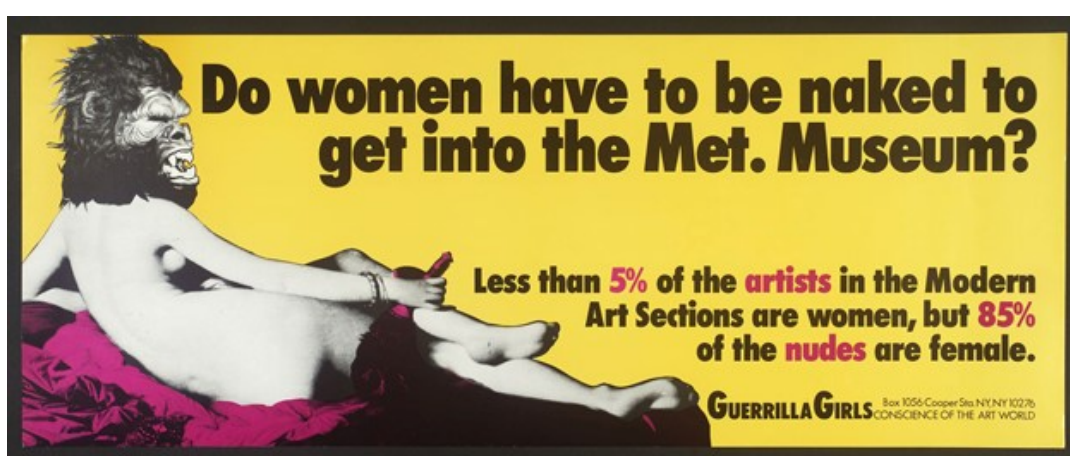
Figura 3: Arte gráfica para Metropolitan Museum (Met. Museum). Guerrilla Girls, 1989.

Com trabalhos gráficos, o coletivo mostra o resultado do levantamento e análise das desigualdades de participação de gênero nos acervos de grandes museus e exposições pelo mundo.