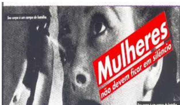
Figura 1: Barbara Kruger. Mulheres não devem ficar em silêncio, 1992.

http://anpap.org.br/anais/2019/PDF/ARTIGO/28encontro_____BARBOSA_Ana_Mae_572-581.pdf