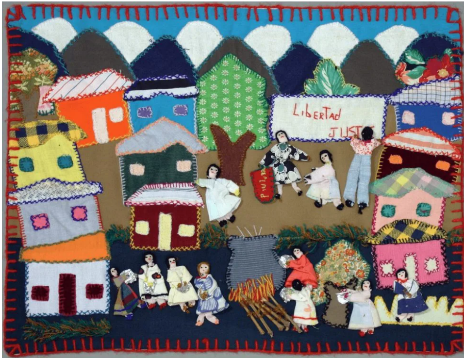
Figura 11: Olla común. Arpilleras MMDH. (Tecido e bordado). https://www.bienalmercosul.art.br/bienal-12-obras/Olla-com%C3%BAn

comunidade de reagir de maneira positiva à situação, dando voz as vítimas de violência, aprendendo juntos, conversando, se expressando.