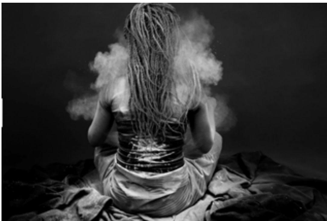
Figura 14: Gladys Kalichini. Burial: Erasing Erasure, 2017. https://www.bienalmercosul.art.br/bienal-12-obras/Burial%3A-Erasing-Erasure

A produção da artista Gladys Kalichini tem como foco a história colonial, marginalização e memória sobre narrativas de mulheres. Na vídeo instalação “Burial: Erasing Erasure”, ela remonta uma prática de sepultamento zambiana, remetendo a perda e ao desaparecimento de histórias de mulheres.