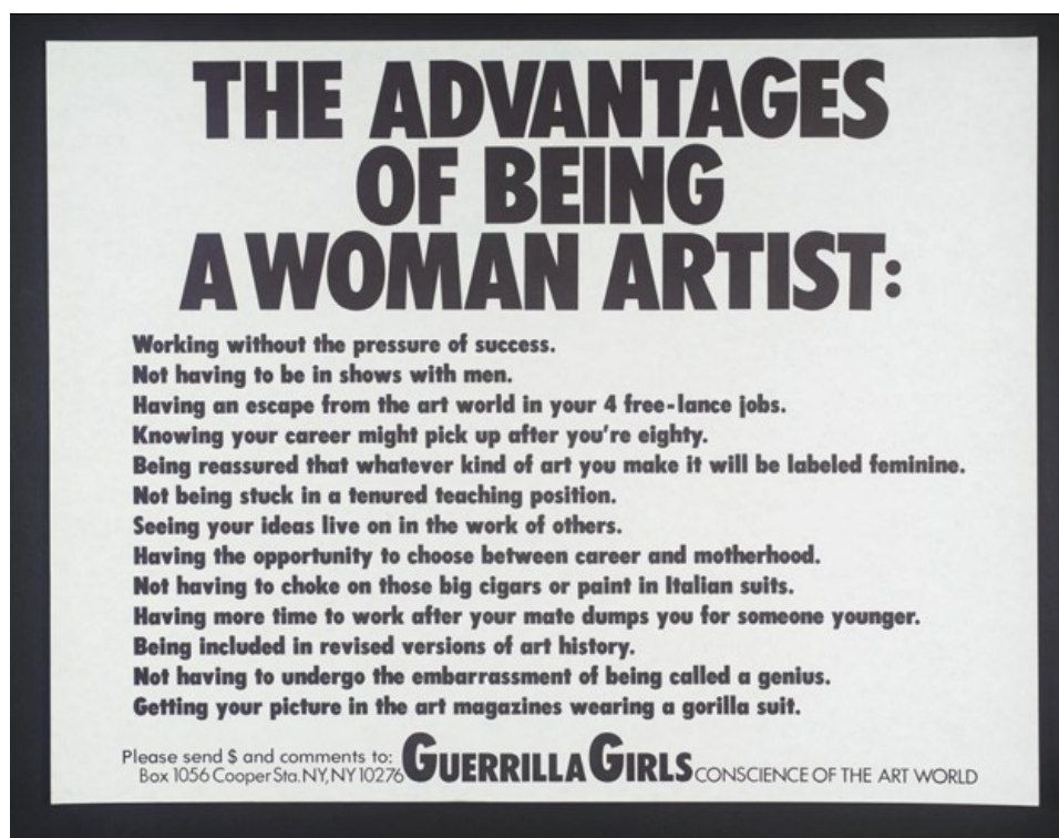
Figura 5: “The advantagens of being a woman artist”, Guerrilla Girls.

exemplificam como as artistas manifestam seus olhares e sua crítica, enfatizando o desequilíbrio da participação de homens e mulheres no meio artístico, bem como a superexposição dos corpos femininos.