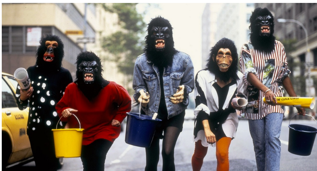
Figura 2: Guerrilla Girls, 1985.

( https://revistacult.uol.com.br/home/guerrilla-girls-no-brasil-masp/ )