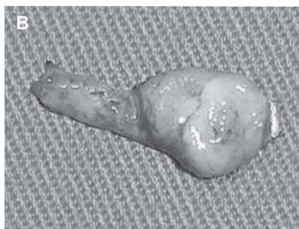
Figura 2. Exposição e remoção da glândula da terceira pálpebra de cão (A). Visualização da glândula removida (B). Uberlândia, MG.

Os resultados obtidos neste experimento foram coincidentes com os observados por Saito et al. (2001), que relataram não existir diferença significativa entre os valores mensurados no pré-operatório e aos 60 dias após a remoção da glândula da terceira pálpebra em cães. Após 120 e 300 dias de PO, Saito et al. (2001) observaram diminuição na produção de lágrima e aumento significativo, com valores dentro da normalidade, após 365 dias de PO. Como no período de observação de 60 dias de PO não foi verificada diferença expressiva na produção de lágrima, os autores afirmam que possivelmente, as glândulas lacrimal principal e as acessórias mantiveram secreção compensatória na ausência da glândula da terceira pálpebra.