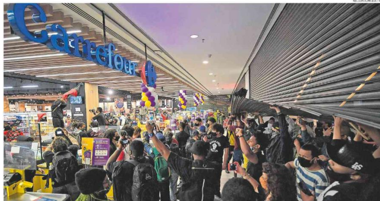
Vandalismo. Manifestantes invadem loja do Carrefour em SP; houve protestos também em Porto Alegre e em outras cidades do País

Em troca do apoio de Joice Hasselmann, Bruno Covas (PSDB) disse que estuda fazer uma "Lava Jato municipal". Guilherme Boulos (PSOL) tenta nacionalizar disputa com alianças. Centros sindicais se dividem. POLÍTICA / PÁG. A10