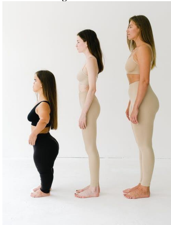
Figura 1. Nanismo