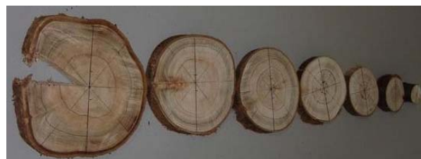
Figura 1 – Demarcação dos anéis de crescimento anuais nas seções transversais em diferentes posições longitudinais do lenho das árvores de eucalipto aos 48 meses.

O resultado da mensuração da circunferência do tronco sem casca de oito árvores de eucalipto/tratamento, a cada 1 m no sentido longitudinal do tronco (diâmetro mínimo de 2 cm), realizada anualmente (1°,