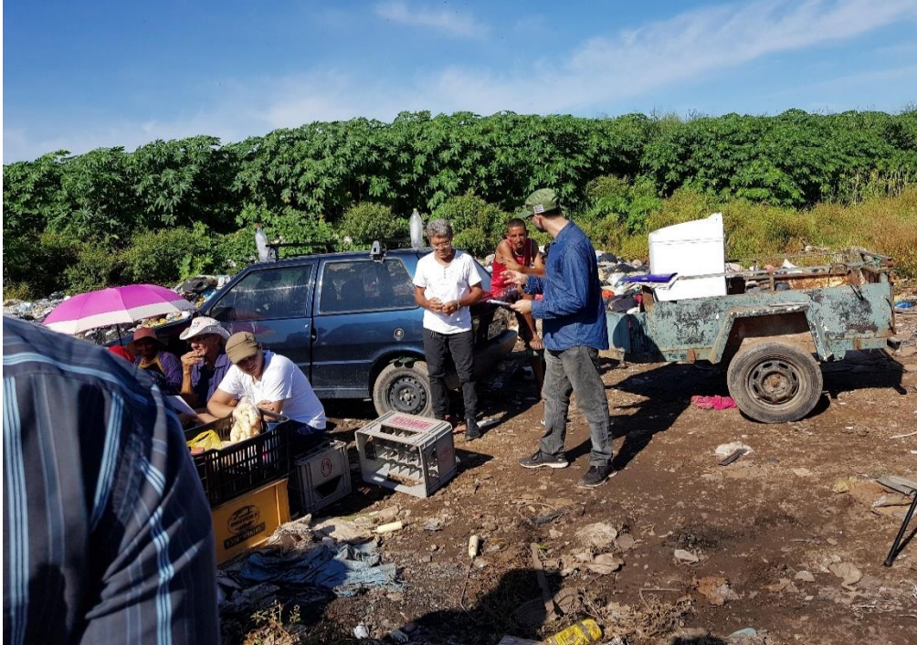
Fotografia 5 - Formação da Cooperativa de Catadores no Lixão de Goiás