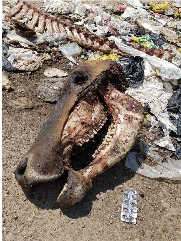
Fotografia 7 - Descarte (inadequado) de restos de animais no lixão