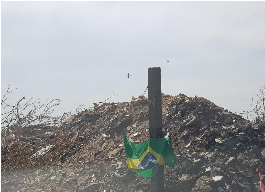
Fotografia 1- Entre o lixo e o progresso