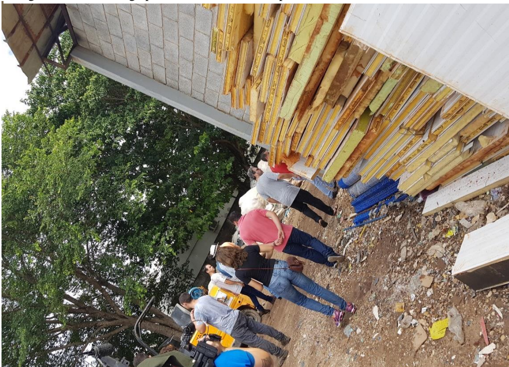
Fotografia 4- Visita ao galpão da Prefeitura Municipal de Goiás