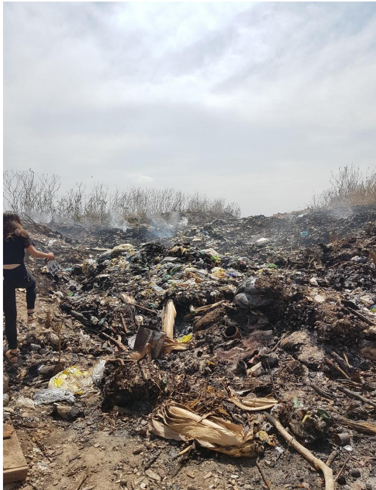
Fotografia 6 - Queimada(s) no lixão