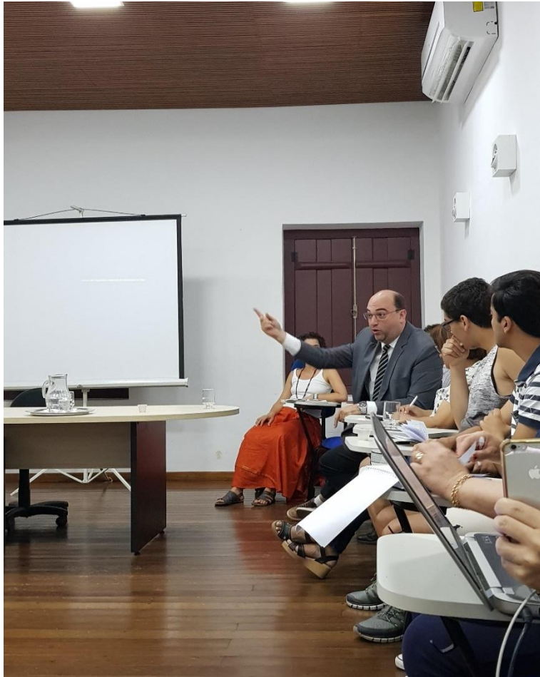
Fotografia 3- Reunião do Recicla na Prefeitura da Cidade de Goiás