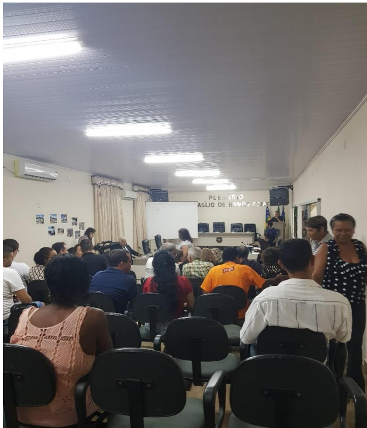
Fotografia 2 - Audiência Pública na Câmara dos Vereadores de Goiás