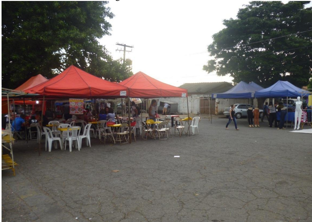
Figura 07: Feira do Amor

A Feira do Amor é bem movimentada, e tem muitos frequentadores. Nela funcionam as bancas que vendem roupas, mas a procura maior é por barracas de comidas, com vários tipos de petiscos e comidas diferentes. É uma feira que atrai não apenas os moradores do bairro, mas também muitos moradores de bairros vizinhos. A feira também conta com atrações para crianças, como brinquedos infláveis, pula-pula, piscina de bolinhas dentre outras atrações, é o lazer como mercadoria.