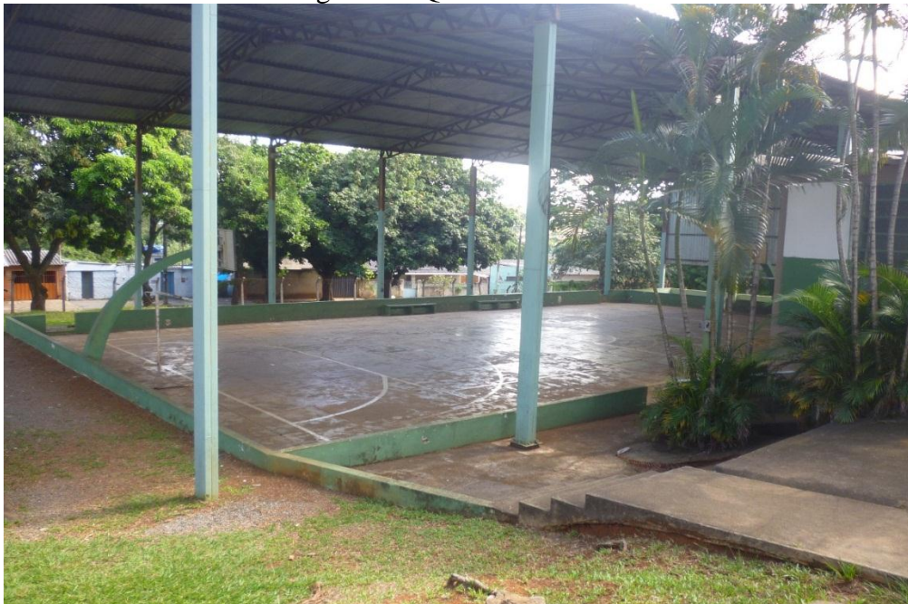
Figura 08: Quadra do CRAS

Para que fique claro os anseios da comunidade, pode ser percebido na fala dos moradores que locais para a prática do lazer existem, o que não existe é um programa de políticas públicas voltado para estes interesses. O Centro de Referência de Assistência Social (CRAS), é um desses lugares. Podemos perceber por meio de observações que o CRAS da Vila Redenção passa por problemas administrativos, em respeito à oferta de lazer para a comunidade do bairro. O CRAS tem uma estrutura física satisfatória de acordo com alguns relatos que me foram fornecidos por moradores do bairro e a partir de observações feitas no local. O espaço conta com quadra, salas, possui duas piscinas, que no momento estão desativadas, servindo de criadouro de mosquitos transmissores de várias doenças.