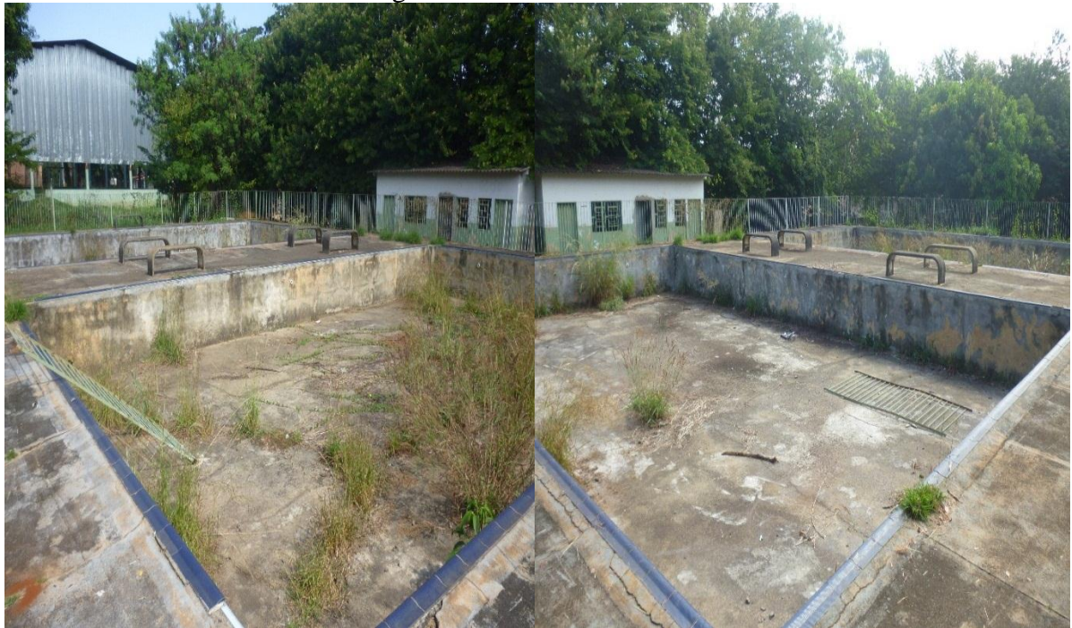
Figura 09: Piscinas do CRAS

Têm o CRAS também, lá da Vila redenção, tem uma piscina lá abandonada, tinha a hidroginástica para idosos, acho que tem três anos ou mais que não tem professor para acompanhar, e a piscina está abandonada, e ainda é prejudicial à saúde, porque é uma água parada, e a quadra de futsal do CRAS, é uma quadra, não vou dizer que é boa, é uma quadra normal, porém está sendo mais usada do que a piscina.