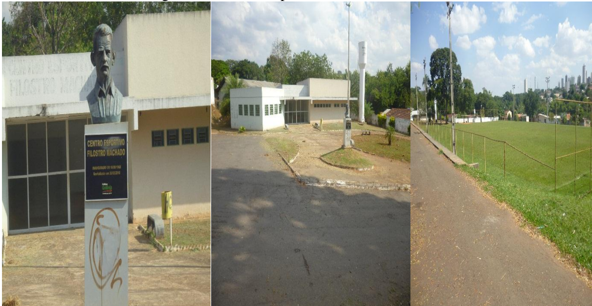
Figura 03: Centro Esportivo Filostro Machado.

Ao tratar do assunto macro equipamento polivalente, podemos destacar que a Vila Redenção possui um equipamento que contempla essas dimensões. É o caso do Centro Esportivo Filostro Machado, que somado a um micro equipamento especializado e a um equipamento médio de polivalência dirigida, se apresenta como um equipamento frequentado tanto durante a semana quanto nos finais de semana. Esse equipamento é de grande importância para a comunidade da Redenção, essa afirmação se dá por conta dos relatos que foram fornecidos no decorrer da pesquisa, por meio das observações e de entrevistas com os moradores do bairro. Dentro do Centro Esportivo, existe um parquinho para crianças, equipamentos de academia ao ar livre, espaços de convivência ao ar livre, algumas salas, um campo de futebol e uma pista de caminhada.