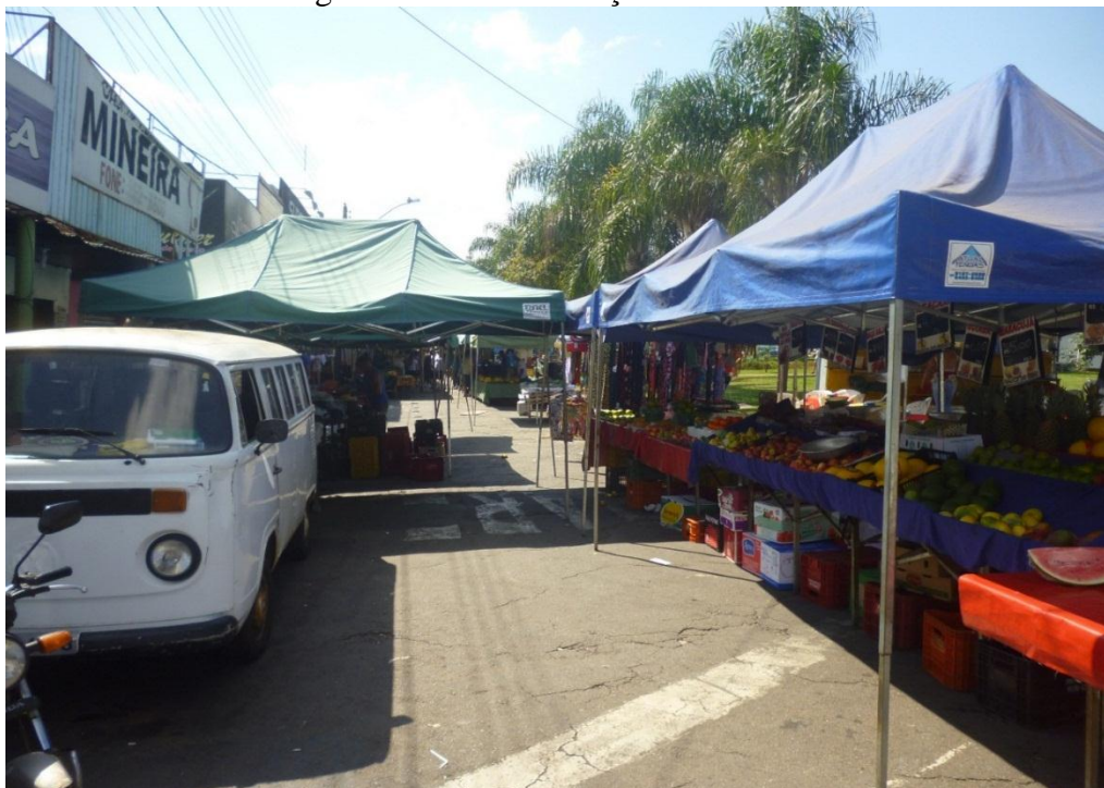
Figura 06: Feira da Praça do Comércio

Aos domingos na Praça do Comércio é realizada a feira, o que é mais um atrativo para os moradores e que é para muitos um lazer nas manhãs de domingo. Pôde ser percebido nas visitas a essa feira, que muitas pessoas da comunidade vão ao local para fazer suas compras de frutas e verduras, mas também existem os que vão à feira para comer seu pastel, frito na hora e tomar seu suco de laranja, sentado com os amigos na barraca de Pastel, um costume que para muitos é essencial para iniciar bem o domingo. A feira é muito movimentada, o que faz com que o comércio seja impulsionado, por conta das pessoas que ali se encontram. É o lazer inserido no comércio, e o comércio se movimentando a partir do lazer de alguns.