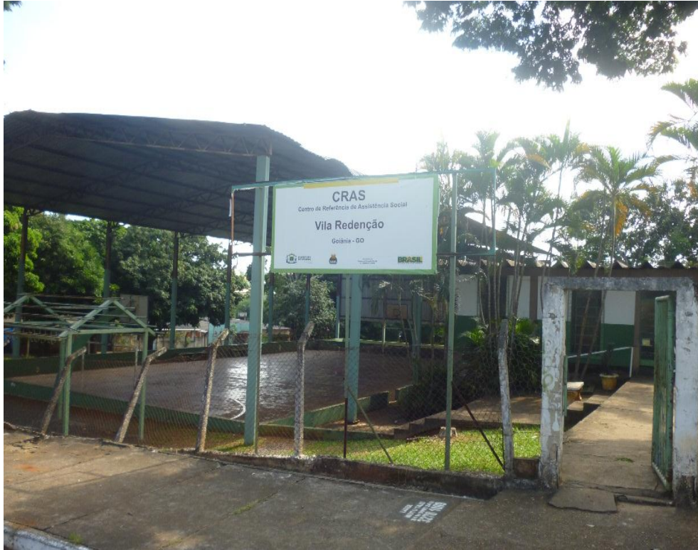
Figura 04: Centro de Referência de Assistência Social da Vila Redenção

desenvolvimento de potencialidades e aquisições, do fortalecimento de vínculos familiares e comunitários, e da ampliação do acesso aos direitos de cidadania.”.