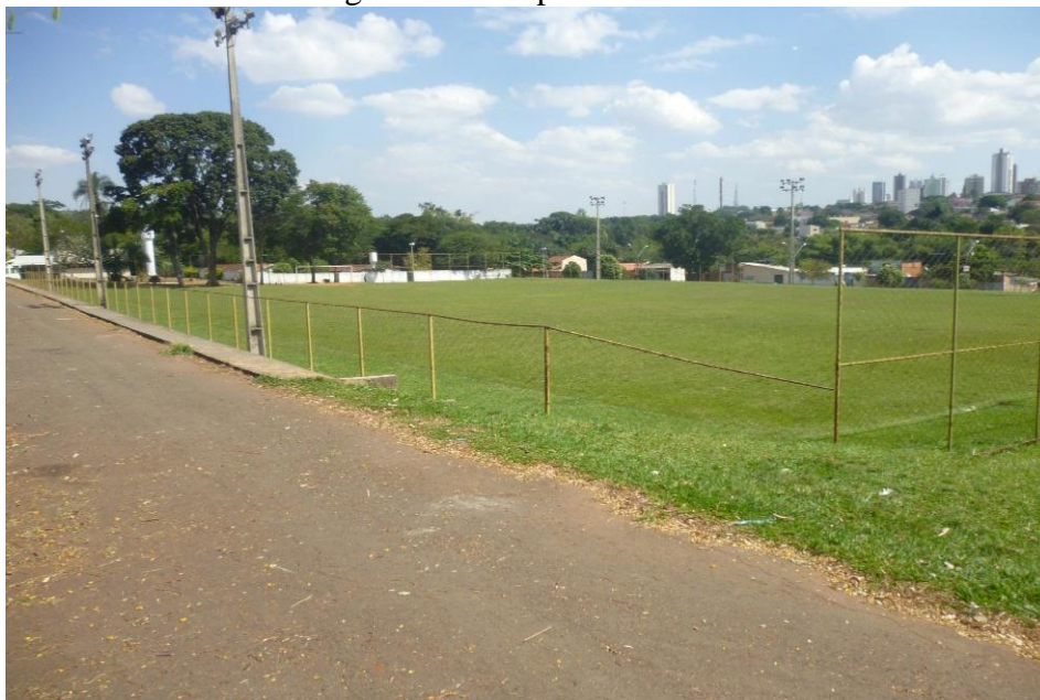
Figura 12: Campo de Futebol.

Em termo de segurança não, igual no campo que as pessoas fazem caminhada mais a noite, eu não vejo nenhum segurança, não tem o monitoramento, o que passa são as viaturas, não tem um guarda que fica olhando pelo menos as instalações que tem perto do campo, que eu acredito que tenha lá guardado alguma coisa de equipamentos que eles usam. Mas não tem nenhuma segurança não, eu acho que é falho isso. (Entrevistado (a). 03)