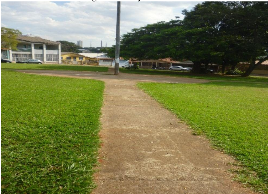
Figura 02: Praça residencial

As praças residências da Vila Redenção, apresentam algumas diferenças em suas dimensões, algumas praças são muito grandes, com bastante espaço para os moradores praticarem atividades das mais variadas especificidades. Mas ocorre que essas praças estão sendo utilizadas como micro equipamentos especializados, sendo restritas apenas aos moradores de determinadas quadras nas proximidades das praças.