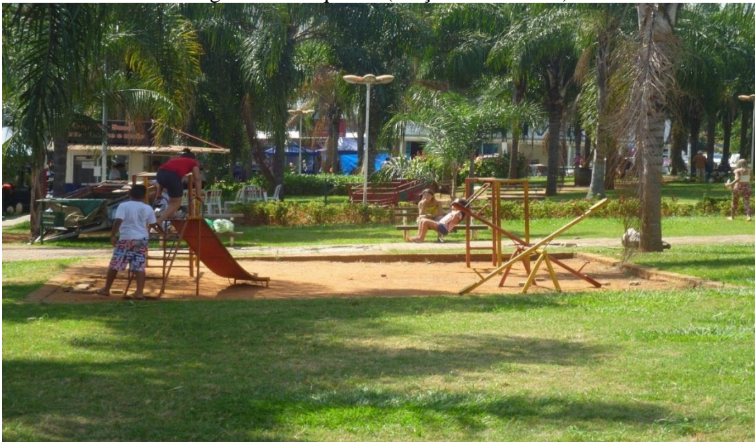
Figura 05: Parquinho (Praça do Comércio)

A insuficiência de equipamentos de lazer não é necessariamente um indicador da impossibilidade de vivência de seus conteúdos culturais. Uma Rua de Lazer é um claro exemplo de como uma via pública destinada originalmente ao tráfego de veículos e de pedestres pode ser utilizada, como uma quadra de peteca, um ateliê, um palco ou tantos outros espaços que nossa criatividade permita construir.