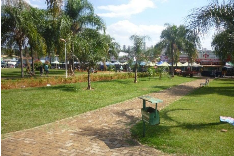
Figura 01: A Praça do Comércio