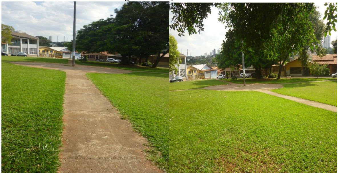
Figura 11: Praça residencial.

Dando seguimento, na questão de colocar o indivíduo inserido nos interesses da comunidade, podemos nos debruçar sobre a importância que as praças residenciais têm na Vila Redenção. Por ser um bairro que possui um total de 12 praças, sendo que dessas, 11 são praças residenciais, podemos perceber que espaços para o lazer existem, mas a partir dos relatos dos moradores, conseguimos extrair as informações, que nos levam a entender como é a realidade dentro da Redenção.