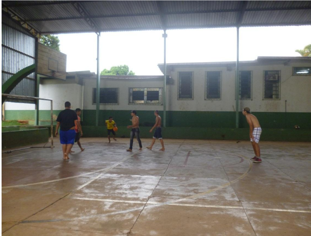
Figura 10: Quadra do CRAS

muito importante que a comunidade se enxergue como parte fundamental, para que o espaço público não se transforme em local de ninguém, sendo utilizado para atividades ilícitas.