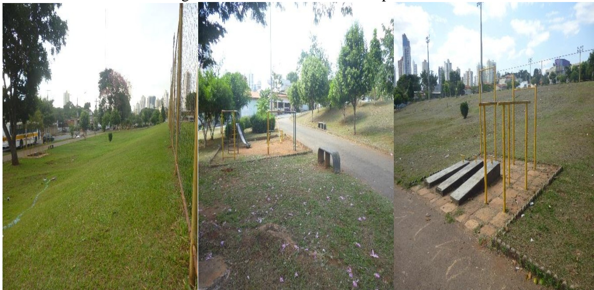
Figura 13: Área aberta Centro Esportivo

A própria valorização da rua enquanto espaço de lazer é uma questão do poder público. Nas grandes cidades existem poucos espaços públicos vazios, há falta de segurança nos equipamentos públicos de lazer e no transporte até eles, e o sistema de transporte público, por sua vez, é bastante limitado. (DE PELLEGRIN, 1996, p.36)