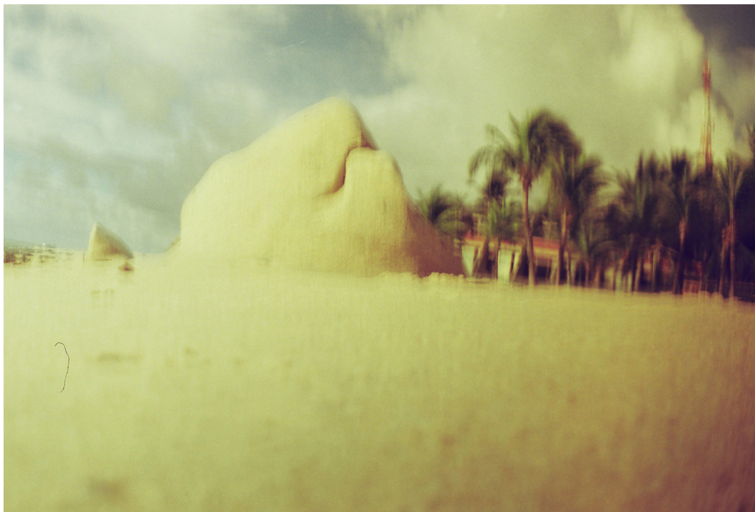
Odinaldo Costa Não me satisfaria nada menos que seguir para o mar, 2021 Fotografia analógica com redscale 90 cm x 60 cm