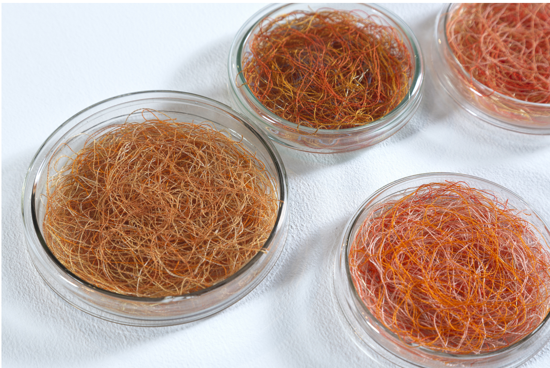
Eliane Chaud Guardados de cor , 2021 27 Placas de Petri - tamanhos 10 e 12 cm e linhas de bordar 70 cm x 160 cm Detalhe do trabalho