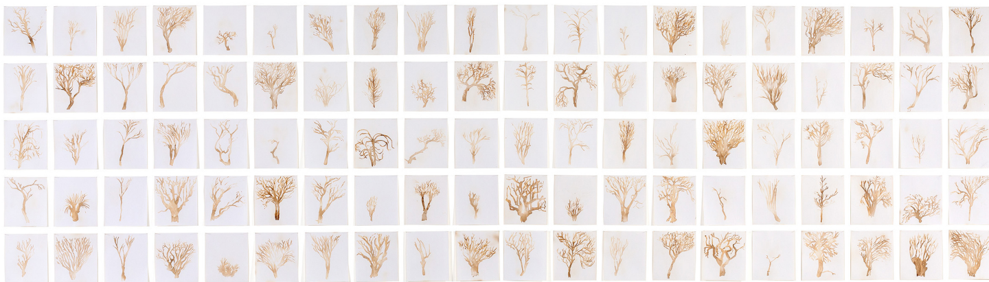
Glayson Arcanjo Queima , 2022 Pigmento natural aquecido sobre papel 130 cm x 470 cm