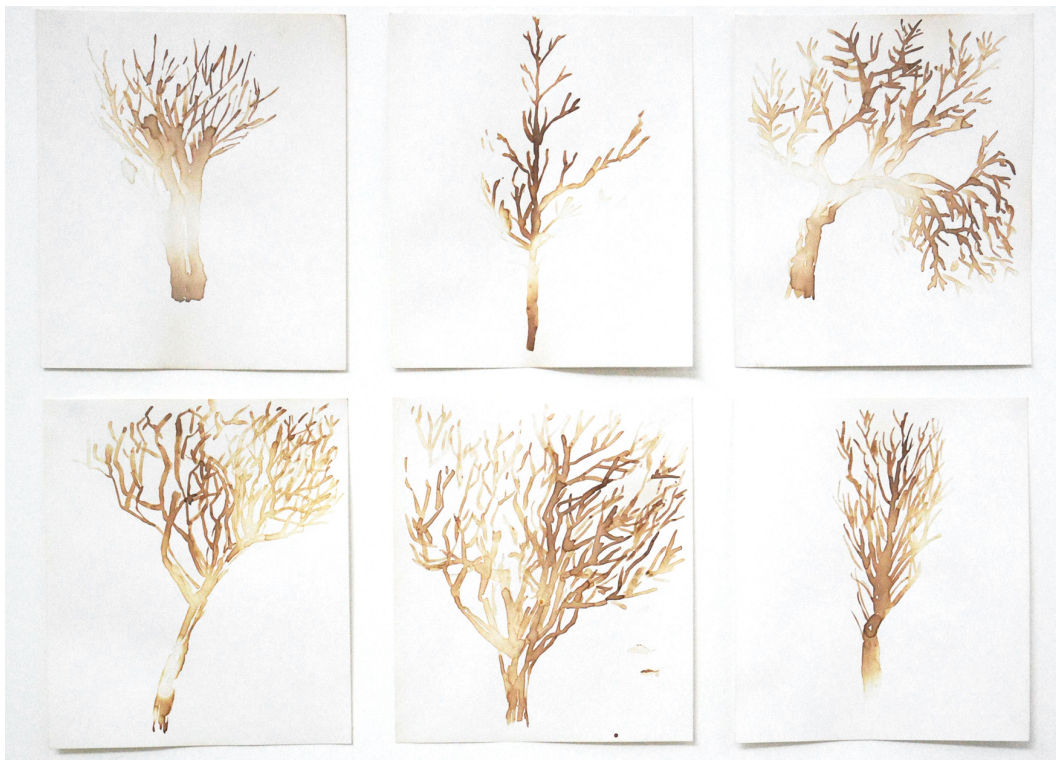
Glayson Arcanjo Queima , 2022 Pigmento natural aquecido sobre papel 130 cm x 470 cm Detalhe do trabalho