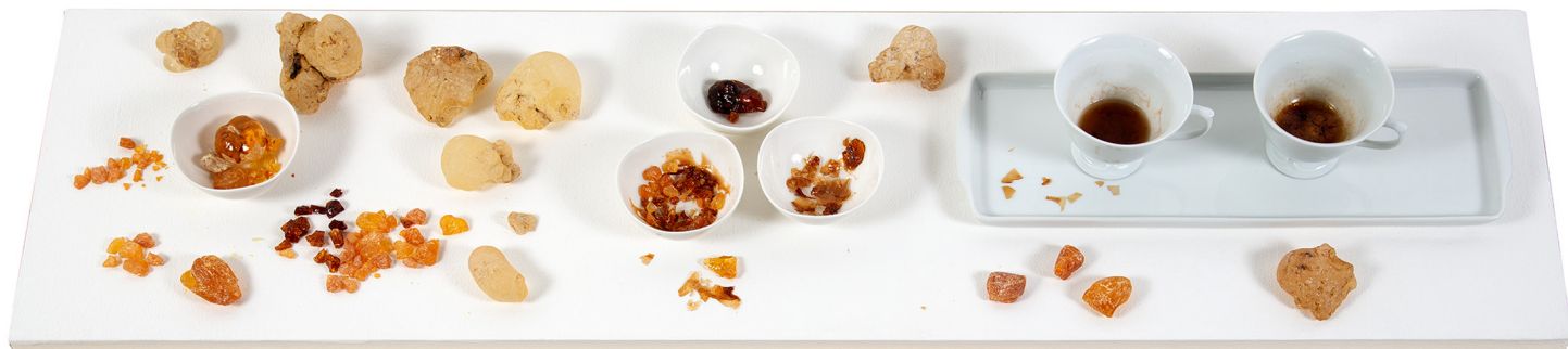
María Tereza Gomes 1 x ao dia, 2 x ao dia, 3 x ao dia , 2022 Louça branca, água, resina de árvores (angico, jatobá) 32 cm x 110 cm