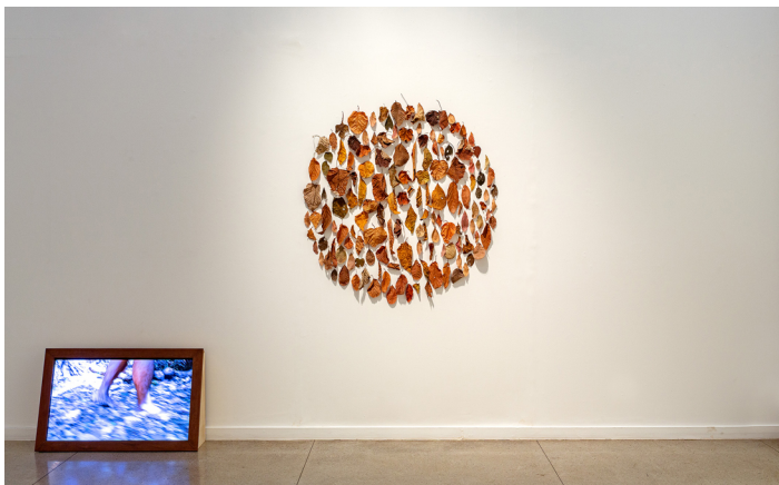
Glaysen Arcanjo. Planta-pé , 2021. Vídeo. / Quando a folha cai , 2021. Folhas coletadas. 132 cm diâmetro.

misturam com esse corpo que deriva rumo a um destino desconhecido. Algo similar acontece na imagem em que o artista, após coletar uma enorme folha seca, se fotografa segurando-a; mais uma vez, as tonalidades terrosas da vegetação e do corpo se misturam reforçando a conexão homem e natureza, num baile onírico, poético, e justamente por isso, profundamente político.