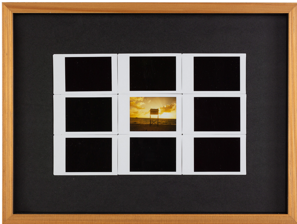
Odinaldo Costa Souvenir II , 2021 Fotografia instantânea 39 cm x 29 cm