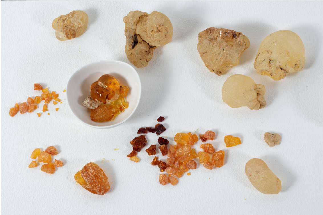
Maria Tereza Gomes 1 x ao dia, 2 x ao dia, 3 x ao dia , 2022 Louça branca, água, resina de árvores (angico, jatobá) 32 cm x 110 cm Detalhe do trabalho