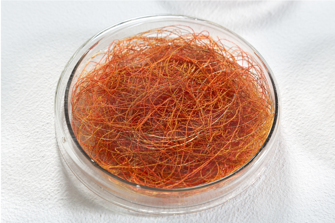
Eliane Chaud Guardados de cor , 2021 27 Placas de Petri - tamanhos 10 e 12 cm e linhas de bordar 70 cm x 160 cm Detalhe do trabalho