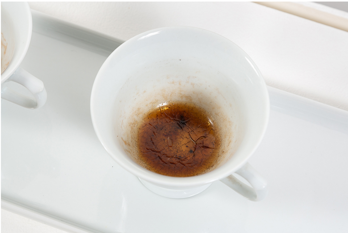
Maria Tereza Gomes 1 x ao dia, 2 x ao dia, 3 x ao dia, 2022 Louça branca, água, resina de árvores (angico, jatobá) 32 cm x 110 cm Detalhe do trabalho