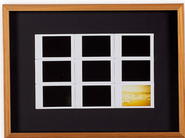
Odinaldo Costa Souvenir I, II, III, IV e V , 2021 Fotografia instantânea 39 cm x 29 cm