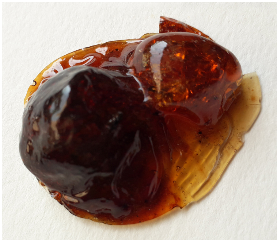
Maria Tereza Gomes 1 x ao dia, 2 x ao dia, 3 x ao dia , 2022 Louça branca, água, resina de árvores (angico, jatobá) 32 cm x 110 cm Detalhe do trabalho