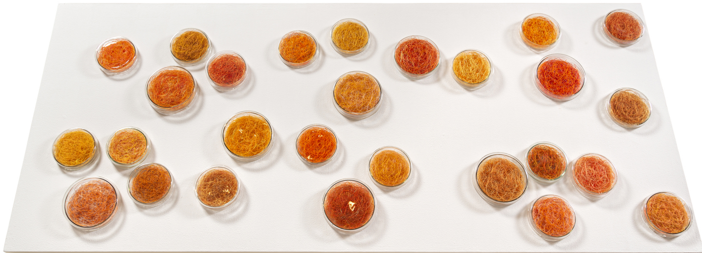
Eliane Chaud Guardados de cor , 2021 27 Placas de Petri - tamanhos 10 e 12 cm e linhas de bordar 70 cm x 160 cm