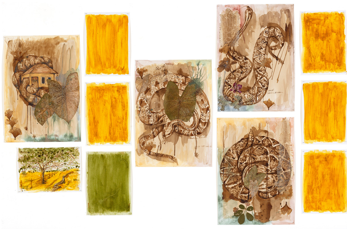
Adriana Mendonça Uma cobra de cimento serpenteando lembranças terrosas e floridas , 2021 Desenhos com pigmentos naturais sobre papel 1,60 m x 8,30 m Detalhe do trabalho