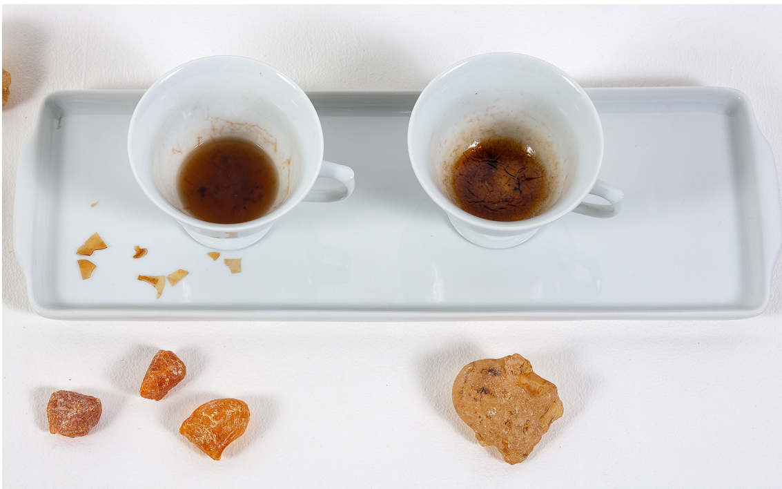
Maria Tereza Gomes 1 x ao dia, 2 x ao dia, 3 x ao dia , 2022 Louça branca, água, resina de árvores (angico, jatobá) 32 cm x 110 cm Detalhe do trabalho