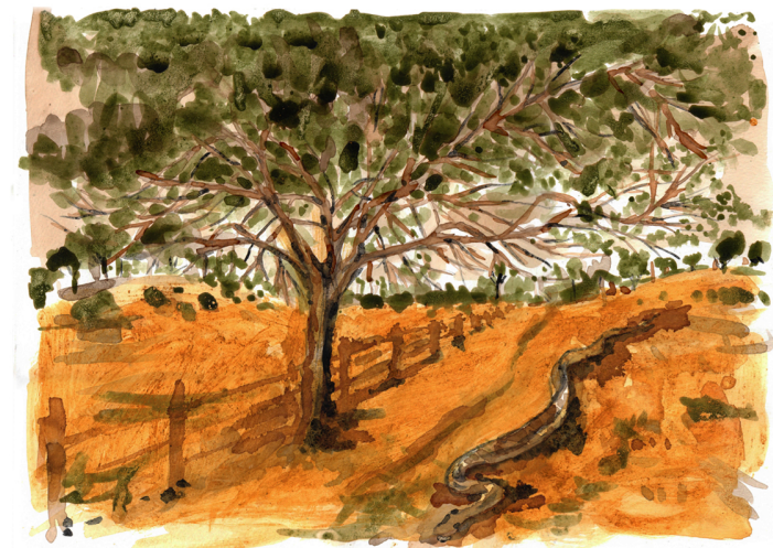
Adriana Mendonça. Uma cobra de cimento serpenteando lembranças terrosas e floridas , 2021. Desenhos com pigmentos naturais sobre papel.

mitem criar as obras que nos apresenta. Seus desenhos e pinturas nos mostram que os lampejos âmbar, como o bater de asas de uma borboleta, são labirínticos e musicais.