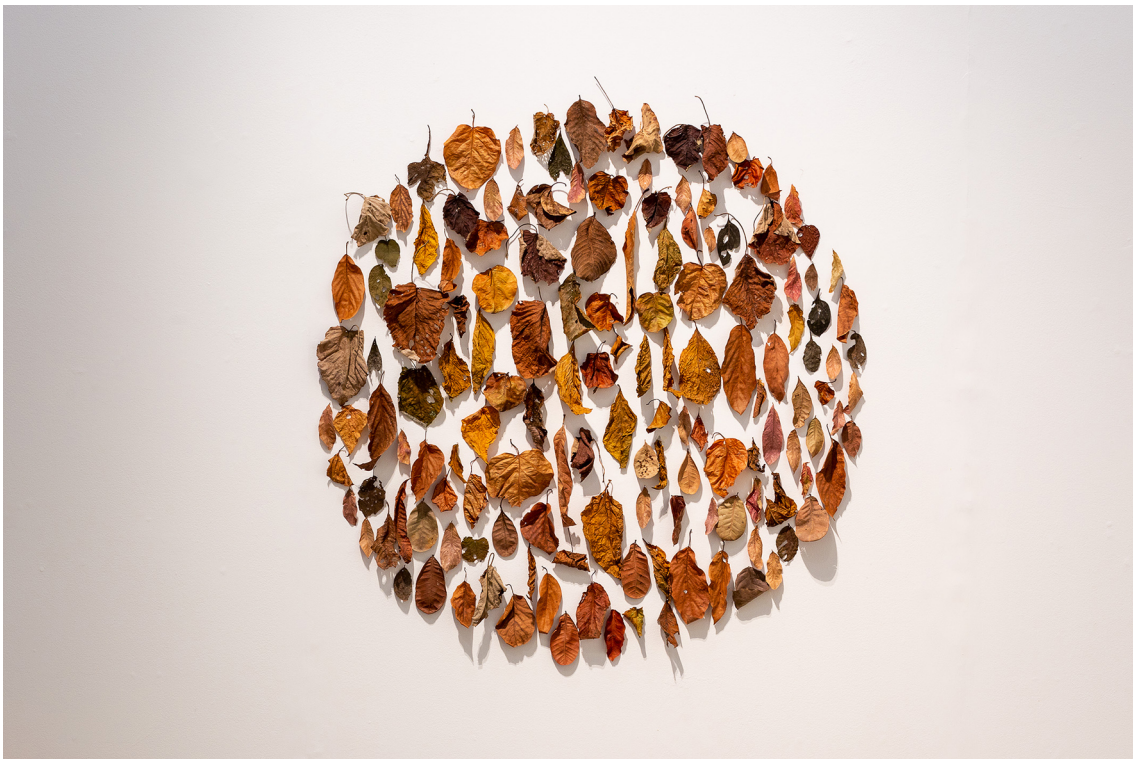
Glayson Arcanjo Quando a folha cai , 2021 Folhas coletadas 132 cm diâmetro