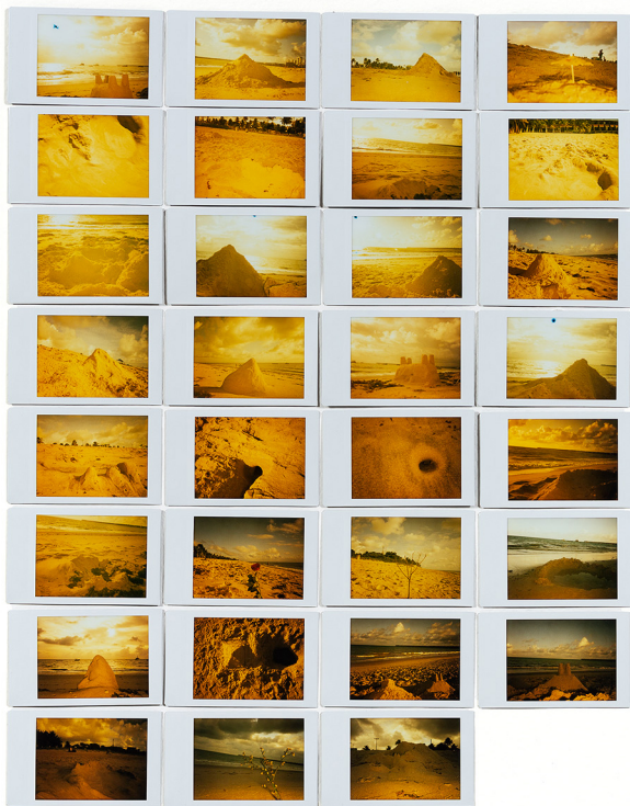
Odinaldo Costa Topografia de mim , 2021 Fotografia instantânea 35 cm x 45 cm