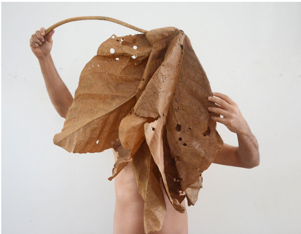
Glayson Arcanjo Chichá , 2022 Impressão fotográfica 90 cm x 120 cm