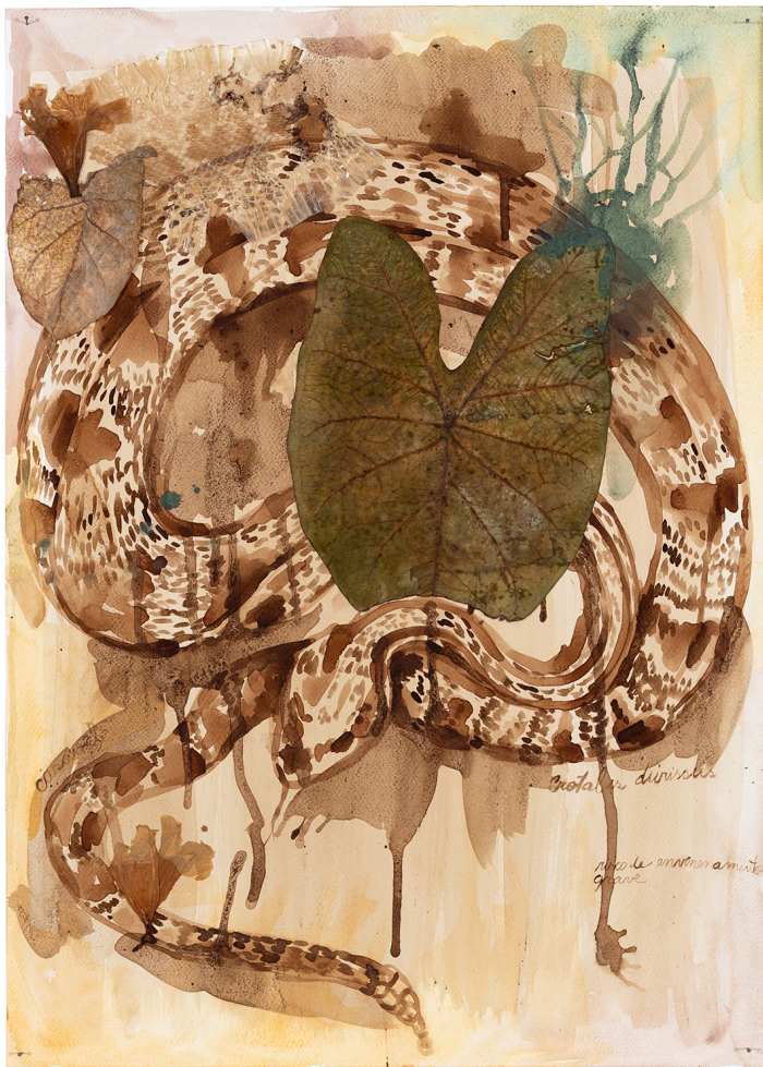
Adriana Mendonça Uma cobra de cimento serpenteando lembranças terrosas e floridas , 2021 Desenhos com pigmentos naturais sobre papel . 1,60 m x 8,30 m Detalhe do trabalho