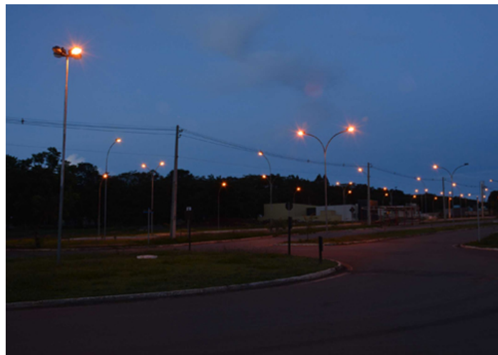
Rubens Pileggi. Paisagem(s) em concerto , 2021. Fotograma de Vídeo.

Estas experiências e observação atenta sobre seu entorno leva o artista a realizar Marcos 13:13-24 , uma instalação visual e sonora. Através de sete lâmpadas com seus respectivos braços de postes, situadas em três paredes do espaço expositivo, o artista literalmente introduz a rua na galeria. Mediante um sensor de presença, a instalação se ativa quando o espectador se situa no espaço, fazendo com que as lâmpadas se acendam, mas com sua característica própria, falha, piscando numa dança visual qual curto-circuito. Emulando o barulho dos reatores, um dispositivo sonoro acompanha essa luminosidade fugidia. Com esta ação, e com título tão promissor, as leituras da obra são múltiplas, entretanto, uma delas nos apresenta de forma instigante: no meio do nada, entre a luz e a escuridão, entre os lampejos titubeantes do mundo, entre erros e acertos, coletivos e individuais, devemos persistir na caminhada.