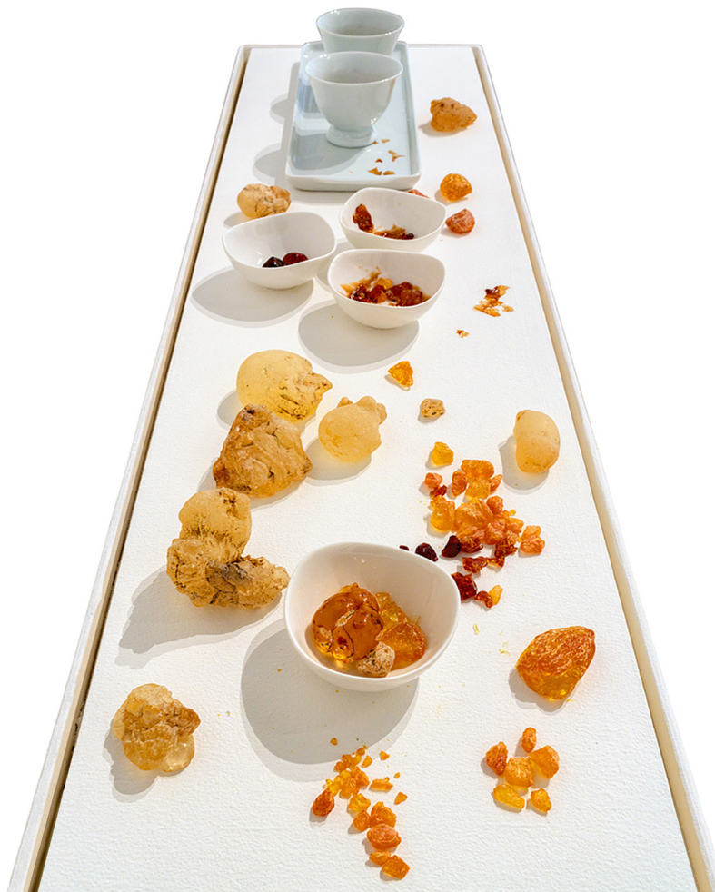
Maria Tereza Gomes 1 x ao dia, 2 x ao dia, 3 x ao dia, 2022 Louça branca, água, resina de árvores (angico, jatobá) 32 cm x 110 cm Detalhe do trabalho