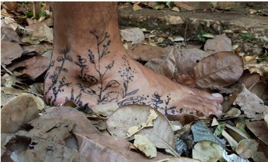
Glaysen Arcanjo Planta-pé , 2021 Fotograma da Vídeo-performance Link do vídeo: https://www.youtube.com/watch?v=t23x5ALJF1g