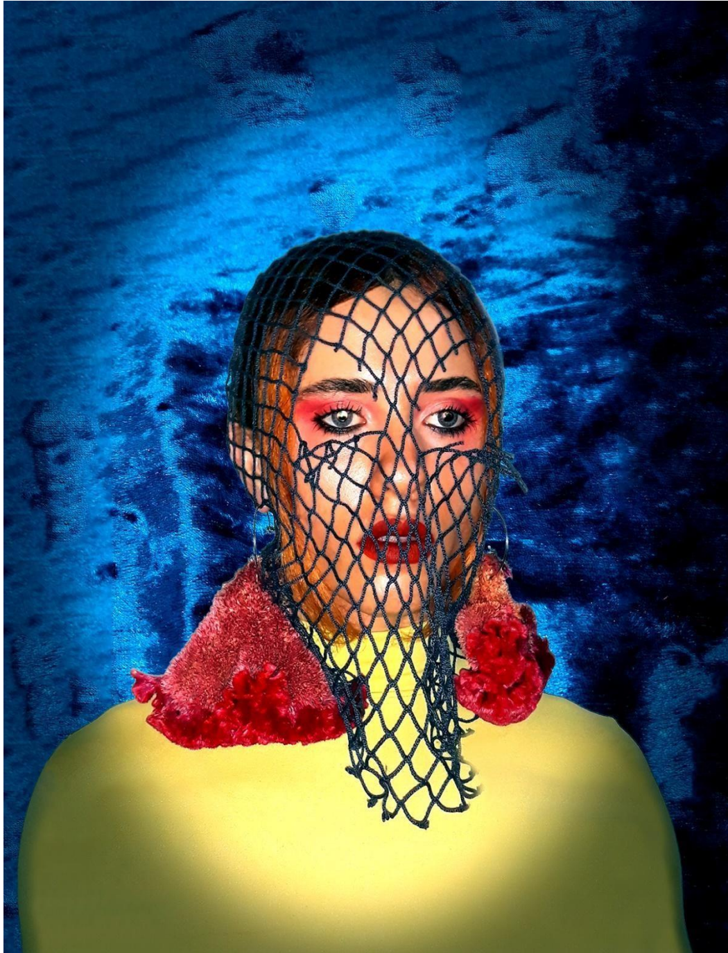
Figura 2 Céu Barbosa, Pesca Proibida, 2021. Fotografia e Colagem Digital