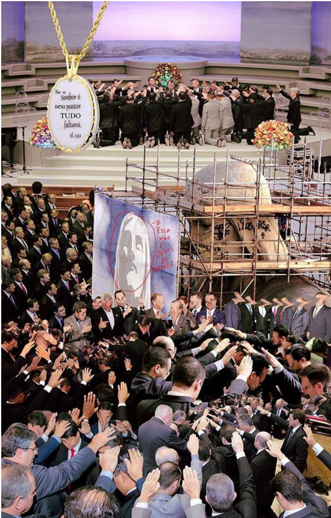
Figura 1. Ventura Profana, sem título, 2021. Colagem Digital