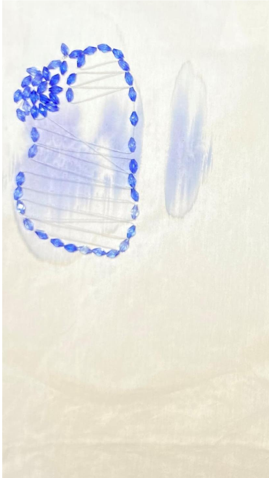
Figura 4. Amuleto da Circulação, Céu Barbosa, 2021. Bordado

Acervo pessoal Que a partir de agora eu tenha a movimentação e molejos da circulação invisível, que eu passe despercebida por aquilo que me marca socialmente em campos de batalha.