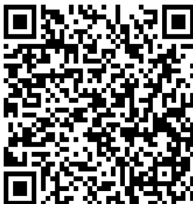
Figura 2- QR CODE - Periódico CAPES