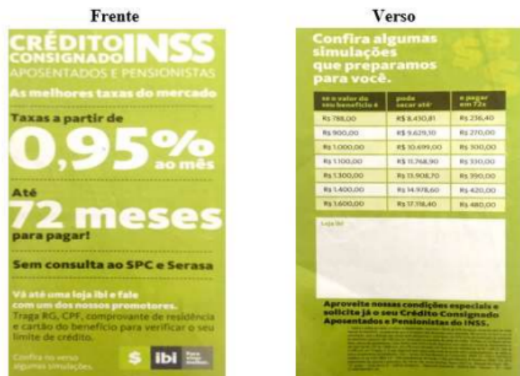
Figura 4 - Atividade com panfleto de banco.