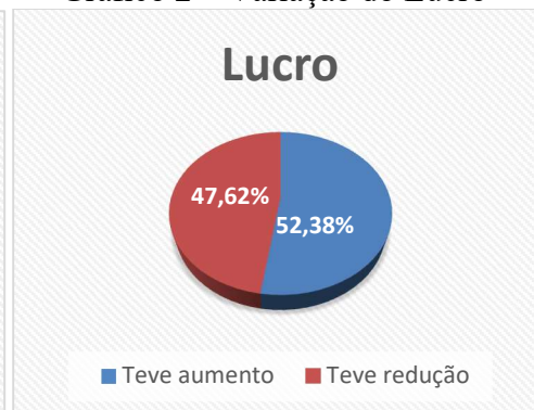
Gráfico 2 – Variação do Lucro