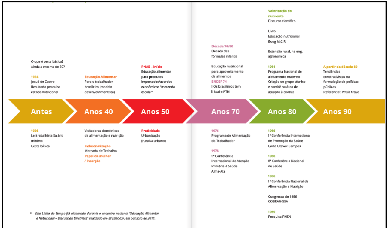
FIGURA 1 – Linha do tempo da EAN