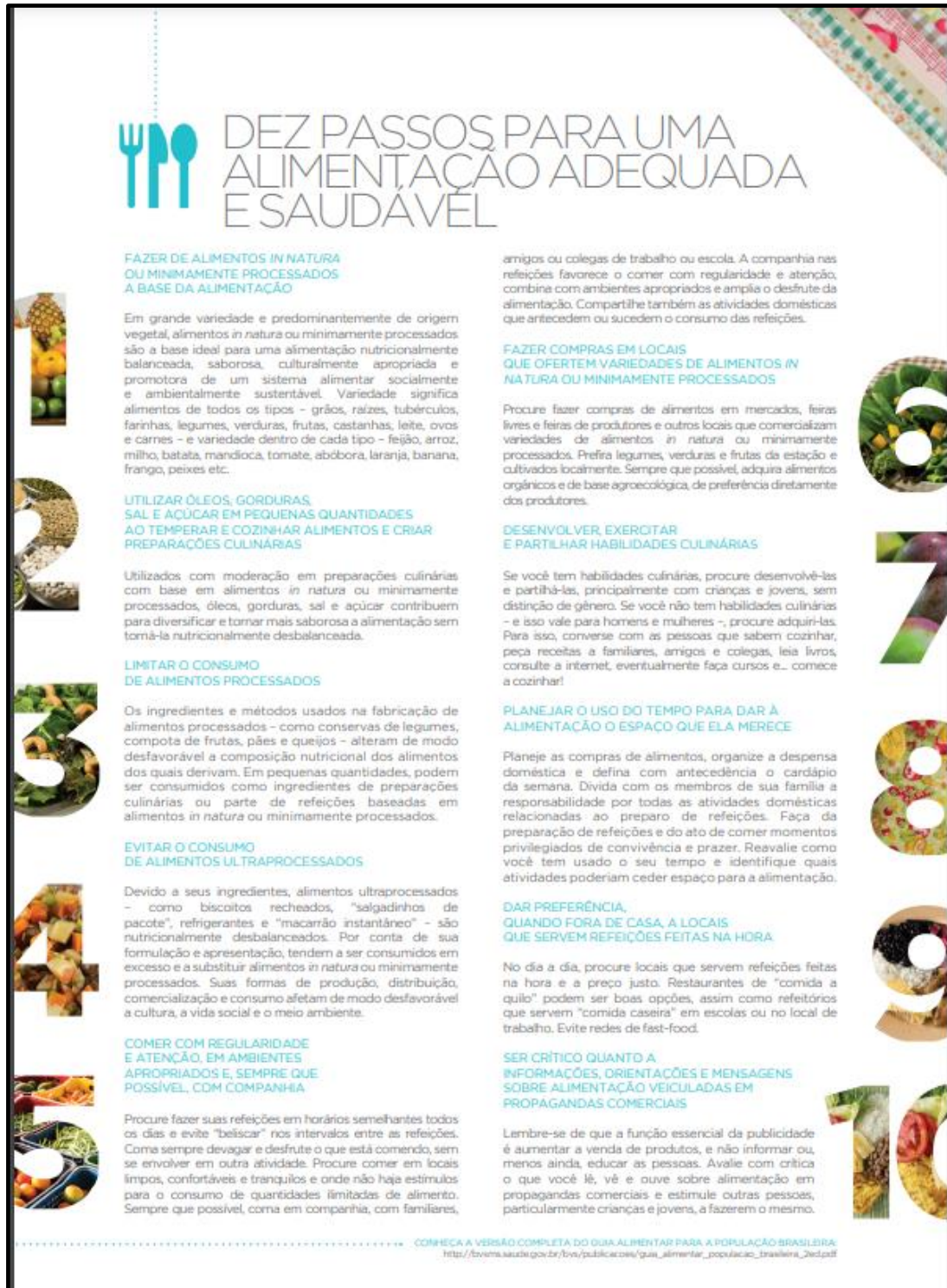
FIGURA 3 - Dez passos para uma alimentação saudável e adequada