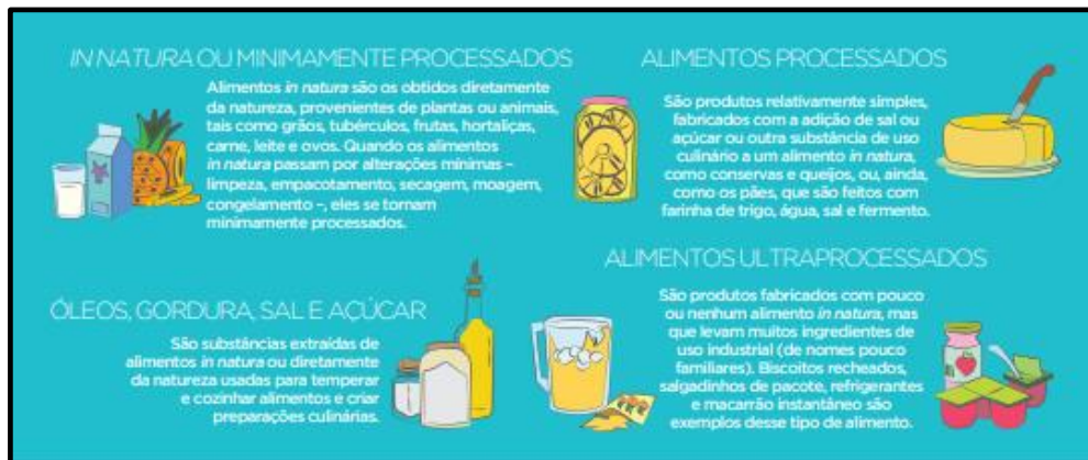
FIGURA 4 – Definições dos tipos de alimentos