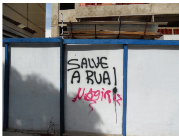
Figura 5. Pedido de socorro para a rua.

Na dispersão das vozes que se comunicam anonimamente, há alguns que se preocupam com a imagem que as ruas enunciam. Há pichadores que divulgam a ideia de que é preciso “salvar a rua” (Figura 5), como se houvesse um perigo iminente ao qual se deve atentar. Seriam os discursos em contraposição? Essa pequena voz num tapume comunica-se com outras em relação aos problemas urbanos.