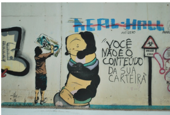
Figura 3. Pichação expõe resistência.

A resistência assume uma perspectiva diferente. Se, inicialmente, observávamos uma resistência política contra a ditadura, depois a apologia das drogas e a demarcação do território, vemos agora surgir uma autoria que não só se objetivou como um sujeito social, mas também subjetivou-se ao assumir o papel de ser uma voz de alerta contra as injustiças sociais. Cada vez que se inscrevem textos nos muros é uma voz que dispara uma reação contra uma sociedade voltada para interesses econômicos e produtivos sem considerar a humanidade de cada ser.