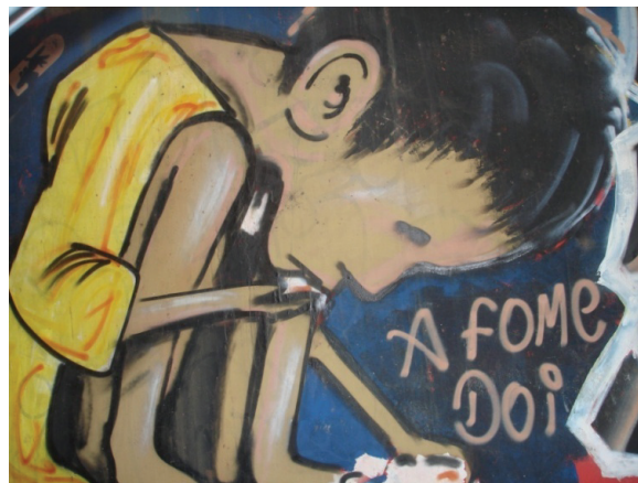
Figura 4. Pichação e Grafite sobre a fome.

resistência pichadora são também um esforço de ação sobre a ação alheia, portanto são gestos de tensão que caracterizam o poder conforme Foucault.