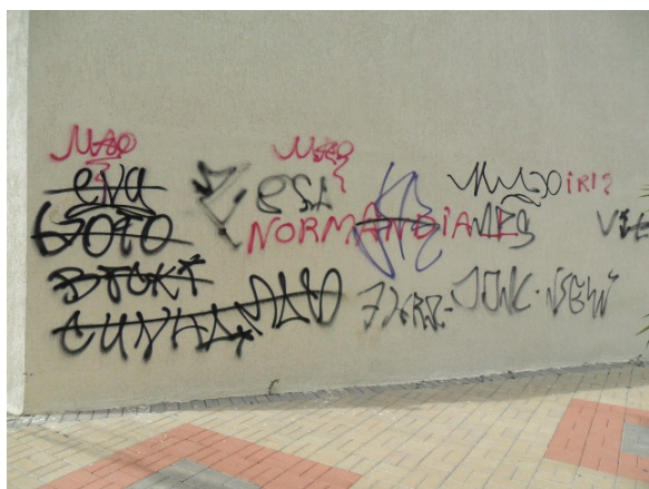
Figura 1. Pichações invasoras.

A partir dos anos 80 do século XX, com o retorno do processo democrático, as pichações começam a se diversificar e agregam outros objetivos. Os grupos querem ocupar os espaços, cada um quer mostrar-se como um sujeito dotado de voz, mas mantém-se no anonimato. Os dizeres passam a se apresentar de modo mais cifrado para que só os conhecedores possam decodificar as mensagens. O propósito passa a ser uma comunicação entre gangues para demarcar território, demonstrar perícia ao pichar em locais desafiadores ou, até mesmo, desafiar o controle urbano. Desenvolve-se uma fúria pichadora que não deixa escapar espaços onde se possa escrever: muros, portões, portas de lojas, prédios e até monumentos públicos. O discurso urbano diante disso é de perplexidade e revolta por visualizarem uma cidade “emporcalhada” (Figura 1).