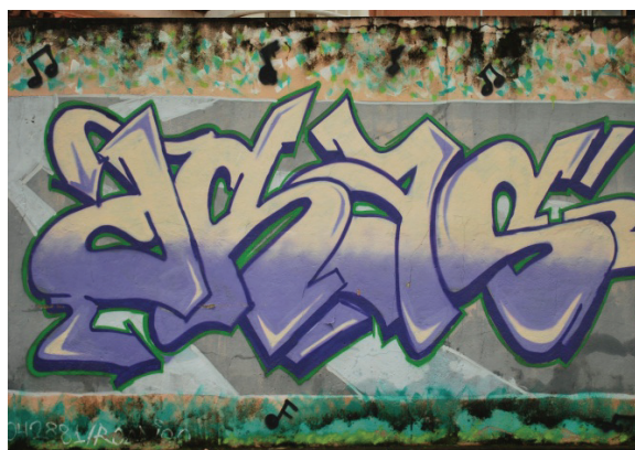
Figura 2. Pichações semelhantes a Grafites.

O aparecimento dos grafites não decreta o fim das pichações que continuam invadindo a paisagem urbana. Além disso, o uso da internet vem permitindo a visibilidade que muito se procurou por meio das pichações. Vemos que a intensidade pichadora diminuiu, mas não desapareceu. As mensagens cifradas ainda sobrevivem com menor intensidade, mas estão à vista em quase todas as cidades do Brasil. Algumas vezes, os dizeres codificados envolvem-se em cores rebuscadas numa transição para o grafite (Figura 2).