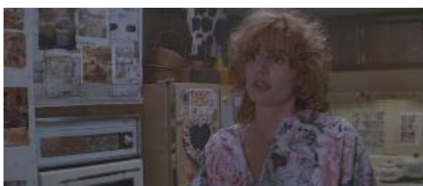
Ilustração 1 – a casa de Thelma.

No início do filme, quando o diretor começa a nos apresentar as personagens, percebemos certas diferenças entre as duas, principalmente por suas casas. A residência de Thelma, a primeira a ser apresentada, é cheia de informações, dando a impressão de estar desarrumada, apesar de estar tudo no lugar. Há vários papéis e imagens pregadas na geladeira e na parede da cozinha, objetos de decoração em quase todas as superfícies. Isso dá a casa, sempre escura, uma sensação de sufoco e clausura. Outro fator que ressalta a condição de bagunça é uma obra realizada no exterior da casa, que deixa o lado de fora cheio de madeiras e materiais de construção (Ilustrações 1 e 2).