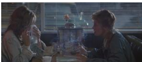
Ilustração 7 – Louise tem o controle da situação.

A partir de então, Louise, ao contrário de Thelma, passa a se preocupar cada vez menos com sua aparência, principalmente ao que diz respeito ao que é caracteristicamente feminino, como o uso de maquiagem. Na cena seguinte, ao se olhar no espelho, se irrita com sua maquiagem e tira o blush do rosto (Ilustração 8).