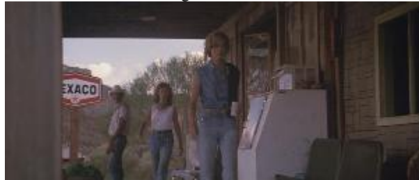
Ilustração 21 – o jeito de se vestir muda: agora elas usam jeans e camisas cavadas.