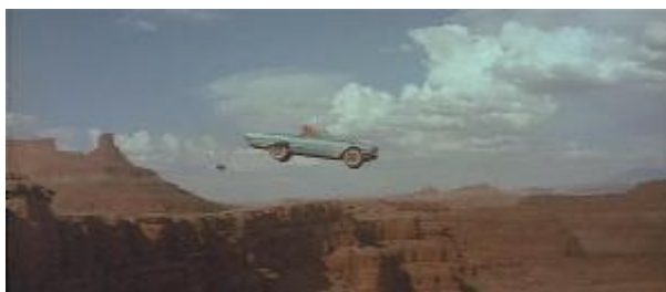
Ilustração 24 – cena final. A imagem congela, sensação de eternidade.

A cena congela com o carro no ar. Não se chega a ver as amigas caírem no precipício (Ilustração 24). Apesar de se saber que elas irão morrer, com o congelamento da cena com o carro ainda no ar a sensação que se tem não é a de desastre, mas sim de libertação, como se elas apenas seguissem em frente.