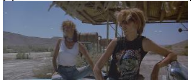
Ilustração 22 – a imagem torna-se mais agressiva.