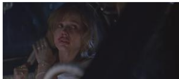
Ilustração 6 – mesmo em choque e com as marcas da agressão ela tenta manter sua feminilidade.

A feminilidade de Thelma, mantida pela tentativa de se arrumar, associada com a sua fragilidade e submissão à Louise, dá a ela características tradicionalmente femininas. A personagem de Sarandon, Louise, também está assustada, mas aparenta ter mais autocontrole e sempre assume as rédeas da situação (Ilustração 7).