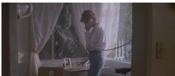
Ilustração 3 – a casa de Louise.

Já a casa de Louise é limpa, branca e clara. Vemos poucos objetos pela casa e as cortinas bem brancas deixam muita luz entrar no ambiente, o que contrasta com a pouca iluminação da casa de Thelma. Louise mora sozinha, tendo assim apenas um copo para lavar como louça suja (Ilustrações 3 e 4).