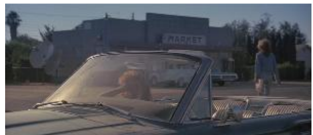
Ilustração 11 – ...e Thelma assume,

Não vemos mais aquela Thelma dona de casa, submissa, vítima das situações. Ela agora é decidida, controlada e deixa de ser deslumbrada e inocente quanto às pessoas e aos novos acontecimentos em sua vida. Para solucionar o problema da falta do dinheiro levado