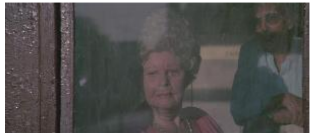
Ilustração 17 – outro personagem que observa.