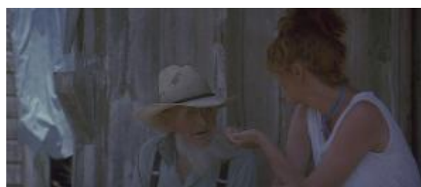
Figura 15 – ...e faz uma troca com o senhor que a observava

Podemos interpretar essa atitude como uma libertação e como negação total do mundo feminino e do que ele representa para Louise: repressão, dor e submissão. Ela então se sente livre para fazer o que quiser. A personagem se livrou do que restava de sua fragilidade feminina e, ao pegar o chapéu do velho, aceita o lado masculino em sua vida, pois o chapéu é um característico adereço do homem.