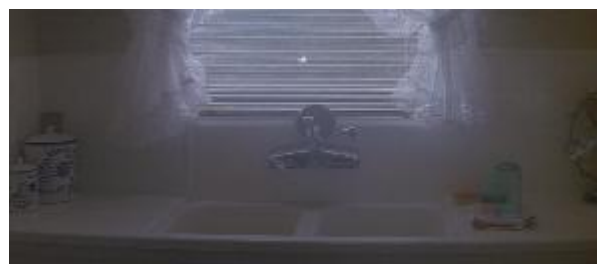
Ilustração 4 – a casa é organizada e Louise, sozinha, lava apenas um copo antes de sair.