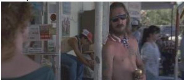
Ilustração 18 – mais outro.

Nessa fuga pela liberdade, as amigas, que no início usavam saias, vestidos, cabelos soltos e bem penteados; se mostram, a essa altura do filme, despreocupadas com isso. Já não se maquiam, os cabelos ficam presos e os vestidos deram lugar aos jeans e às camisas cavadas.