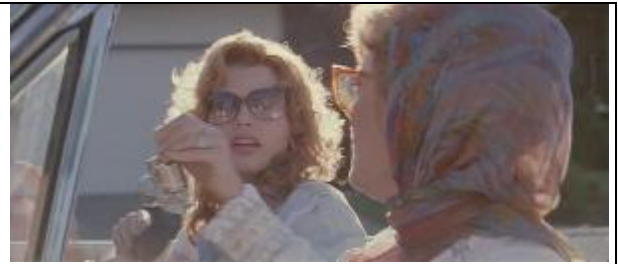
Ilustração 20 – as amigas tinham receio de até mesmo pegar em uma arma.