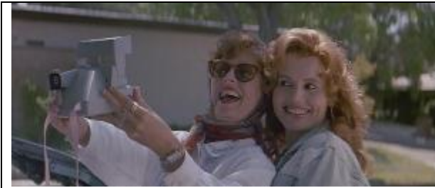
Ilustração 19 – no início da trama as personagens com os cabelos cuidadosos e figurinos femininos.