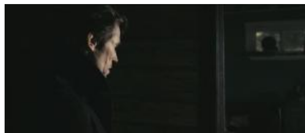
Ilustração 30 – Vê-se o personagem observando e a sequência continua com a câmera caminhando para nos mostrar o que Ele vê. Não há cortes.

Esse afastamento é visto, por exemplo, na cena da morte da criança. O acontecimento é chocante, triste, mas o que se repara é na beleza da cena. Apesar de estar vendo uma criança caindo pela janela, vê-se uma beleza naquilo tudo. É algo que parece impossível, mas o espectador é levado a observar a plástica do filme e não se entregar tanto ao sentimento em relação ao que se assiste nessa primeira cena. O diretor consegue mantê-lo afastado de sentimentalismos quanto ao que ocorreu. Vê-se o que aconteceu, mas não é chocante, não é brutal, ao contrário do restante do filme, que é chocante e brutal.