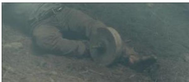
Ilustração 28 – o peso na perna que o impossibilita de ir para longe dela.

Seu medo de perda torna-se mais evidente no Éden quando, ao temer que o marido a deixe, perfura a perna dele com um enorme peso, impedindo-o de se locomover, como havia feito com Nic. Essa é uma tentativa de impossibilitar que ele se afaste dela (Ilustração 28).