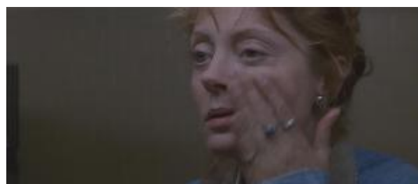
Ilustração 8 – remove o blush de seu rosto.

Essas pequenas situações, como a irritação com o blush ou a insistência de Thelma em se arrumar, se mostram relevantes para a construção do filme como um todo. Essas passagens indicam as transformações pelas quais as personagens vão passando no decorrer da trama.