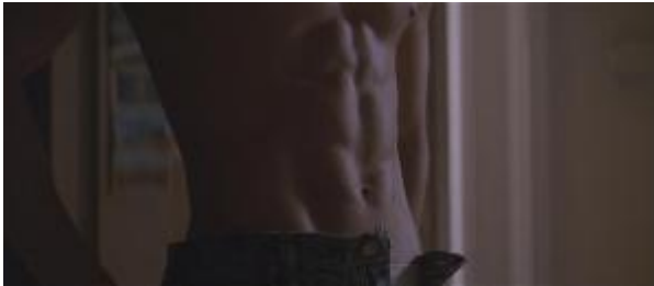
Ilustração 9 – a câmera contempla o corpo de J.D., erotizando-o

O corpo de Thelma, ao contrário do que acontece com J.D., não é erotizado durante a cena. O corpo dele aparece descoberto, nu e não se chega a ver o de Thelma assim também. Durante todo o filme, o corpo das duas amigas não é erotizado, não é transformado em objeto do olhar do espectador, fetichizando-o. O único personagem com que é feito tal reprodução é J. D., erotizado na cena de sua relação com Thelma.