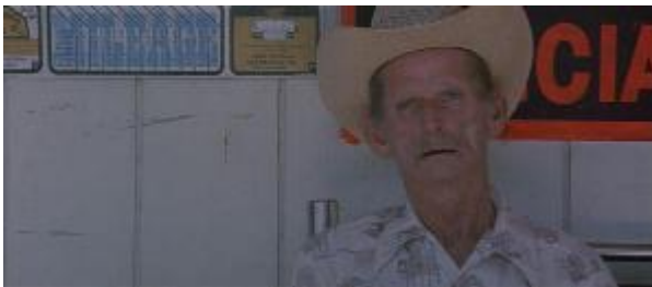
Ilustração 16 – um homem observa Louise.

Podemos interpretar esses olhares, essa vigilância, como o olhar patriarcal dessa sociedade em relação às amigas. Julgando-as, reprimindo-as apenas com o olhar, assim como o inconsciente patriarcal reprime o feminino, por vezes sem se manifestar claramente. O patriarcalismo está no inconsciente da sociedade, permeia por ela e é revelado em pequenas atitudes, como nesse olhar repressor (Ilustrações 16, 17 e 18).