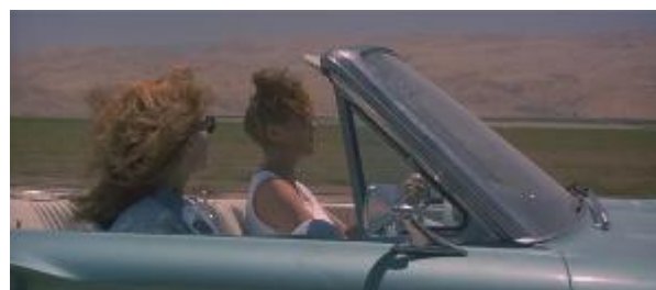
Figura 13 – após o assalto essa sensação permanece, a amigas se sentem livres.

Na parada seguinte, assiste-se à cena em que Louise se livra totalmente de seus adereços e de sua inocência feminina. A garçonete tira todos os seus anéis, os brincos e o relógio e faz uma troca com um senhor que a observava, deixando todos os seus acessórios e levando o chapéu do velho. Antes ela já havia jogado outro símbolo do mundo feminino fora: o seu batom (Ilustrações 14 e 15).