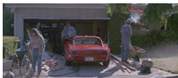
Ilustração 2 – o exterior da casa.

Já a casa de Louise é limpa, branca e clara. Vemos poucos objetos pela casa e as cortinas bem brancas deixam muita luz entrar no ambiente, o que contrasta com a pouca iluminação da casa de Thelma. Louise mora sozinha, tendo assim apenas um copo para lavar como louça suja (Ilustrações 3 e 4).