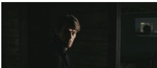
Ilustração 29 – a câmera está próxima ao personagem e vai se afastando bastante, revelando a posição de observador do espectador.

Observam-se as reações dos personagens, mas não se partilha delas. Não se tem acesso total aos sentimentos deles, o espectador ocupa uma posição por vezes incômoda por se observar toda a dor dos personagens e sentir essa mesma dor, mas não pela identificação com eles, mas sim por meio das cenas violentas que o diretor produz.