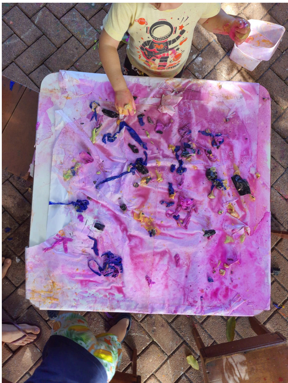
Figura 2 - Resultado visual da proposta “Explorando Texturas”