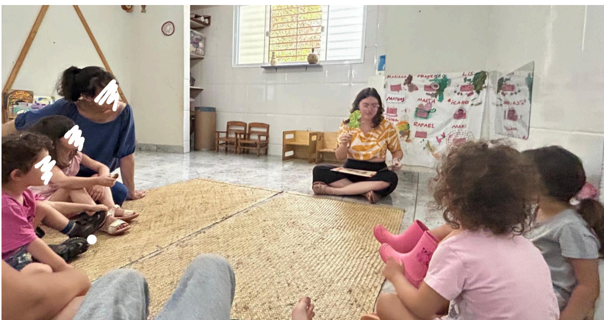
Figura 3 - Contando a história