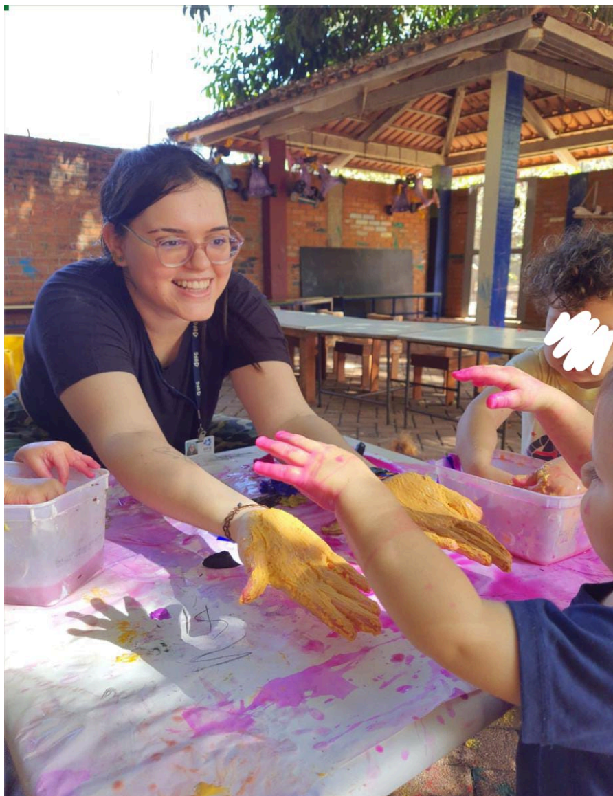
Figura 1 - A proposta “Explorando Texturas”

vivenciam experiências fundamentais para a construção futura de sentidos e expressões.