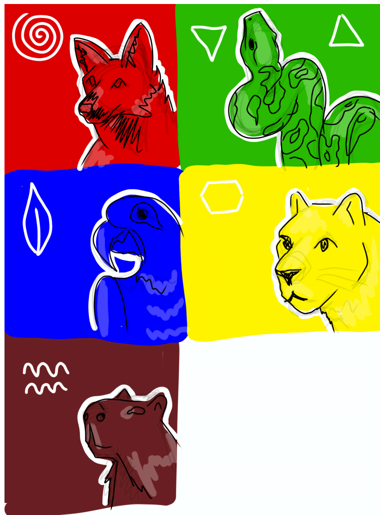
Figura 6 - Esboço da ideia

O processo criativo do livro começou pela escolha das cores, elemento central para atrair a atenção das crianças de 0 a 2 anos e estimular sua percepção visual. A partir delas, selecionei animais do Cerrado que possuem características marcantes nessas tonalidades, garantindo uma relação direta entre estética e conteúdo educativo. Em seguida, realizei esboços de como imaginei a composição de cada página, e busquei referências fotográficas dos animais escolhidos para orientar o desenho. Esse planejamento inicial contribuiu para alinhar intenção pedagógica e expressão artística, permitindo que cada imagem fosse pensada tanto para o aprendizado quanto para o encantamento das crianças.