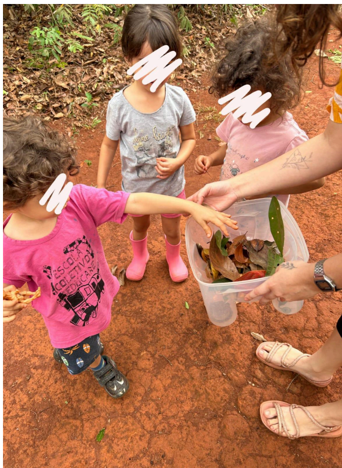
Figura 04 - Pegando folhas