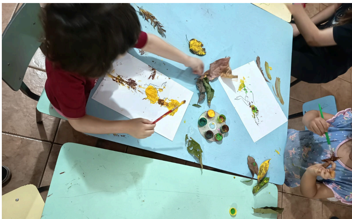
Figura 5 - Realização da prática