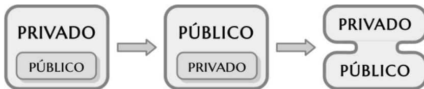
FIGURA 1 - DIALÉTICA PÚBLICO-PRIVADA NO TRATAMENTO FORMAL DO ESPAÇO NA NARRATIVA

Isso posto, podemos notar que o cinismo do capitalista, e sua atitude de considerar desde o início o acidente (fatal para o feirante) como uma simples chateação – “Era chato ter que enfrentar esse tipo de coisa num sábado, com a secretária a tiracolo e, o que era pior, ter topado com uma Kombi. Os amigos iam rir.” (LUCAS, 1987, p. 42) –, aparece como índice de que para o industrial o caráter privado do público está implicitamente dado. Enfim, podemos esquematizar esse arranjo da seguinte maneira: