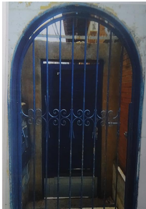
Figura 17 - Fotografia dos portões com símbolos adinkras.