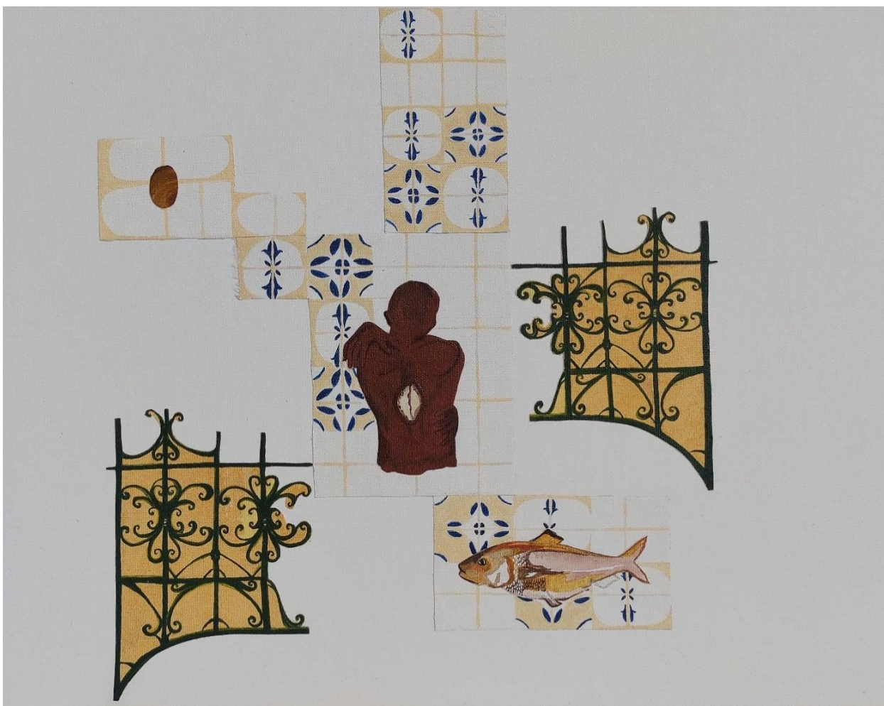
Figura 12 - Jeise Kelli. Além das águas, 2023. Acrílica e colagem sobre tela. Dimensão 50x40cm.