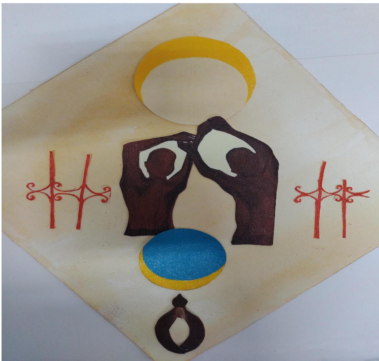
Figura 13 - Jeise Kelli. Mãe de ouro, 2023. Acrílica e colagem sobre tela. Dimensão: 35x30. Fonte: Acervo pessoal.