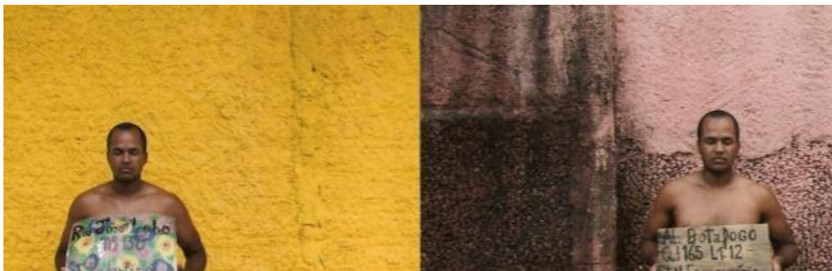
Figura 3 - Dalton Paula. Corpo Território B / 2010 / Fotografia / 20 x 60 cm / Foto: François Calil. Fonte: https://daltonpaula.blogspot.com/2012/06/corpo-silenciado.html?m=1

O artista desenvolve fotografias que me possibilitam compreender as inquietações e os silenciamentos que me atravessam nas Paisagens internas, nesse estar em territórios que me interrogam e de onde emergem as narrativas.