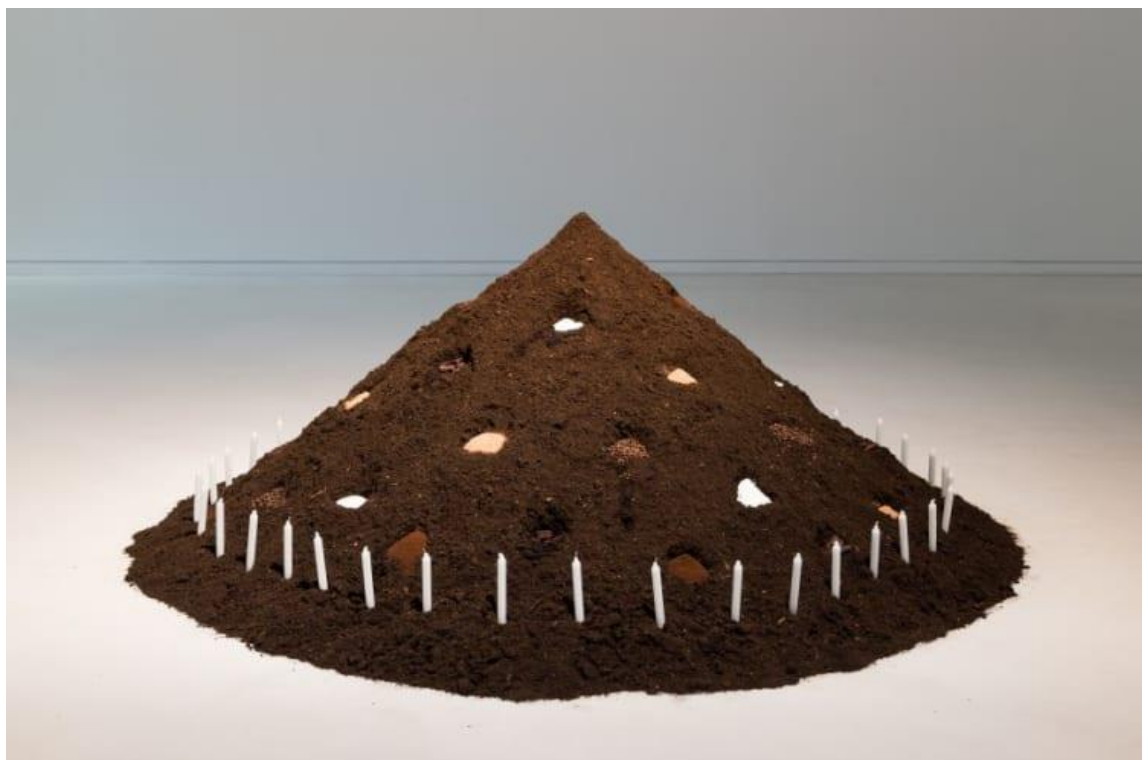
Figura 9 - Grada Kilomba. Table of Goods , 2017. Instalação, dimensões variadas.

Ainda conforme salientado, a artista discorre na análise psicanalítica do trauma que é aplicada à experiência do racismo cotidiano, destacando três elementos implícitos: o choque violento, a separação ou fragmentação e a atemporalidade. Cada episódio de racismo cotidiano revela um choque intenso, manifestando-se em eventos que colocam o sujeito negro como “outro” de maneira irracional. A aplicação das ideias de choque violento, separação e atemporalidade oferece uma estrutura analítica para compreender as complexidades, contribuindo para a compreensão mais ampla das Paisagens negras que proponho na minha prática artística e sua relação com perspectivas não ocidentais de ser-negro-no-mundo.