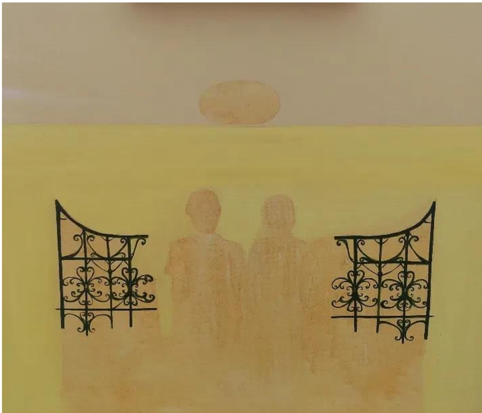
Figura 15 - Jeise Kelli Processo de recorte da pintura Além das águas, 2023.