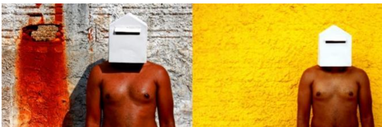
Figura 4 - Dalton Paula. Corpo Receptivo A / 2010 / Fotografia / 30 x 90 cm / Foto: Mário Souza / Edição: Heloá Fernandes. Fonte: https://daltonpaula.blogspot.com/2012/06/corpo-silenciado.html?m=1