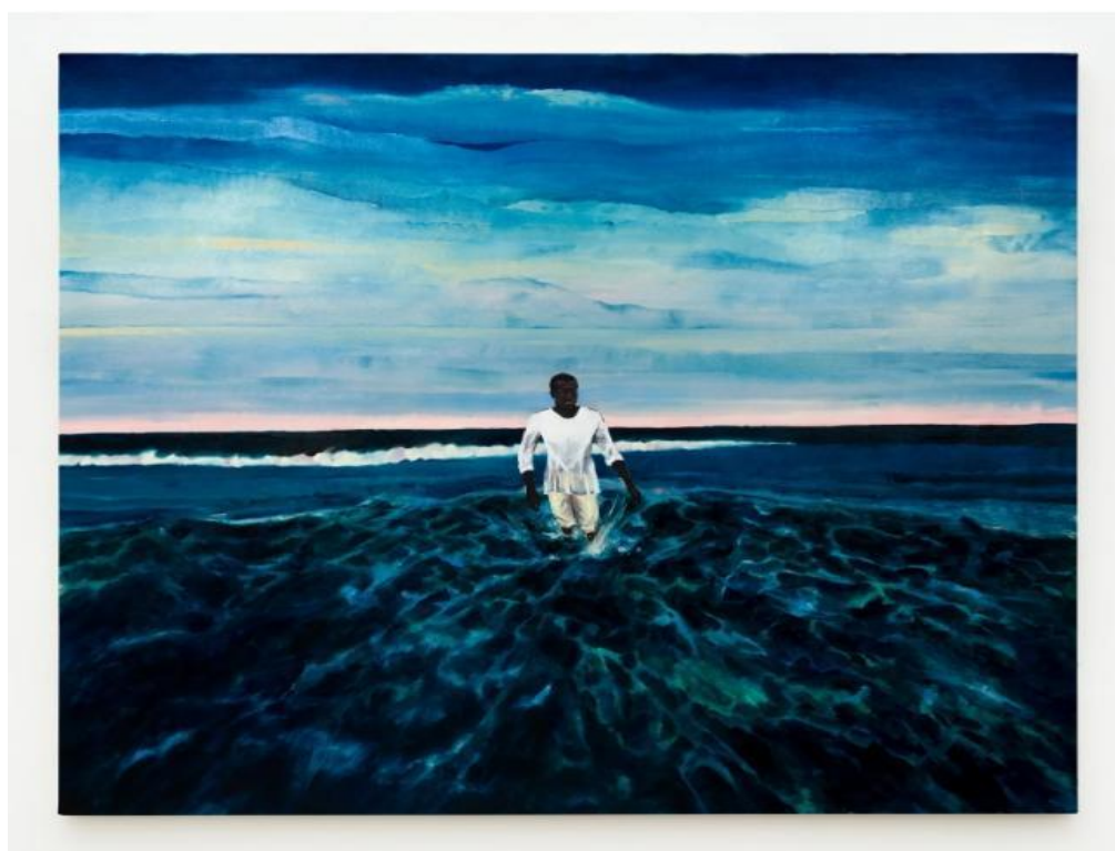
Figura 11 - Antonio Obá. Wade in the water II, 2020. Óleo sobre tela. Dimensões 70 7/8 x 79 1/8 e 180 x 201 cm.