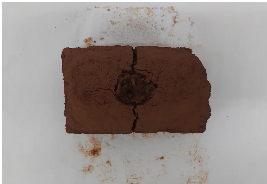
Figura 7 - Jeise Kelli. Cava - Vivências e memórias, 2020. Dimensões variáveis.