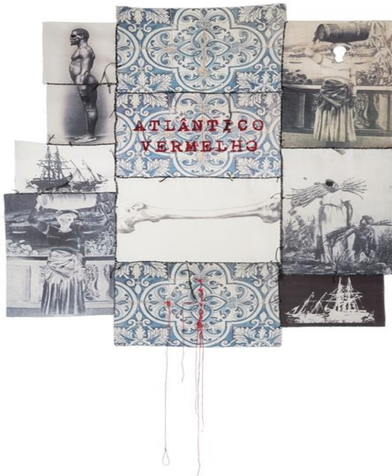
Figura 1 - Rosana Paulino. Atlântico Vermelho, 2017. Impressão digital sobre tecido, recorte e costura, 127,0 x 110,0 cm.

Seguindo nesse fio, o corpo ressoa para além de imagem-arquivo, questionando a construção da visibilidade dos negros, indígenas e a expropriação dos recursos naturais dos trópicos (Figuras 1 e 2).