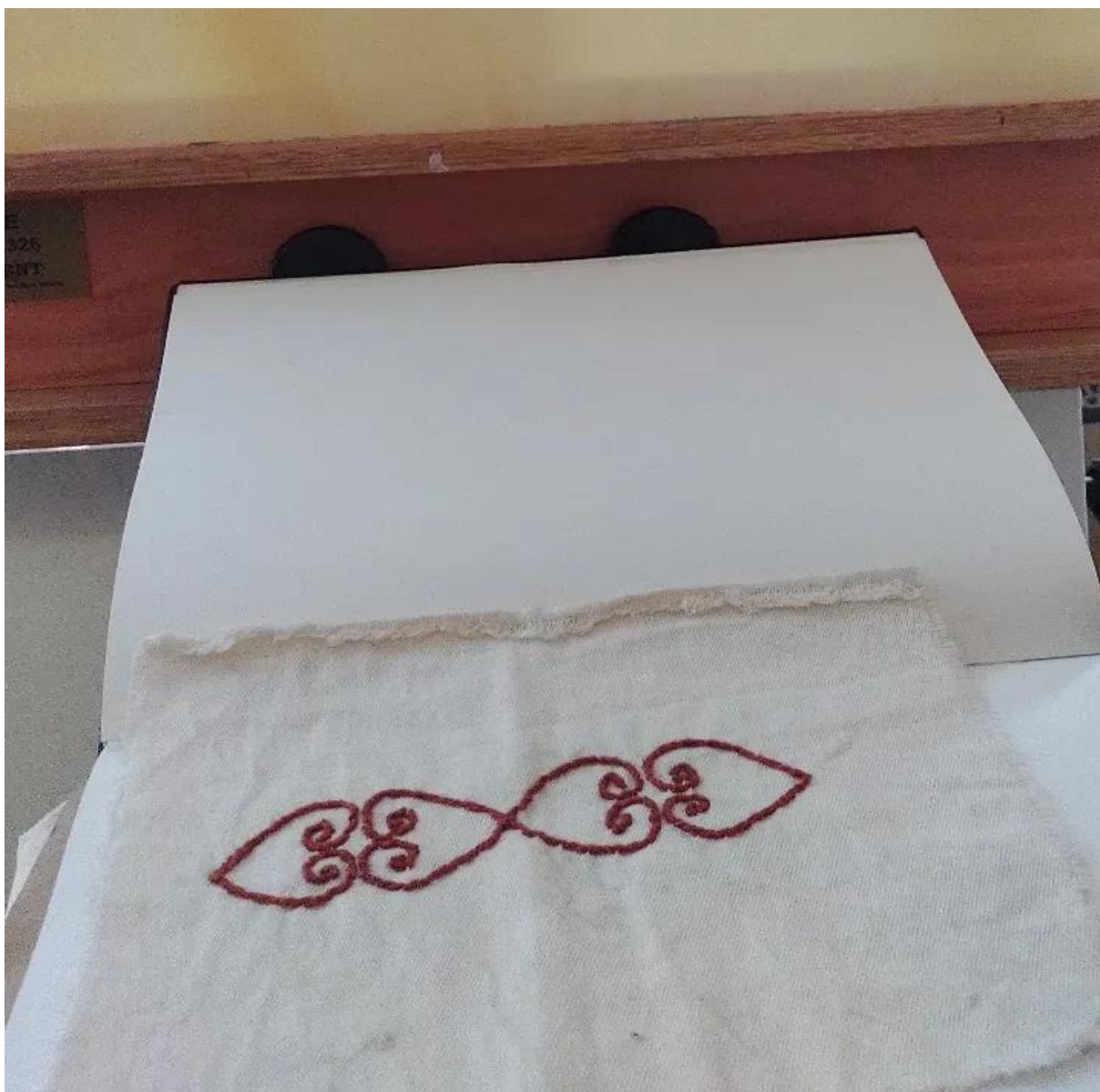
Figura 16 - Registro do bordado como estudo dos símbolos adinkras, 2023.