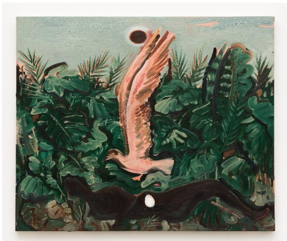
Figura 10 - Antonio Obá. Paisagem interior, 2018. Óleo sobre tela. Dimensões 34 ¼ x 33.