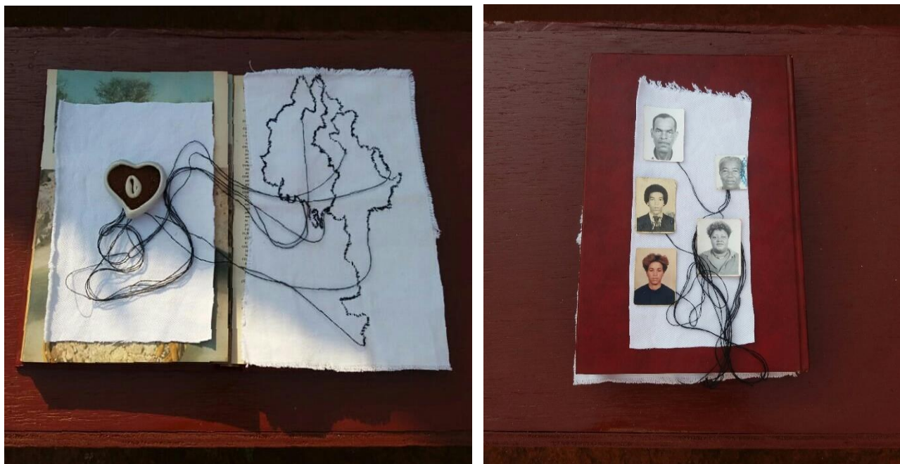
Figura 6 - Jeise Kelli. Terra, búzio, mapa linha: narrativas outras numa construção de origem e existência, 2020. Técnica mista – bordado e colagem de foto 3x4 sobre tecido. Dimensões variáveis.

As paisagens internas não são uma naturalização, em muitas terras e vistas panorâmicas os traumas ancestrais aterram nas paisagens. Na perspectiva de Grada Kilomba, em Memórias da plantação: episódios de racismo cotidiano (2019), o trauma colonial, como tema subjacente, é explorado no livro, utilizando a metáfora da “plantação” como símbolo de um passado traumático que persiste no presente através do racismo cotidiano. E com base nessa metáfora, faço o uso do enxadão para o ato de cavar tanto no sentido literal quanto no figurado, as raízes das reminiscências que ativam em mim como paisagens internas visuais e palpáveis (Figuras 7 e 8). O passado colonial nos elementos como a terra e o açúcar, as fotos de identidade de negros que passam por um processo de escassez de registros formam um mapeamento vivo em meios às ausências, onde cavar abre possibilidades de (re) existência (Figura 8). No poema Todas as manhãs , de Conceição Evaristo, o passado é revisitado no ato de lembrar para que não sejamos soterrados.