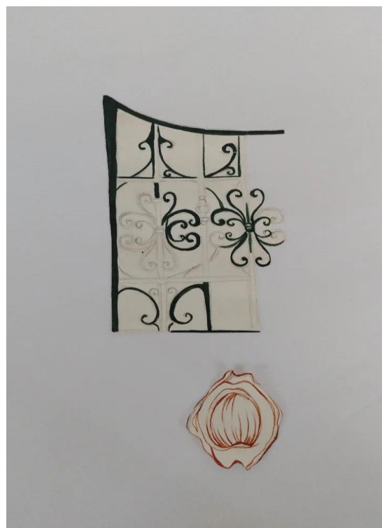
Figura 18 - Desenhos adinkras e búzios.