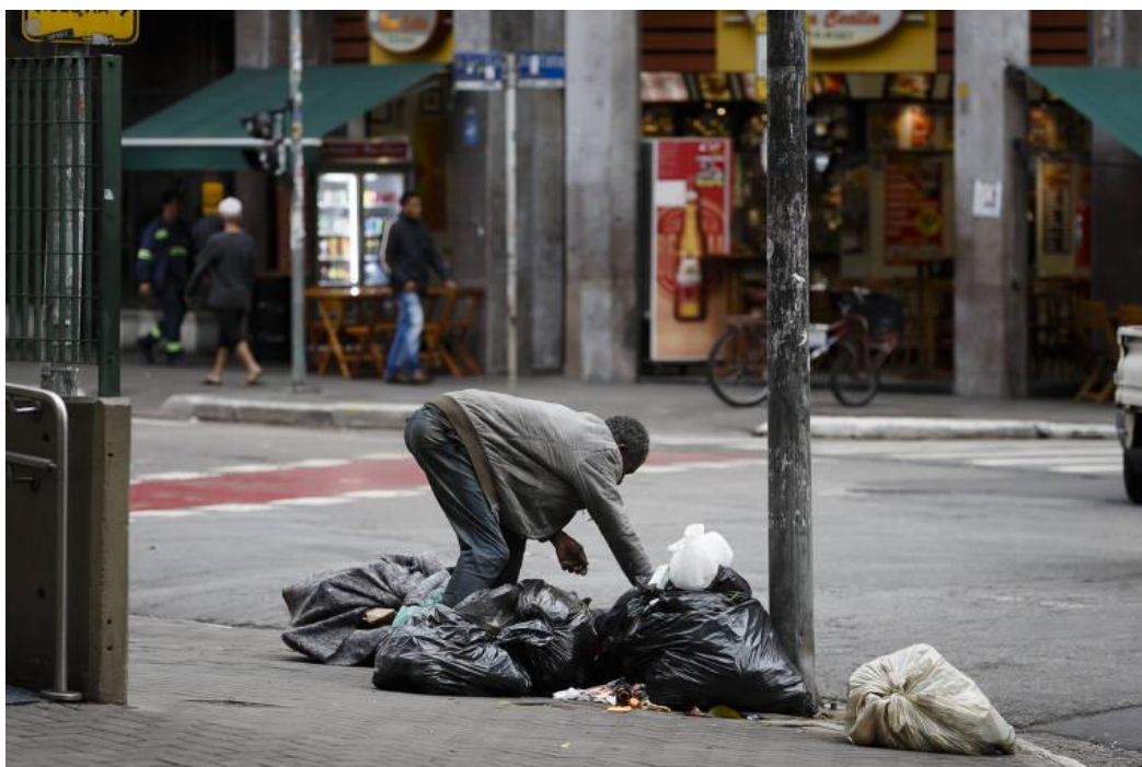
Figura 03: Pessoa em situação de rua revira sacos de lixo no largo Santa Cecília, região central de São Paulo