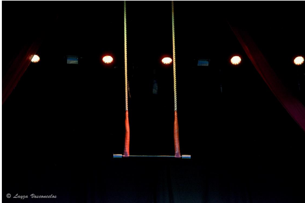
Figura 10 Trapézio (2017)