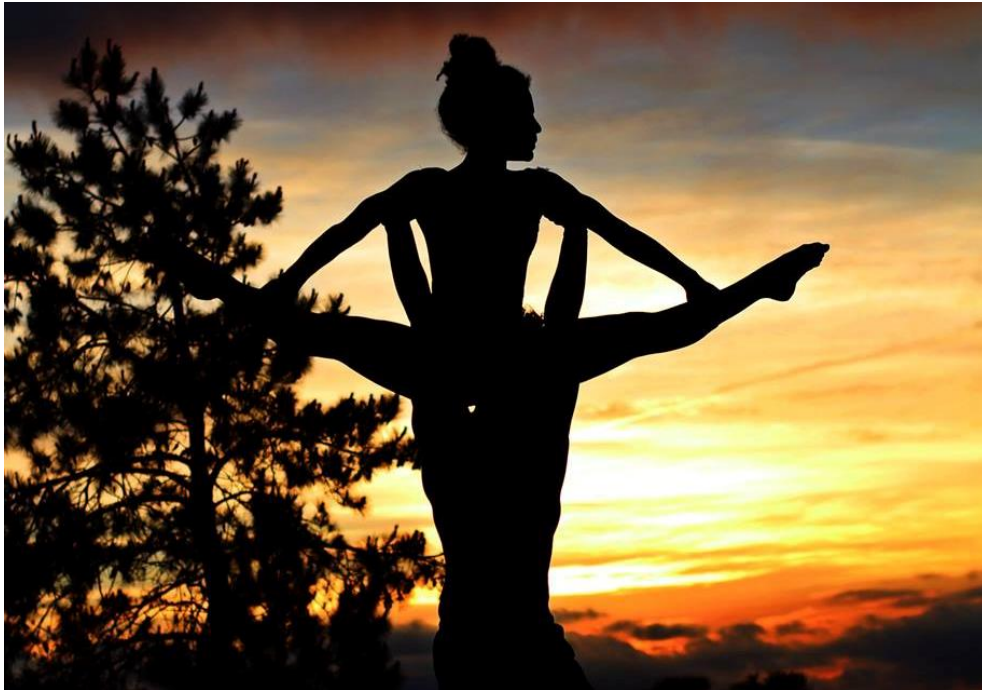
Figura 9 Improviso 3º Ateliê SP Cia de Dança (2018)