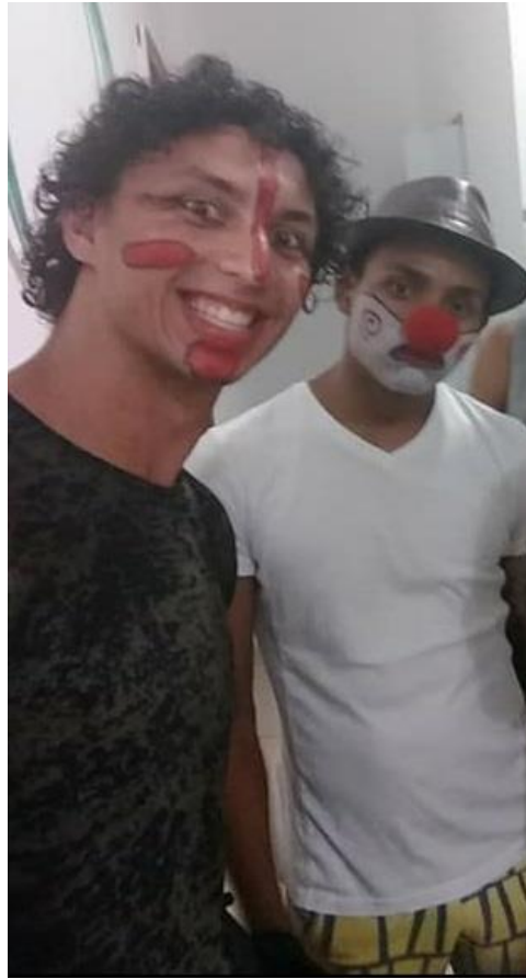
Figura 8 Apresentação Circo de Rua com Piauí (2018)