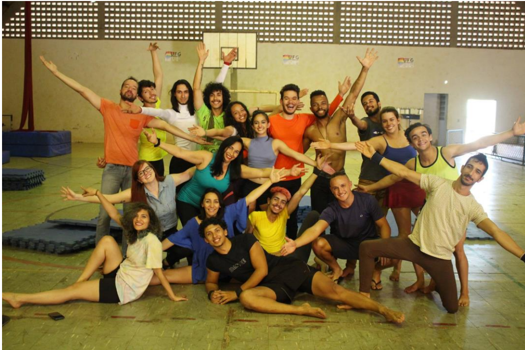
Figura 5 Projeto de extensão Circo e Dança UFG (2017)

desafio, cada conquista, cada sorriso e cada choro. Em sala de aula enquanto professor, fui um verdadeiro aluno de cada uma daquelas pessoas que dividiam cotidianamente experiências comigo, e me ensinavam não só sobre circo e dança, mas sobre a vida.