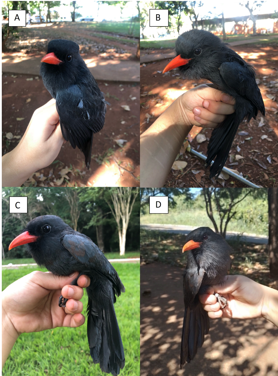
Fig. 2 Captura e anilhamento de quatro indivíduos de Monasa nigrifrons no campus Samambaia da UFG, Goiânia, Goiás, Brasil, pertencentes a três bandos distintos, sendo eles: duas aves do bando 1 (A e B), uma do bando 2 (C) e (D) uma ave do bando 3 (ver Figura 1; Tabela 1).

(*) Indica os valores com significância estatística; (+) indica os habitats que foram utilizados mais que o esperado ao acaso; (-) indica os habitats que foram evitados.