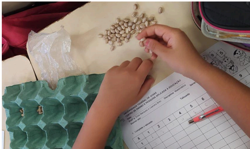
FOTOGRAFIA 3 - Cartelas e grãos usados pelos alunos

Nessa etapa, foram utilizadas cartelas de ovos e grãos (Fotografia 3) para ensinar a multiplicação como soma de parcelas iguais. Por exemplo, esse recurso pode auxiliar na operação “ 3 \times 2 ”, na qual o aluno colocaria 3 grãos em dois espaços da cartela e, em seguida, contaria todos os grãos, encontrando o total 6, ou o equivalente, 2 grãos em 3 espaços. Também utilizamos o dominó da multiplicação que, assim como o dominó convencional, requer a associação entre peças semelhantes; nesse caso, tratava-se de relacionar operações e seus respectivos resultados.