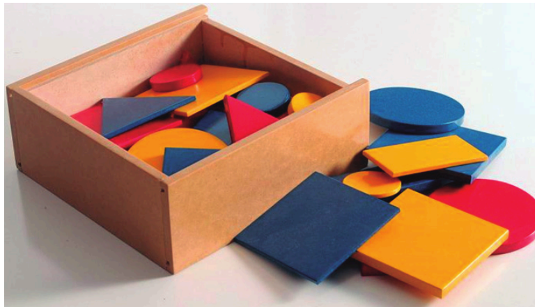
FIGURA 1 - Blocos Lógicos