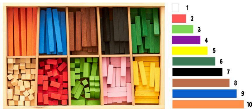
FIGURA 2 - Escala de Cuisenaire ou Números Coloridos