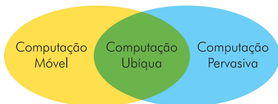
Figura 1. Relação entre a mobilidade e o pervasivo ao u-Learning .

Isso posto, denota-se que a u-Learning se beneficia tanto da mobilidade dos dispositivos móveis quanto da transparência da computação pervasiva. Conforme Figura 1.