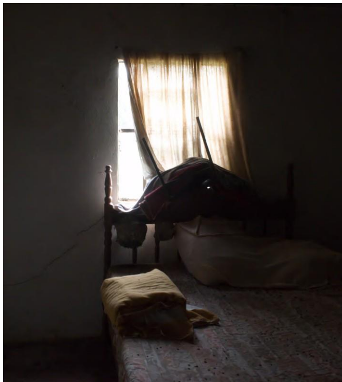
Figura 18 - Isabella Brito, Marimbondos (2021) Fotografia digital, 90x100cm. Prêmio Fomento à produção Anapolina no 26o Salão Anapolino de Arte, em 2022. Acervo Pessoal.

Em hóspede (2022) uma mala de viagem de mais de um século guarda em seu interior pedaços de cupinzeiros abandonados. Uma cápsula do tempo, oferece com generosidade a ruína e a degradação.