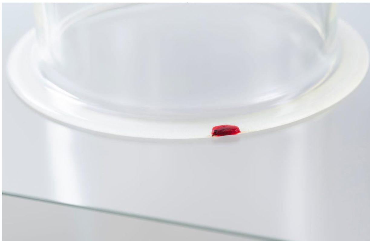
Figura 15 - Lucia Nogueira. Detalhe de Slip (1992). Redoma de vidro, cera vermelha, base em vidro semitransparente. Fotografia de Farzad Owrand para a galeria Luhring Augustine. Fonte: PÉREZ-BARREIRO (2021)

Em algumas obras de Lucia temos a sensação de que alguém (a artista) esteve há pouco tempo naquele lugar. Em Slip (1992) uma redoma de vidro com uma sutil intervenção: um pouco de cera vermelha preenche uma lasca faltante na base da peça, sugerindo o instante de um acidente, um corte. O título pode sugerir um escorregão ou talvez, a textura lisa tanto do sangue, quanto do vidro. Existe também a expressão em língua inglesa freudian slip que pode ser traduzida como "ato falho" - o ato de revelar acidentalmente algum pensamento vergonhoso ou não aceito socialmente.