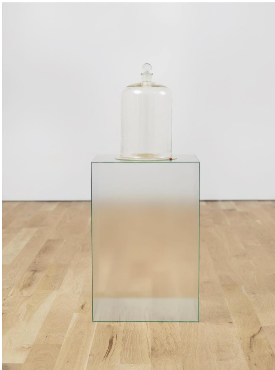
Figura 14 - Lucia Nogueira. Slip (1992). Redoma de vidro, cera vermelha, base em vidro semitransparente.