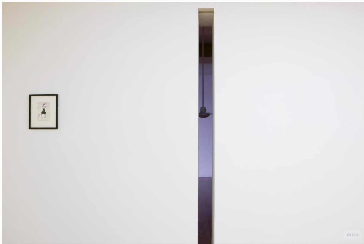
Figura 5 - Vista da exposição de Lucia Nogueira realizada no Museu de Arte Contemporânea de Serralves, Portugal, em 2007.

Essa aura misteriosa do trabalho é comentada por Duchamp no ensaio "O ato criador", onde o artista discorre a respeito deste mecanismo de significação através do conceito de "coeficiente artístico". A criação subjetiva de significados (produtos do consciente e do inconsciente do artista), escapa ao seu domínio, sendo completada pelo público.