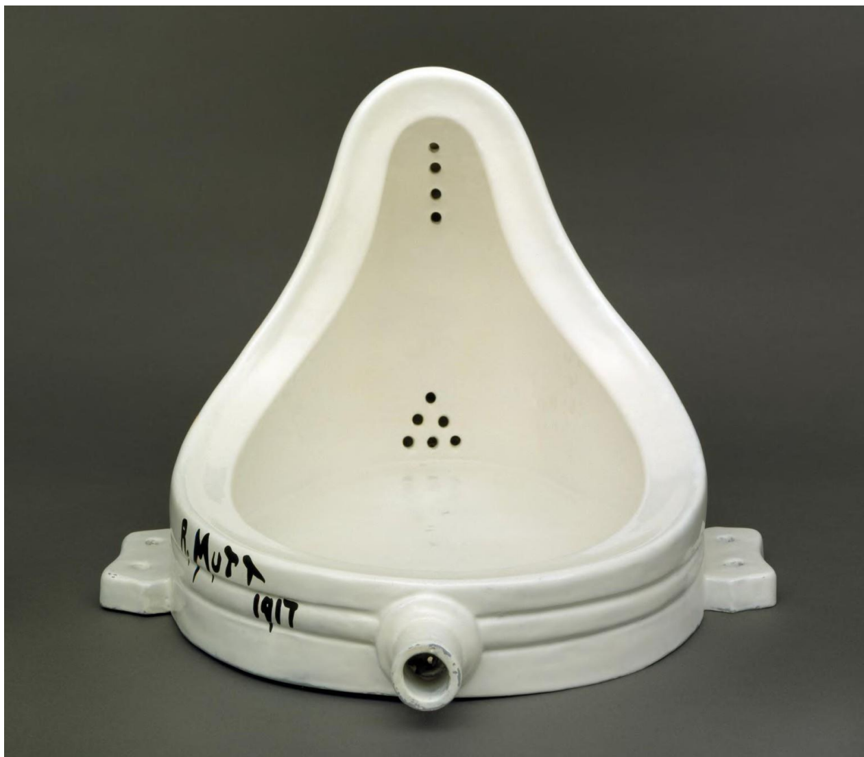
Figura 2 - Marcel Duchamp. Fonte (1917, réplica de 1964). Acervo do museu Tate Modern. ©

Succession Marcel Duchamp/ADAGP, Paris and DACS, London 2020.