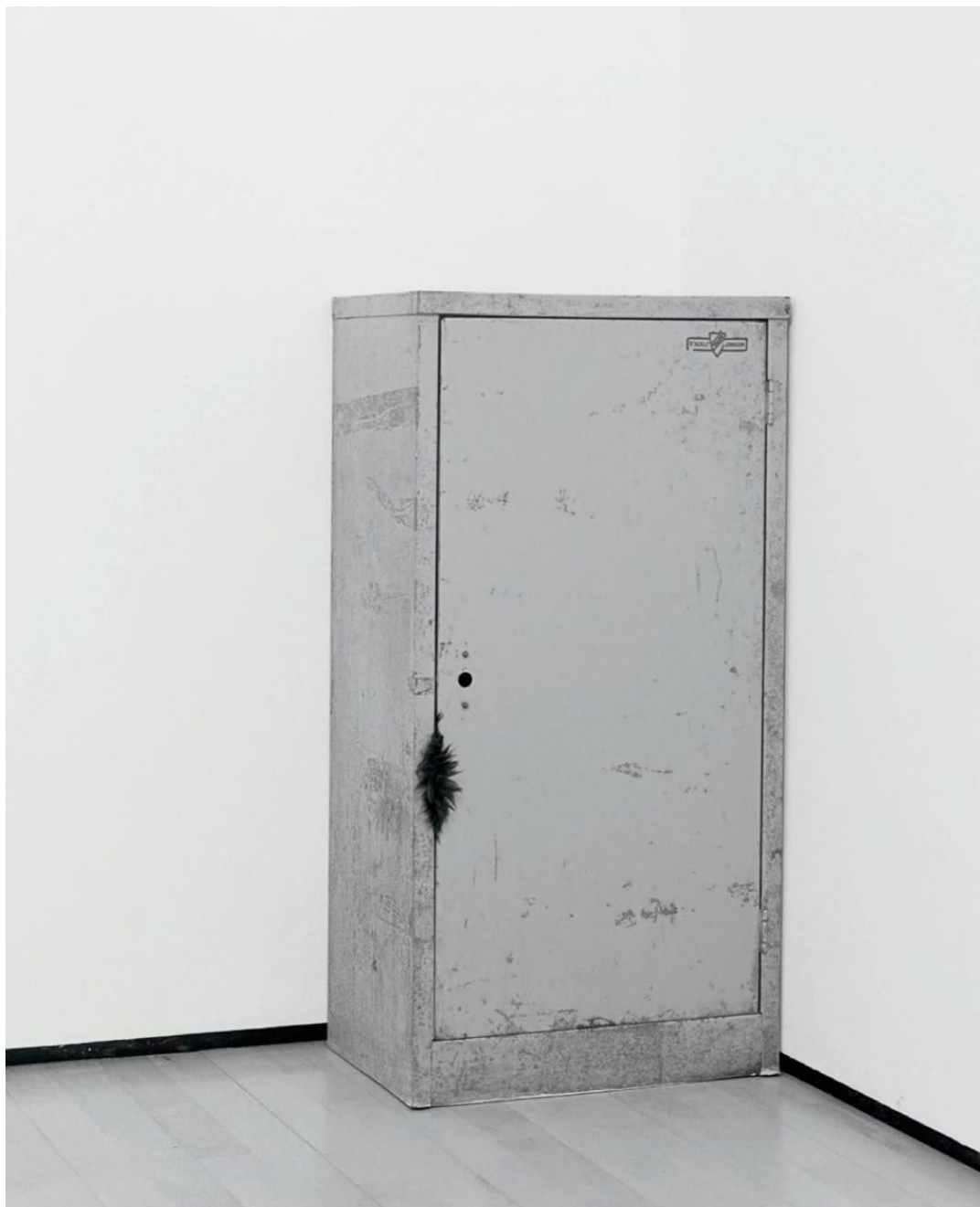
Figura 12 - Lucia Nogueira. Anchor (1992). Metal, pele artificial. 91 x 46 x 35cm. Coleção particular, Bélgica.