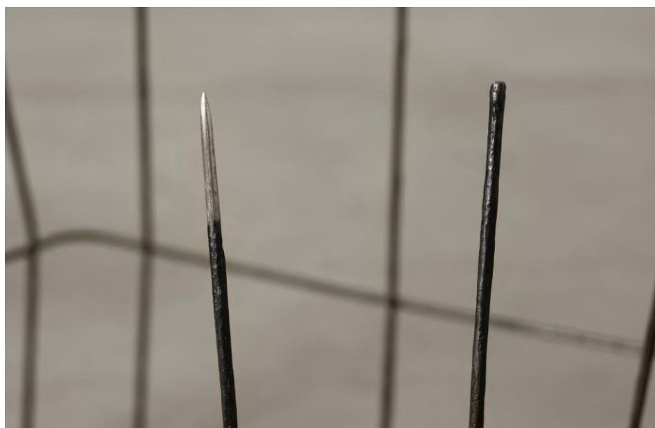
Figuras 07 e 08 - Lucia Nogueira. Untitled (1994). Cera preta, metal. 58 x 67 x 68 cm. Fotografia de Farzad Owrang para a galeria Luhring Augustine. Fonte: PÉREZ-BARREIRO (2021)