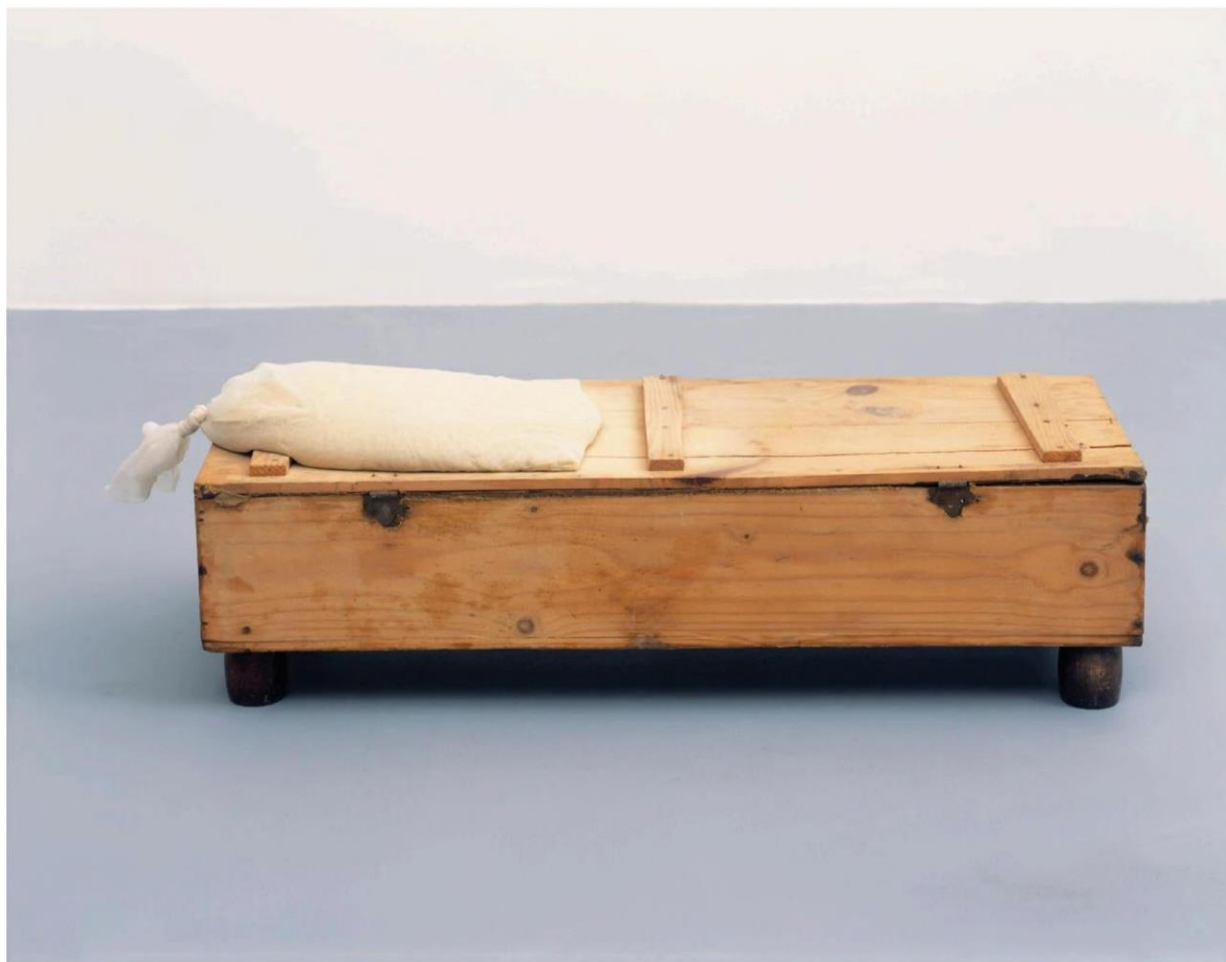
Figura 13 - Lucia Nogueira. Residue (1991). Caixa de madeira, areia e organza. 24 x 75 x 27 cm. Acervo de Anthony Reynolds.