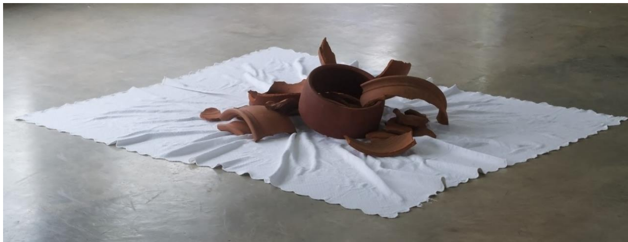
Figura 20 - Isabella Brito, hereditário (2022) Fragmentos de cerâmica sobre colcha de piquet. 224 x 185 x 40 cm. Acervo pessoal.

O trabalho zé fini (2022) é composto por uma formação mineral de limonita, um tipo de minério de ferro abundante na região da Serra Dourada em Goiás. A limonita possui a característica de poder formar cubos perfeitos, fato que sempre me intrigou, e desde a infância as coletei. Esta foi coletada na antiga fazenda dos meus ancestrais, que foi vendida. O que era abundante, hoje é um tesouro, escasso.