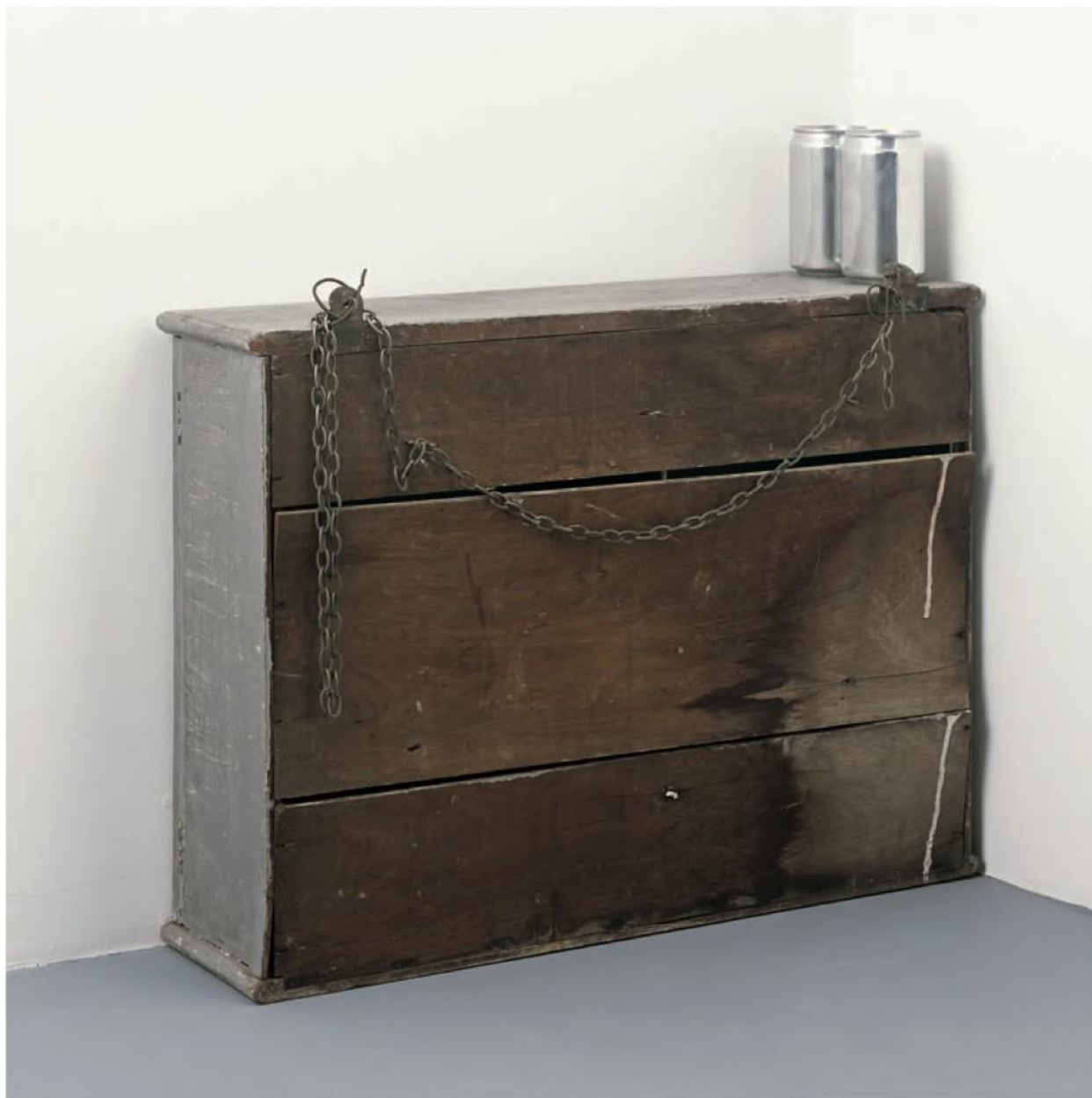
Figura 12. Lucia Nogueira. Untitled (1992) Armário de madeira, tinta prateada e latas de alumínio polidas. Kirkland Collection, Londres.