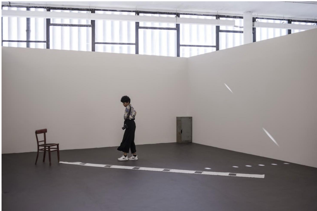
Figura 4 - Lucia Nogueira, Mischief , 1995; Anchor , 1992 © Leo Eloy / Estúdio Garagem / Fundação Bienal de São Paulo. Disponível em: http://33.bienal.org.br/pt/exposicao-individual-detalhe/5230

Na 33ª Bienal de São Paulo Afinidades Afetivas foi organizada uma exposição individual de Lucia Nogueira, situada em um piso elevado do chão no segundo pavimento do pavilhão do Ibirapuera. Nessa exposição pude interagir pela primeira vez com a obra da artista, até então desconhecida por mim. Fui cativada pela atmosfera de mistério ao redor de sua obra. Em especial, me lembro do efeito provocado pela obra "Sem título" (ventilador ligado) em que se observa por uma fresta, um ventilador de teto ligado, enclausurado em um cômodo. Fui tomada por um sentimento de curiosidade, e também vergonha, provocada por uma memória infantil de quem observa o que não se deve.