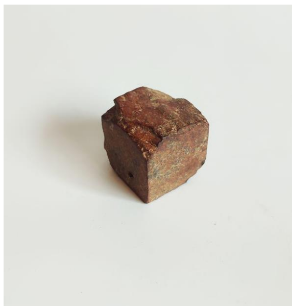
Figura 21 - Isabella Brito, Zé finí (2022). Cubo de limonita, 23 x 23 x 23 mm. Acervo Pessoal.

O trabalho zé fini (2022) é composto por uma formação mineral de limonita, um tipo de minério de ferro abundante na região da Serra Dourada em Goiás. A limonita possui a característica de poder formar cubos perfeitos, fato que sempre me intrigou, e desde a infância as coletei. Esta foi coletada na antiga fazenda dos meus ancestrais, que foi vendida. O que era abundante, hoje é um tesouro, escasso.