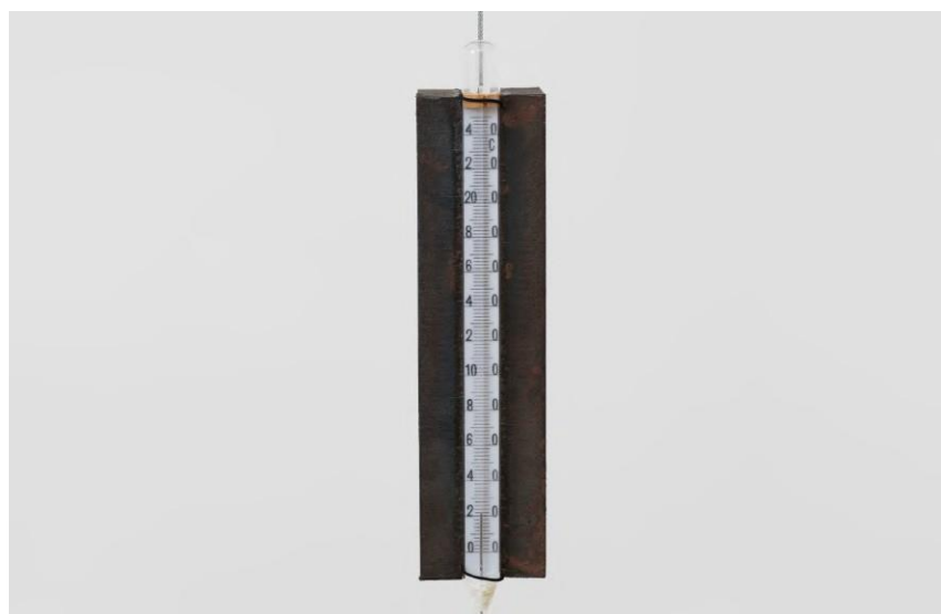
Figuras 9 e 10 - Lucia Nogueira. Sem Título (1988). Termômetro, barras de ferro, cabo de aço e elásticos. Dimensões variáveis.