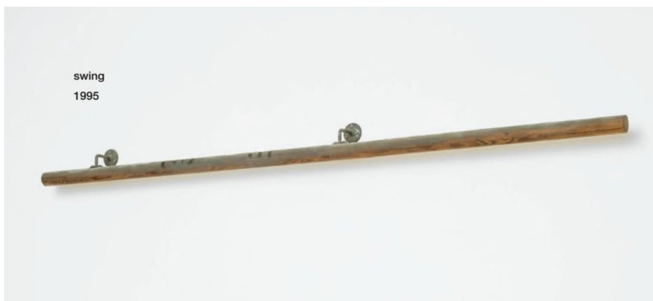
Figura 16- Lucia Nogueira. Swing (1995) madeira, metal, pó e gordura. 245 x 186 x 9cm. Espólio de Lucia Nogueira.

É como se houvesse um vácuo em formato de gente dentro ou ao redor do trabalho, ou mais precisamente, como um instante tingido por alguém que acabou de passar por ali, se algo assim fosse possível. Seus trabalhos parecem ser literalmente assombrados por seres que deixam uma marca - ainda que sutil ou incongruente - de sua passagem. (PÉREZ-BARREIRO, 2020, tradução nossa) 11