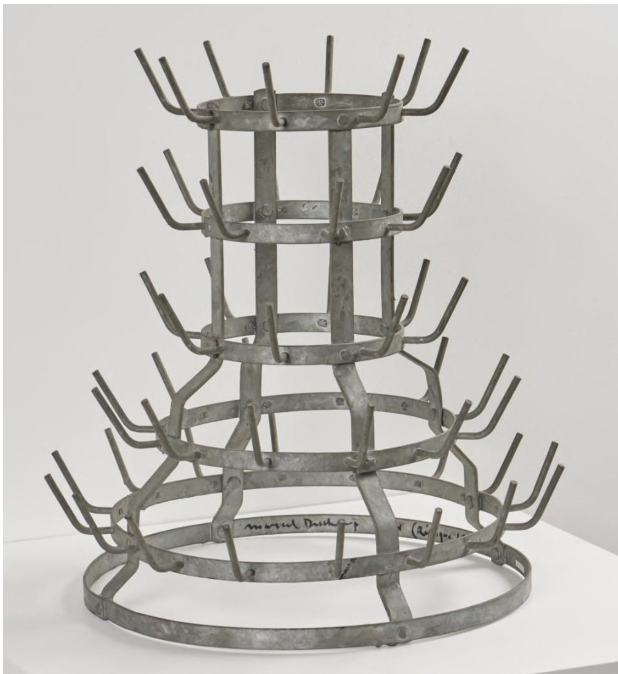
Figura 3 - Marcel Duchamp, Porta-garrafas (Bottle Dryer or Hedgehog), 1914. Museu de Arte da Filadélfia. © Artists Rights Society (ARS), New York / ADAGP, Paris / Association Marcel Duchamp.

Disponível em: https://philamuseum.org/collection/object/92377