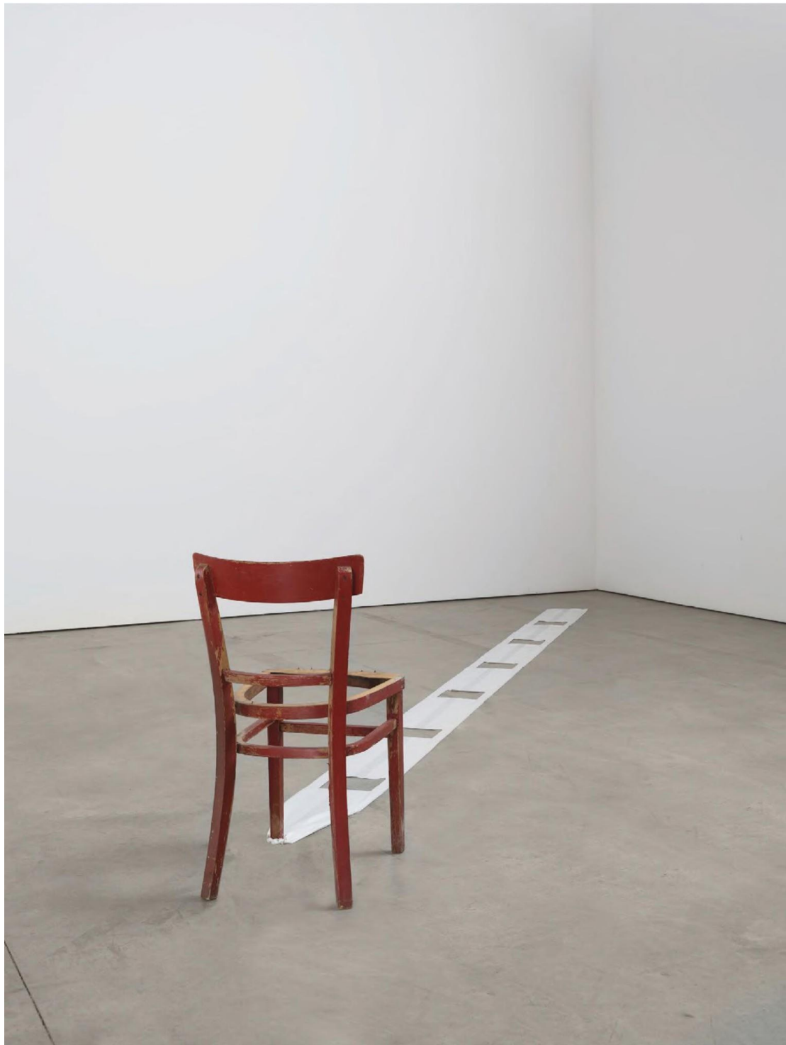
Figura 11 - Lucia Nogueira. Mischief (1995). Cadeira de madeira, sacolas. Dimensões variáveis. Fotografia de Farzad Owrang para a galeria Luhring Augustine. Fonte: PÉREZ-BARREIRO (2021)