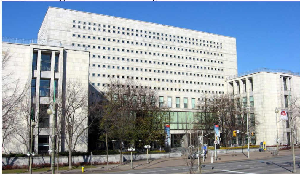
Figura 8- Biblioteca e Arquivo Nacional do Canadá