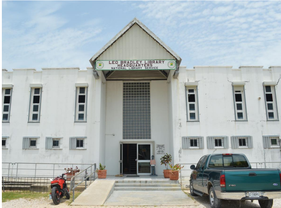
Figura 5- Biblioteca Nacional de Belize

metrópole britânica. Mas só em 1955 é que a biblioteca conseguiu operar com a filiação de bibliotecas nas capitais distritais. Já seu nome BNLSIS veio somente da emenda em 1966 (BELIZE NATIONAL..., [2022?]). “O BNLSIS está sob a tutela do Ministro da Educação, que nomeia uma Diretoria Estatutária para assegurar o bom e eficiente desempenho das funções do Serviço” (BELIZE NATIONAL..., [2022?]). A sede central da BNLSIS fica na Biblioteca Leo Bradley.