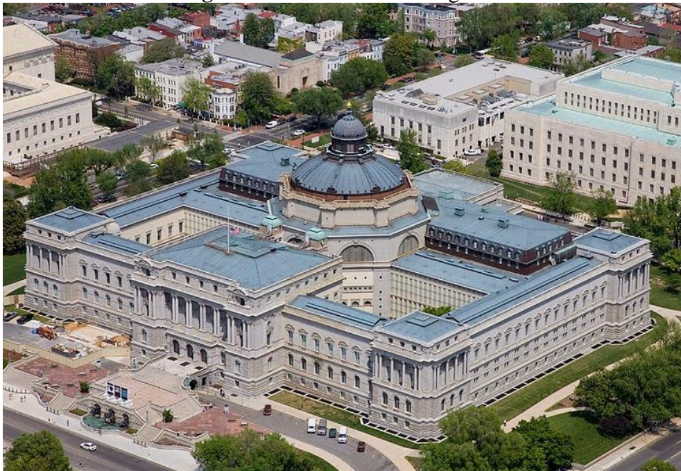
Figura 15- Biblioteca do Congresso

A instituição foi fundada em 1800 e instalada logo após em uma pensão, posteriormente foi transferida para o edifício do Capitólio dos Estados Unidos. Foi só em 1897 que teve seu edifício concluído, que viria a ser o seu atual, o Thomas Jefferson Building . Além do prédio principal da instituição, a Biblioteca do Congresso conta com o John Adams Building que foi concluído em 1939 e o James Madison Memorial Building (1980). E o Packard Campus da Biblioteca para Conservação Audiovisual na Virginia, que foi inaugurado em 2007. De início, a biblioteca tinha o objetivo de servir estritamente o Congresso norte-americano, mas passou por inúmeras transformações que a levaram a desempenhar um importante papel nos âmbitos legislativos, nacionais e internacionais (LIBRARY..., [2019?]).