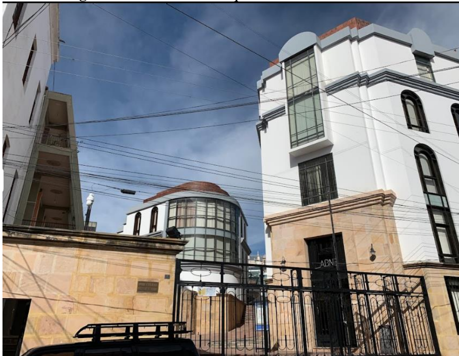
Figura 6- Biblioteca e Arquivo Nacional da Bolívia

Os primeiros acervos bibliográficos desta Biblioteca (grego, latim, espanhol e francês clássicos, livros de ciência e artes...) foram adquiridos por ordem expressa de Mariscal Sucre em Buenos Aires. A esses recursos bibliográficos somaram-se os dispersos livros recolhidos dos antigos conventos (dominicanos, agostinianos, jesuítas...) que na época colonial, a partir do século XVI, formaram magníficas bibliotecas na cidade de La Plata [...] (ARCHIVO Y BIBLIOTECA..., [2021?])