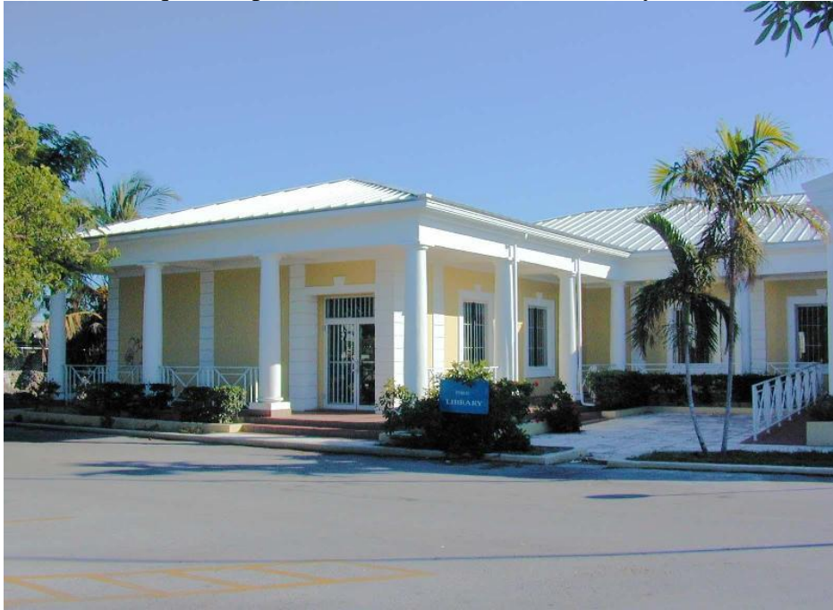
Figuras 4 - Biblioteca que compõe The Bahamas National Library and Information Services

Tem como atividades a produção de uma rádio comunitária; um catálogo com a união dos acervos das bibliotecas de todas as ilhas; treinamentos em competências de biblioteca e informação para o pessoal e programas de extensão com as escolas, entre muitos outros.