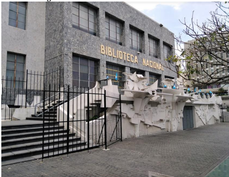
Figura 16- Biblioteca Nacional da Guatemala

A Biblioteca Nacional de Guatemala Luis Cardoza y Aragón foi fundada por um Decreto em outubro de 1879. Anteriormente contada como biblioteca pública, foi estruturada no Edifício da Sociedade Económica e novamente transferida para o salão principal da Universidade de San Carlos de Guatemala, até finalmente ter seu edifício próprio e fixo em 1957. A Biblioteca é a principal biblioteca de referência do país e um repositório de todo o material bibliográfico publicado na Guatemala, também é um ponto de encontro entre a instituição e o Centro Cultural da Guatemala.