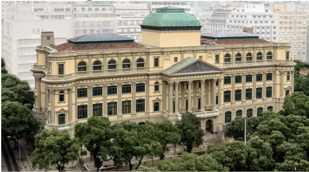
Figura 7- Biblioteca Nacional do Brasil