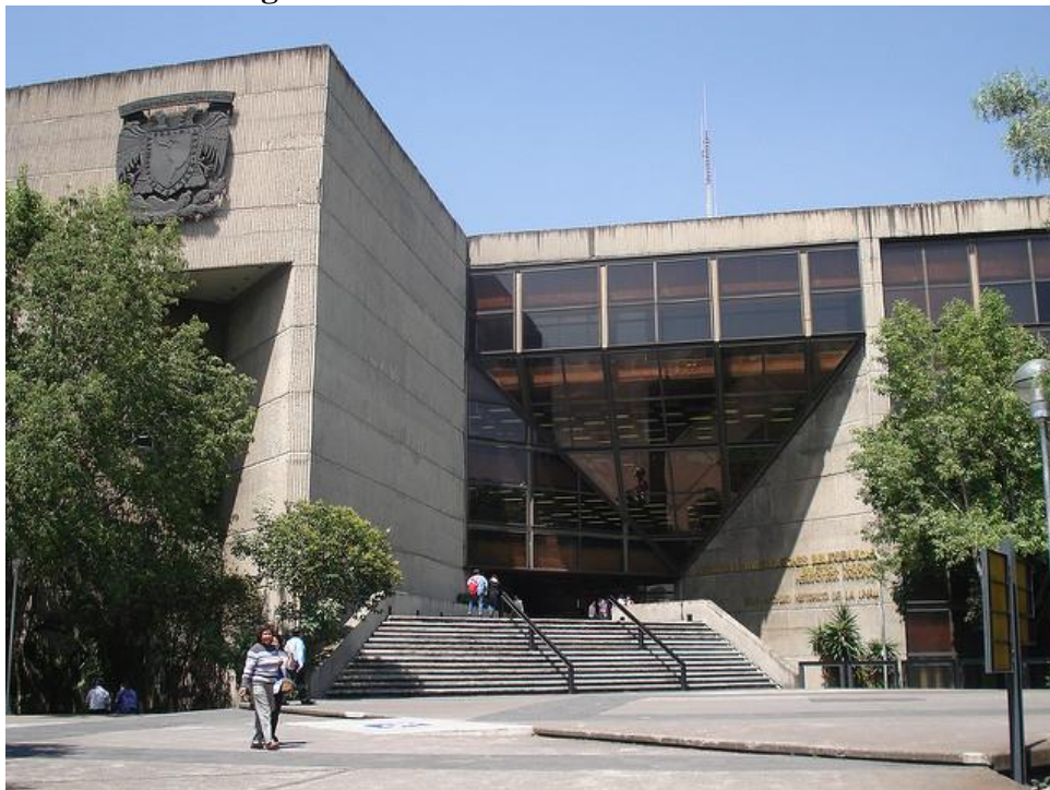
Figura 18- Biblioteca Nacional do México