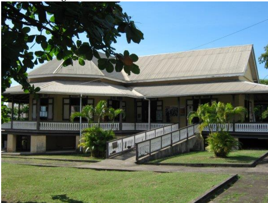
Figura 13- Biblioteca Nacional da Dominica

Dominica Library and Information Service (DLIS) é a principal instituição pública de prestação de serviços de informação do país de Dominica; tem como função o selecionamento, aquisição, organização, preservação e disponibilização de materiais impressos e eletrônico “para atender às necessidades lúdicas, informativas e educacionais da comunidade e estimular o gosto pela leitura e pelo aprendizado” (DOMINICA LIBRARY..., [2022]).