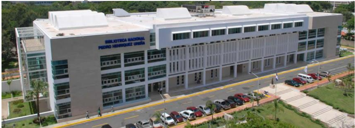
Figura 23- Biblioteca Nacional da República Dominicana

diferentes secretarias (hoje ministérios) e outros órgãos do Estado dominicano” (GOBIERNO DE LA..., [2022]), logo depois, a criação da Secretaria de Estado da Cultura veio no ano de 2000, integrando todas as entidades culturais do país.