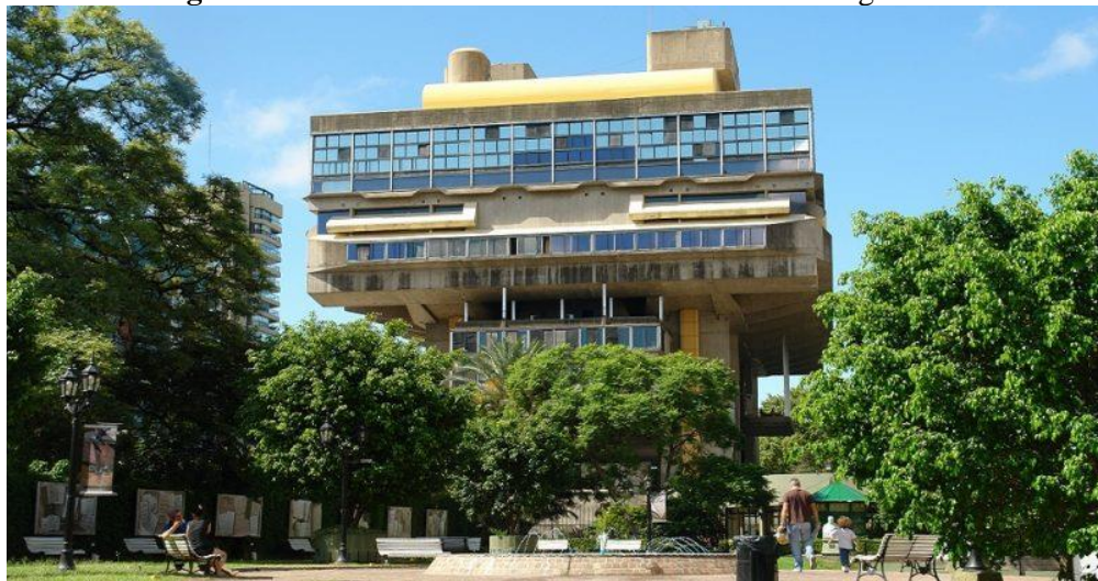
Figura 2- Biblioteca Nacional Mariano Moreno da Argentina

A Biblioteca Nacional Mariano Moreno (BNMM) da República Argentina, foi fundada em 1810 como Biblioteca Pública de Buenos Aires no marco da Revolução de Maio, até ser constituída então como instituição de preservação da cultura argentina. Tem como objetivo “fornecer serviços de informação de qualidade e tornar-se uma referência nacional e internacional na definição de políticas de biblioteconomia” (BIBLIOTECA NACIONAL..., [2022?]).