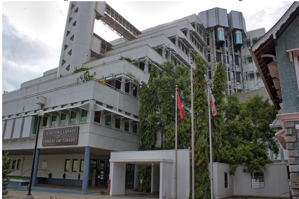
Figura 25- Biblioteca Nacional de Trinidad e Tobago