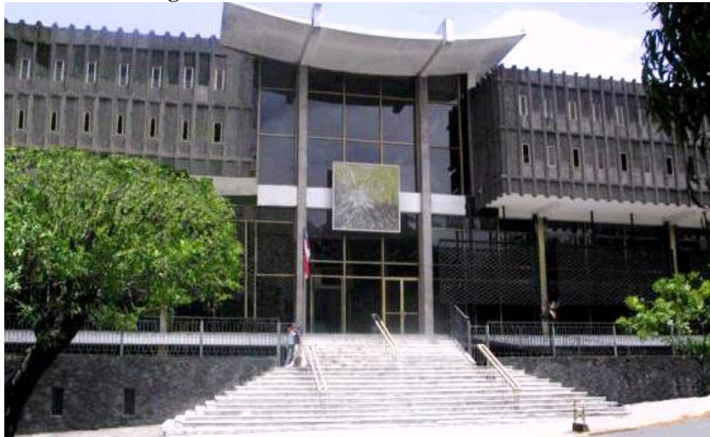
Figura 11- Biblioteca Nacional da Costa Rica

mesmo ano, porém abriu para o público em 1890. Seu acervo original remonta de doações feitas pela Universidade de Santo Tomás (SISTEMA NACIONAL..., [2022?]). Em 1971 ela se muda definitivamente para seu endereço atual. Tem como função a de reunir, preservar, conservar e difundir o patrimônio documental de todo o país, e criar instrumentos de apoio necessários para o conhecimento e utilização dos fundos documentais, com o fim de contribuir com o desenvolvimento do país (COSTA RICA, [1999?]).