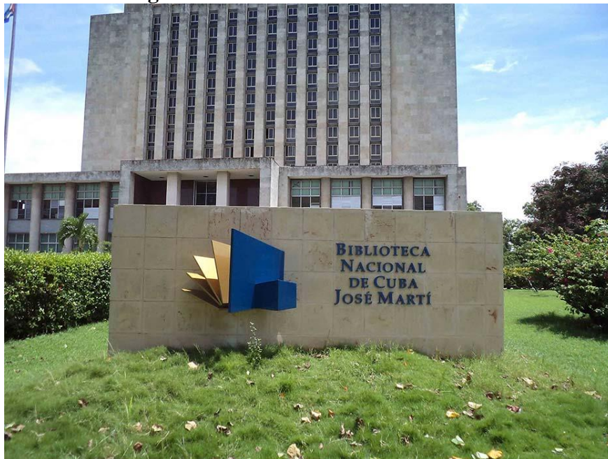
Figura 12- Biblioteca Nacional de Cuba