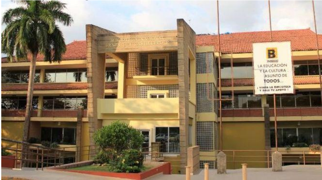
Figura 20- Biblioteca Nacional do Panamá