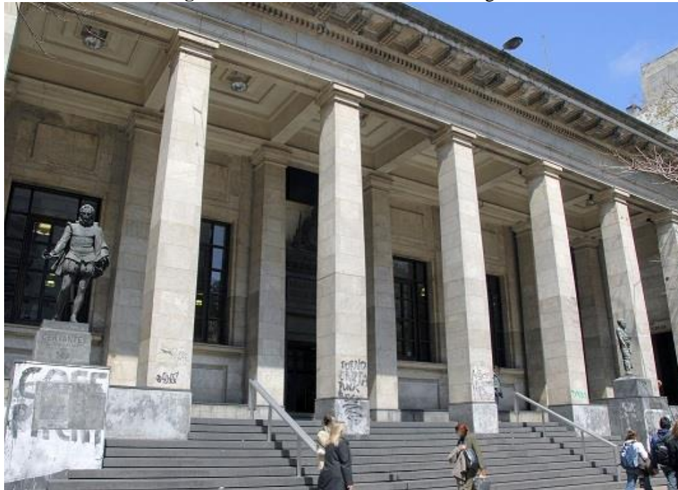
Figura 26- Biblioteca Nacional do Uruguai

Seu prédio encontra-se na capital do país, Montevidéu. Em 2014, a instituição apresentou a Biblioteca Digital do Bicentenário do Uruguai, em comemoração aos 250 anos de sua fundação.