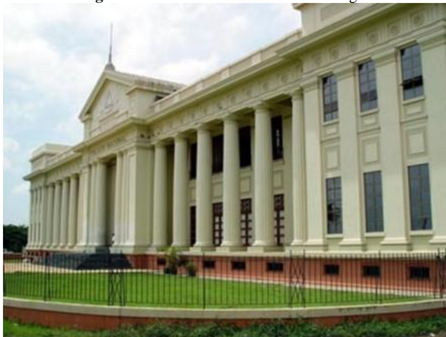
Figura 19- Biblioteca Nacional da Nicarágua

O governo nicaraguense nomeou uma comissão de intelectuais para selecionar obras espanholas que deveriam formar o acervo básico inicial da Biblioteca Nacional. Seu prédio atualmente ainda ocupa o mesmo lugar em que foi inaugurado, no lado noroeste do antigo Palácio Nacional (BIBLIOTECA NACIONAL..., 2012).