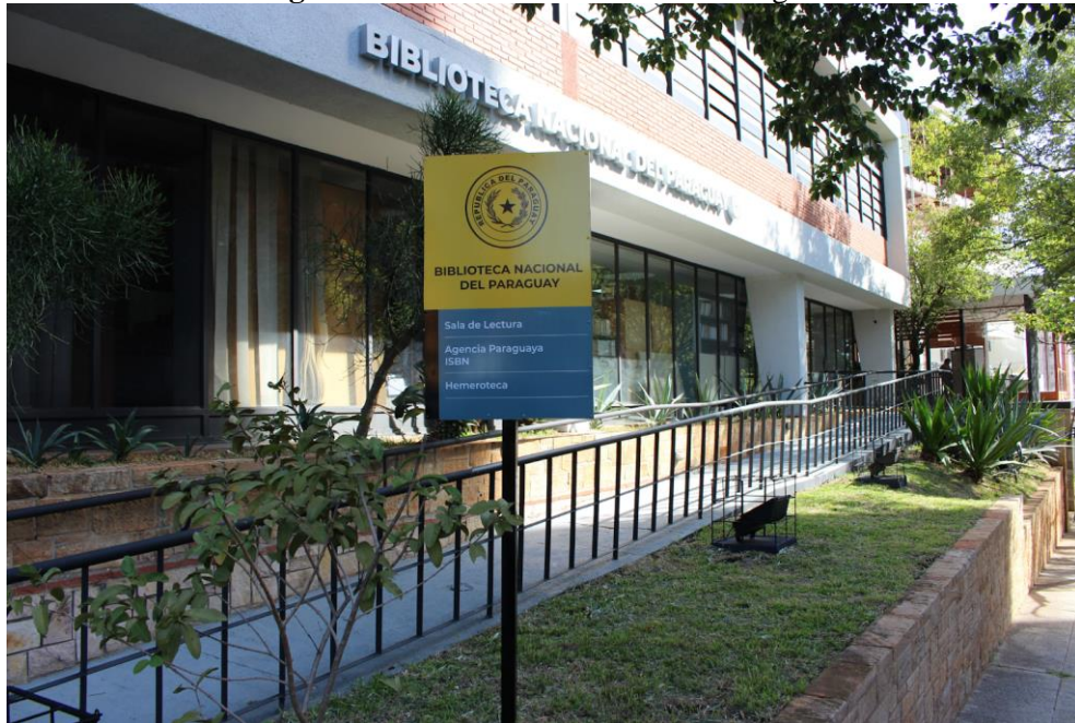
Figura 21- Biblioteca Nacional do Paraguai