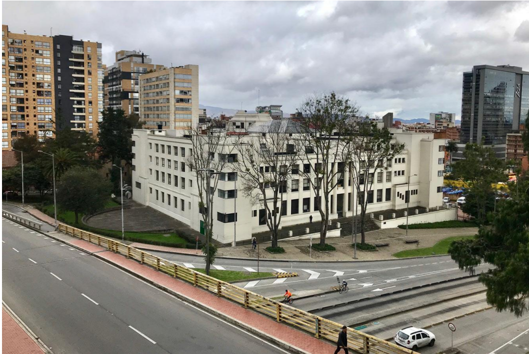
Figura 10- Biblioteca Nacional da Colômbia

necessidade de retirar a educação do domínio da escolástica e de se abrir às novas ideias do Iluminismo” (BIBLIOTECA NACIONAL..., [2022]).