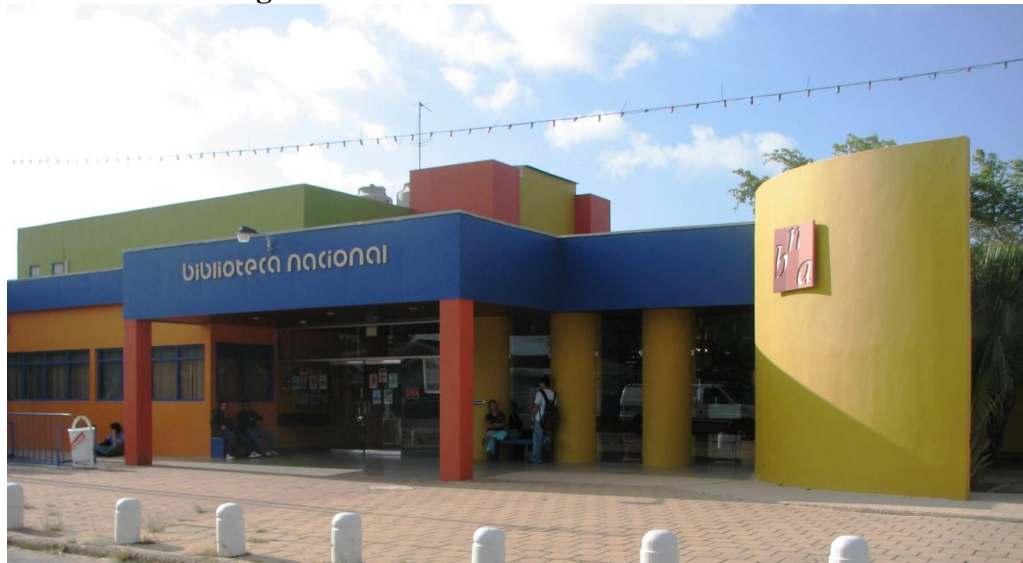
Figura 3- Biblioteca Nacional Aruba

• Fonte: (BIBLIOTECA NACIONAL..., [2022?])