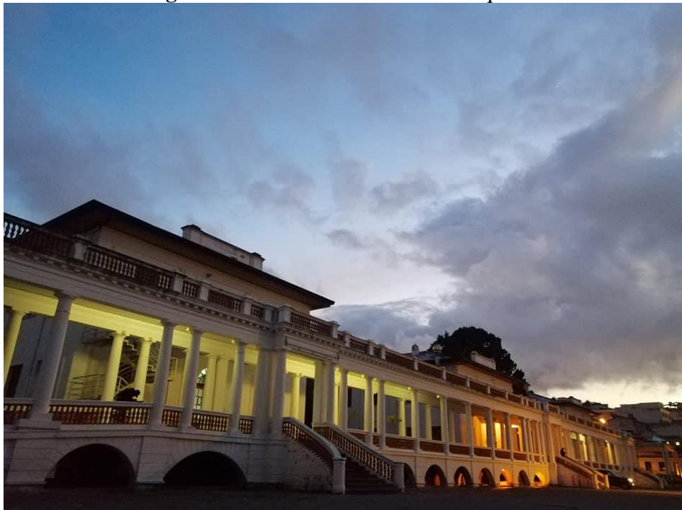
Figura 14- Biblioteca Nacional do Equador

A Biblioteca Nacional Eugenio Espejo do Equador (BNEE) teve como data de fundação 1791 com a primeira Biblioteca Pública e expulsão da Ordem dos Jesuítas do território, tendo parte do acervo entregue à instituição no mesmo ano. Já em 1838, ela passa a ser denominada como Biblioteca Nacional, e por meio de Decreto Legislativo em 1869, é estabelecido um antecedente do Depósito Legal, uma lei de instrução pública que garante que a Biblioteca Nacional tenha o direito a uma cópia de todas as publicações equatorianas. O Depósito Legal só é estabelecido depois em 1896. A BNEE passa por inúmeras mudanças de endereços e encargos, até que finalmente em agosto de 2017, fica estabelecido que ela se tornaria uma entidade operacional descentralizada do Ministério da Cultura e Patrimônio do Equador (BIBLIOTECA NACIONAL..., [2019]).