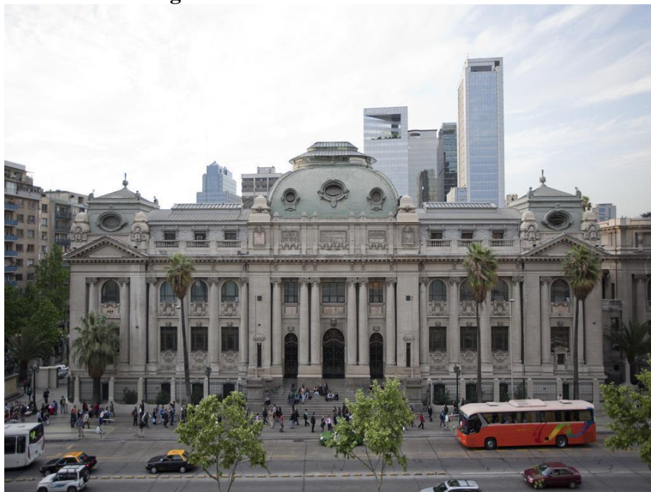
Figura 9- Biblioteca Nacional do Chile

A Biblioteca Nacional de Chile foi uma das primeiras instituições republicanas do país, fundada em 1813 pela Proclamação da Fundação Biblioteca Nacional (BIBLIOTECA NACIONAL... [2022?]), e teve como primeiras coleções antigos acervos, advindos dos jesuítas, que estavam guardados na Universidade de San Felipe, outra forma de arrecadação foi pelos moradores de Santiago e cidades ao redor, que doaram parte de seus livros (BIBLIOTECA NACIONAL... [2022?]).