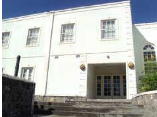
Figura 24- Biblioteca Nacional de São Cristóvão e Névis

A National Library of Saint Kitts and Nevis é uma entidade consolidada pela portaria de 1890, a qual garantiu a primeira biblioteca pública em Basseterre e outra em Charlestown (capitais das ilhas). Após um grande incêndio em 1982, a biblioteca passa por uma reconstrução e muda-se para um novo ambiente em 1997.