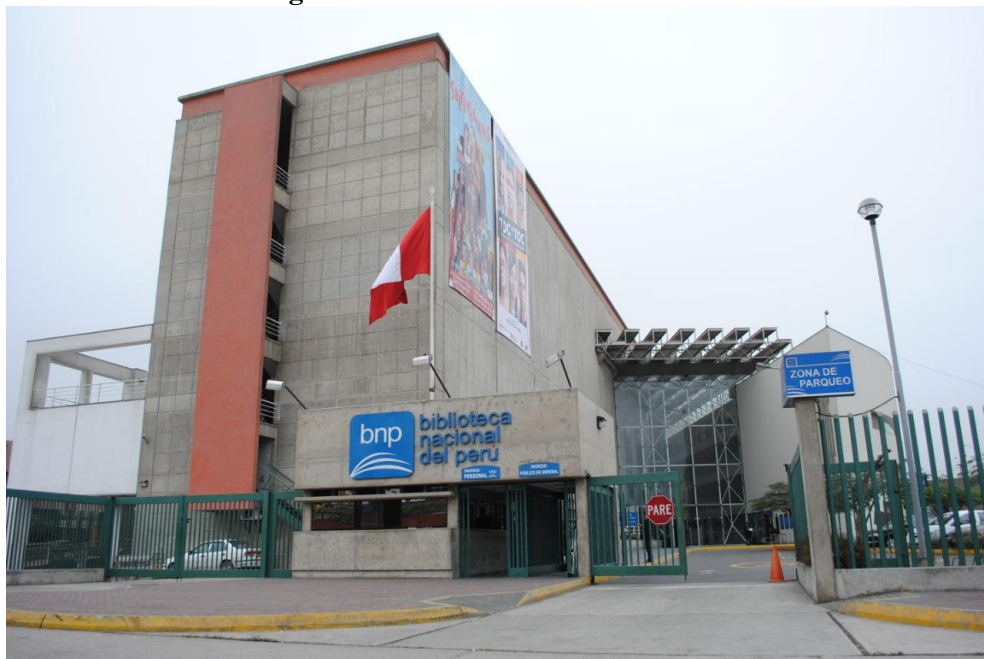
Figura 22- Biblioteca Nacional do Peru

Em 2006, a Biblioteca ganhou um novo prédio, mais equipado e moderno. A construção levou cerca de 10 anos para ser concluída, e a interrupções foram muito devido à falta de orçamentos. Mais tarde, em 2017, foi promulgada a Ley General de la Biblioteca Nacional del Perú , que estabeleceu diretrizes e normas básicas para o funcionamento da Biblioteca Nacional. Posteriormente, através de um Decreto Supremo, foi aprovada a lei que “estabelece que a Biblioteca Nacional do Peru é um órgão público executor e órgão dirigente do Sistema Nacional de Bibliotecas, vinculado ao Ministério da Cultura” (BIBLIOTECA NACIONAL..., [2021]).