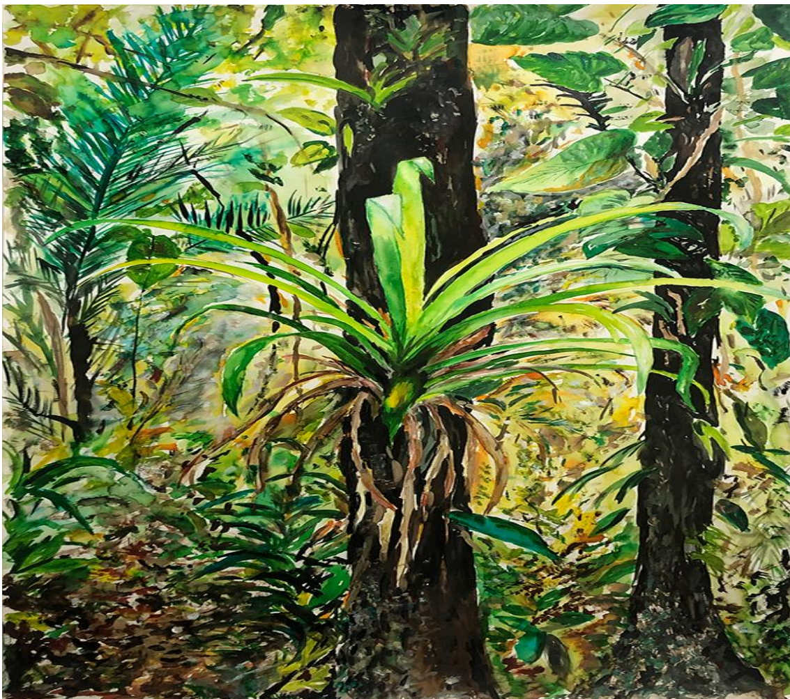
Fig. 3. Hugo Fortes. Floresta do Isolamento, 2021 Acrílica sobre papel – 110 x 75cm. Fonte: Hugofortes.com

Disponível em: < https://www.hugofortes.com/paintings >. Acesso em: 30 nov. 2024.