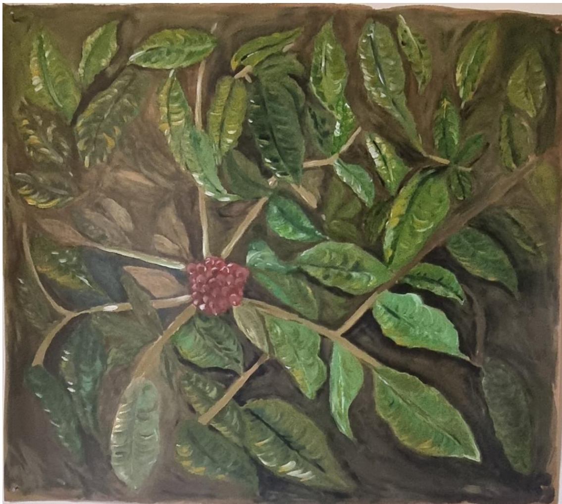
Fig.6 Iracilda Cavalcante – Sem título, 2023, Mista sobre Papel – 81,5 x 91 cm, Acervo pessoal