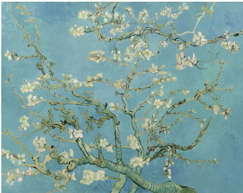
Fig. 1. Vincent Van Gogh. – Amendoeira em Flor. 1890. Óleo sobre tela – 73,5cm x 92,4cm Museu Van Gogh.

Da obra de Van Gogh, escolheu-se “Amendoeiras em Flor” (figura 1), para a elaboração de uma releitura, como forma de finalizar este trabalho de conclusão do curso.