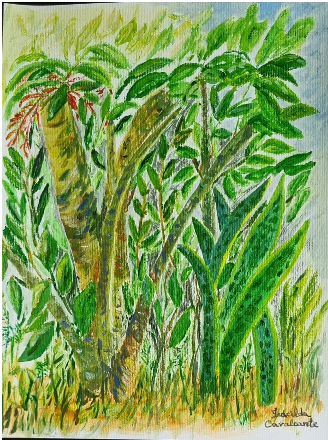
Fig. 7 Iracilda Cavalcante – Sem título, 2024, Acrílica sobre papel – 29 x 40 cm, Acervo pessoal