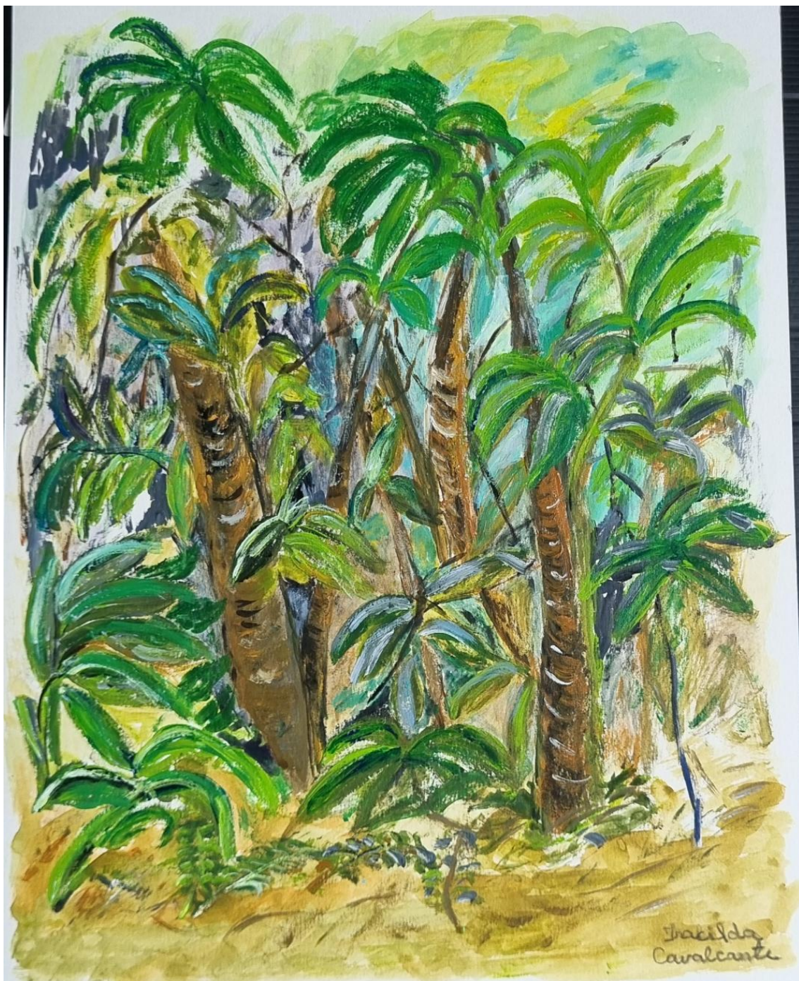
Fig. 9 Iracilda Cavalcante – Sem título, 2024, Acrílica sobre papel – 29 x 40 cm, Acervo pessoal.