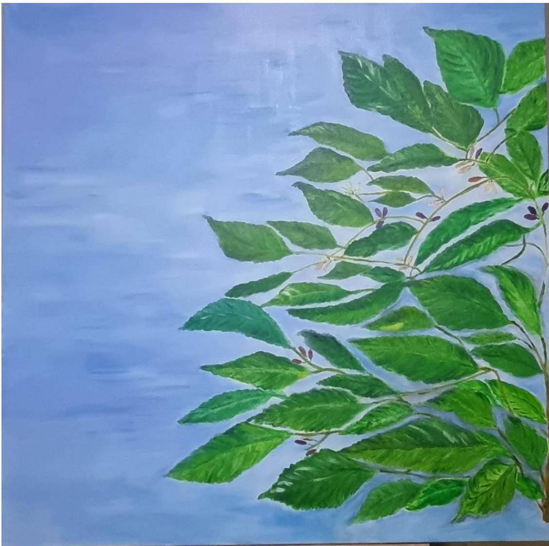
Fig. 11 Iracilda Cavalcante – Amoreira, 2024, Acrílica sobre tela – 100 x 100 cm, Acervo pessoal

Nessa série, a autora buscou trabalhar detalhadamente as pinceladas e cores, com a finalidade de levar a uma experiência sensorial no observador durante a fruição. À medida que as cores iam se sobrepondo cada tela foi se transformando em uma obra única. Quando colocadas em série as obras acabam conversando entre si.