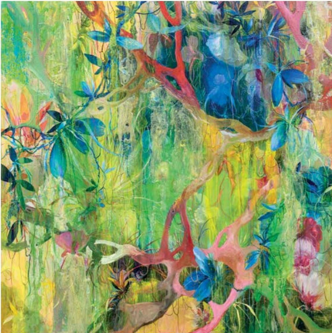
Fig.5 Fernando Lindote – Entre as flores e a bruma de março (Selva úmida), 2016, Óleo sobre tela – 100 x 100 cm

Disponível em: < https://www.google.com/url?sa=t&rct=j&q=&esrc=s&source=web&cd=&ved=2ahUKEwiZ96qn0q2KAXU5K7kGHRbkOdUQFnoECBgQAQ&url=https%3A%2F%2Fseer.ufu.br%2Findex.php%2Fouvirouver%2Farticle%2Fdownload%2F51508%2F32568%2F273523&u sg=AOvVaw03Er_CixCMwnJkWCozkZRJ&opi=89978449 > Acesso em: 30 nov. 2024.