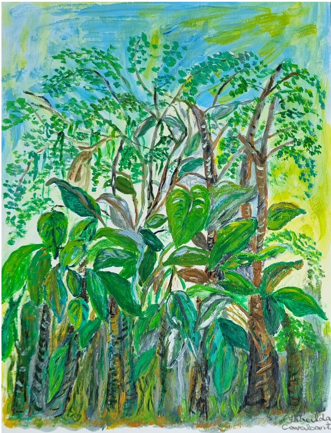
Fig. 8 Iracilda Cavalcante – Sem título, 2024, Acrílica sobre papel – 29 x 40 cm, Acervo pessoal