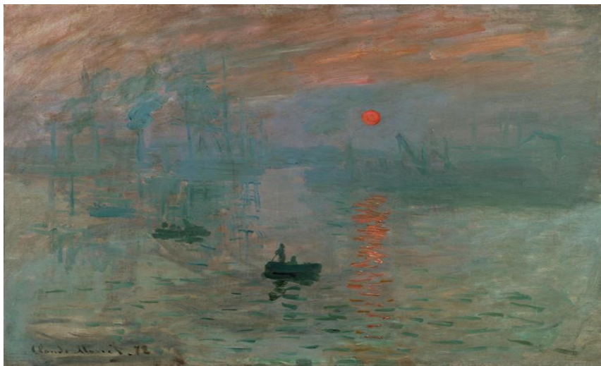
Fig. 2. Claude Monet. Impressão, Nascer do Sol. 1872. Óleo sobre tela – 63 x 48cm. Museu Marmottan Monet.

Uma das pinturas de Monet que não podemos deixar de falar é “Impressão: nascer do sol” 1872 (Fig. 02), o qual originou o nome do movimento e nela vemos o real conceito de Impressionismo, onde a luz e o movimento utilizando pinceladas soltas tornam-se o principal elemento da pintura.