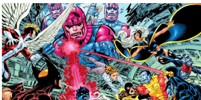
Figura 1 – Os sentinelas

Em 1980, os assassinatos de Charles Xavier, Moira MacTaggart e do senador Robert Kelly, desencadearam um sentimento de ódio ainda maior aos mutantes. Uma lei dando poder aos Sentinelas foi aprovada e, quando a humanidade percebeu, eram os robôs que estavam no controle. Os Sentinelas foram utilizados por diversos grupos para tentar destruir os X-Men, entre eles o Governo norte-americano e o de Genosha 5 . Houve duas situações em que os mutantes usaram Sentinelas contra outros mutantes: O viajante do tempo Trevor Fitzroy os usou para enfrentar os X-Men, e Massacre para controlar a cidade de Nova York. O maior dano já causado à população mutante por esses robôs, foi conduzido por Cassandra Nova, que utilizou dois Sentinelas gigantes para eliminar mais de meio milhão de mutantes em Genosha.