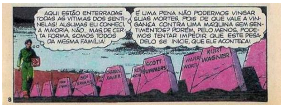
Figura 5 – Extermínio dos mutantes

Tratando de extermínio, Arendt (1989, p. 28) traz que após a aniquilação da grande maioria dos judeus da Europa, o antissemitismo eterno se tornou extremamente perigoso, pois