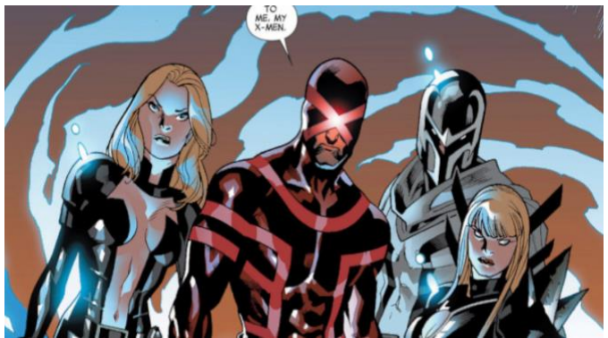
"To me, my X-Men". (Charles Xavier)