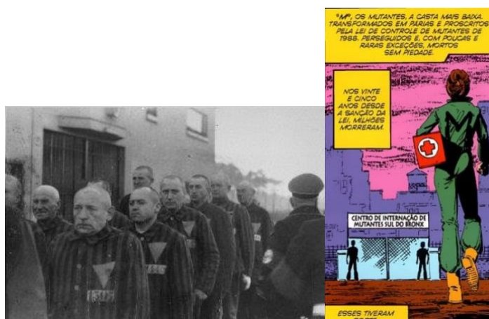
Figura 4 – Isolamento em campos de concentração

Por sua vez, as Leis Jim Crow legalizavam o racismo e a condição social inferior a que a população negra era submetida através da segregação, institucionalizando o descaso para com decisões inconstitucionais. A respeito disso, Martins (2019, p. 312) expõe: