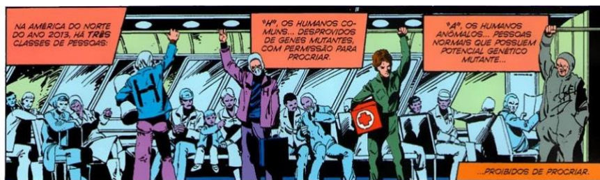
Figura 3 – Categorização das pessoas conforme genes mutantes

Essa referência de divisão dos mutantes por categorias nos remete a como os judeus eram identificados através de marcações. Durante o nazismo, era estabelecido que todo judeu fizesse o uso da Estrela de Davi, tornando-se assim, um meio de identificação para que os judeus fossem excluídos da sociedade. As Leis Raciais de Nurembergue (1935) estabeleciam com rigor quem era judeu puro, meio judeu, mestiço, judeu de primeiro ou segundo grau ou suposto judeu.