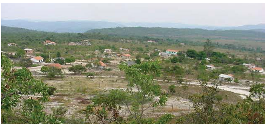
FIGURA 1: Comunidade Engenho II, em Cavalcante-GO

Em visita ao território Kallunga foram realizadas visitas às seguintes comunidades: Engenho 2, Ema e Diadema. A comunidade do engenho II é representada na Figura 1.