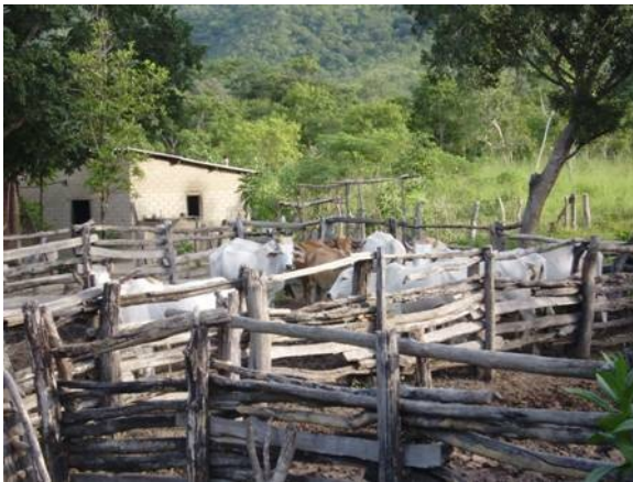
Figura 8: A criação de gado denota a distinção do poder aquisitivo entre os Kalunga.