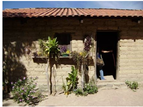
Figura 9: Casa sem cercados e com plantas no jirau para proteger contra animais. Autoria: M.G de Almeida, abril de 2009.

A cerca delimita aqui a propriedade privada, diferenciada. O poder aquisitivo do domínio familiar revela-se pelo construído: a casa de farinha, o poleiro para as galinhas, os novos quartos, que ampliam os cômodos da casa de moradia.