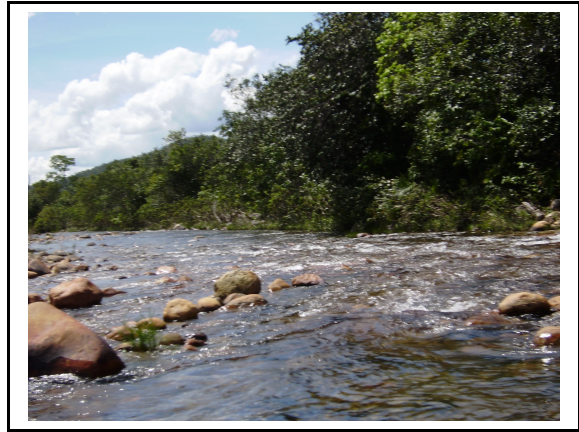
Figura 3: O Rio Corrente e seu leito rochoso. Autoria: M.G de Almeida, abril 2009.

A comunidade Kalunga, em proposta feita por Marinho (2008), foi dividida em quatro núcleos principais: o Engenho II_ considerado mais dotado de infra-estrutura, mais próximo de núcleos urbanos de Cavalcanti e Alto Paraíso e de fácil acesso, o Vão do Moleque, o Vão de Almas e o antigo Ribeirão dos Negros rebatizado como Ribeirão dos Bois. Não existe limite territorial entre os núcleos. Além disso, cerca de 62 povoados distribuem-se entre eles como o Curriola, Ema, Ribeirão, o Taboca, o Areia, o Maiadinha, o de Capela, para citar alguns (figura 4). A rica toponímia que designa as serras, os rios, os vãos e os agrupamentos de casas, remete-se a uma construção subjetiva, a um dado símbolo natural ou cultural do lugar em questão. Configura-se, na concepção do Bonnemaïson (1981, p.256), como um geossímbolo, “um lugar, um itinerário, um acidente geográfico, que por razões políticas, religiosas, históricas ou culturais possuem aos olhos de certos grupos sociais ou povos uma dimensão simbólica que alimenta e conforta sua identidade”.