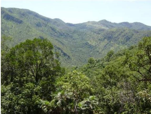
Figura 2: Relevo acidentado e vegetação de cerrado