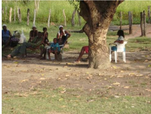
Figura 5: convivialidade e parentesco fortalecem as relações entre as comunidades de Vão de Almas, Engenho II e Vão de Moleque.

Kalunga são detentores de bens que são suas “extensões morais”. Eles reconhecem a herança cultural e o local de vivência com suas características naturais, como definidores de seu grupo social e de sua identidade territorial. ( figura 5)