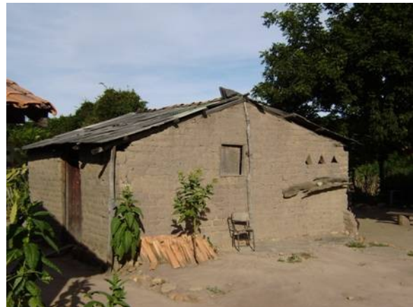
Figura 7: Casa de adobe construída pelo próprio Kalunga.