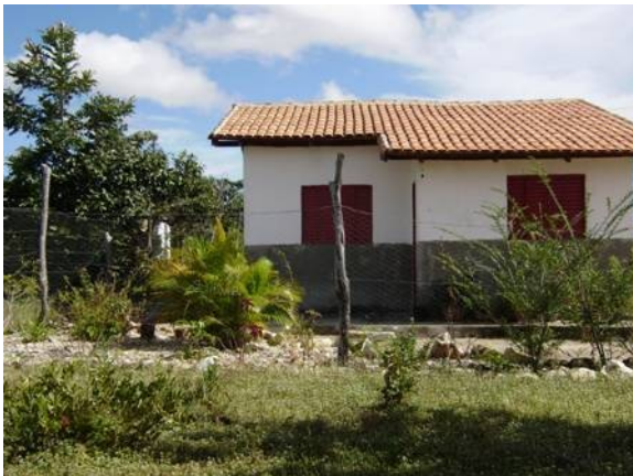
Figura 6: Casa Kalunga construída por meio de uma política de moradia.

A Região do Vão de Almas é menos servida por estradas e contribuiu para que tivesse seu isolamento maior que o Vão do Moleque. Também, o padrão do habitat rural, exceto no Engenho II, apresenta-se bastante disperso, as moradias são camufladas pela vegetação. Elas geralmente estão ao pé das serras, mais próximas uma das outras apenas por razões de parentesco (figuras 6 e 7). Raras são as moradias na beira das poucas estradas e, quando existem, a casa foi construída por meio de uma política municipal nos anos 1980 (MARINHO, 2008). Os inúmeros caminhos, trilhas que circulam serpenteando as serras, cortando rios, varando o cerrado facilitam a circulação e os contatos. A sociabilidade local é, portanto, construída por meio de agrupamentos de famílias, vinculadas pelo sentimento de localidade, pela convivência, pelas práticas de auxílio mútuo e pelas atividades festivas.