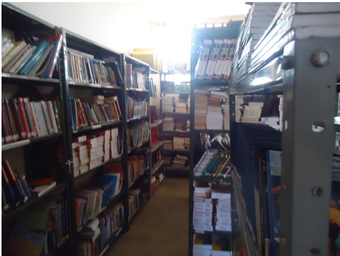
Fig.9 Excesso de acervos nas estantes e raios solares sobre os mesmos.