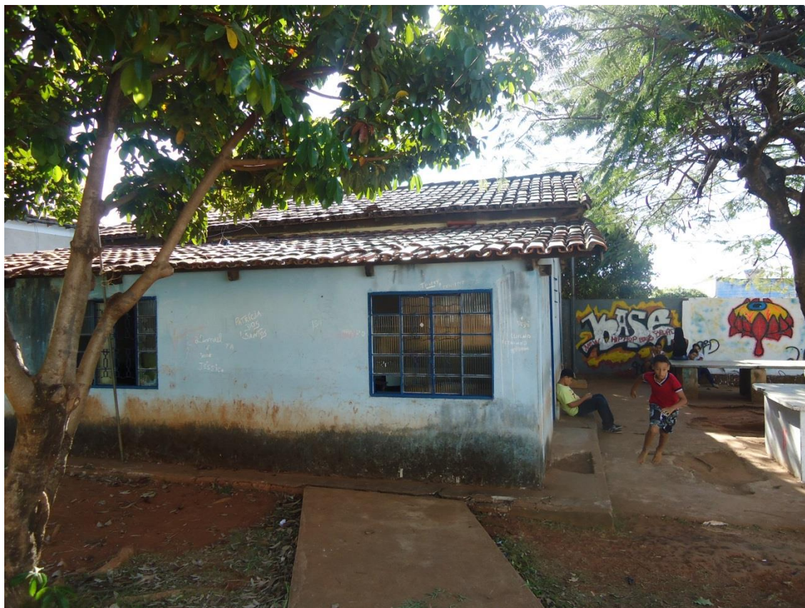
Fig 12 e 13 = Bibliotecas das Escolas Municipais.