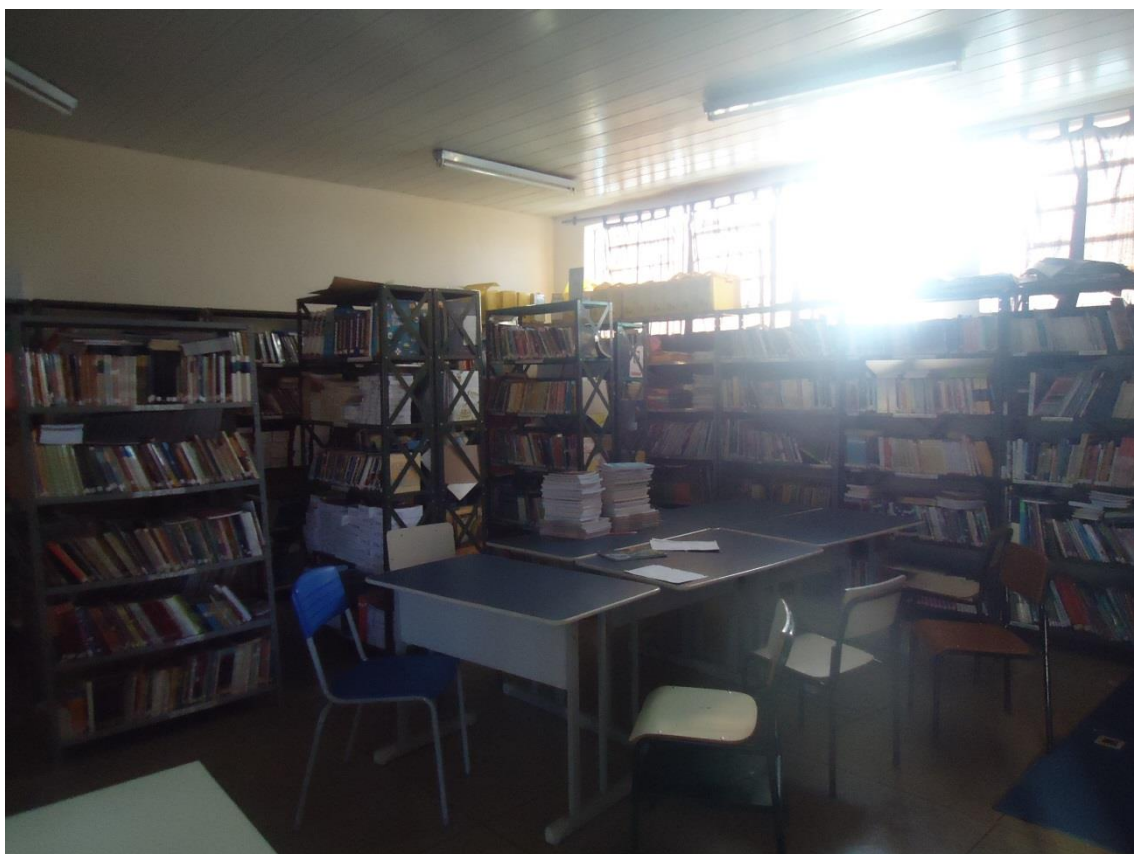
Fig 8 = Falta de espaço entre as estantes e raio solar nos acervos

Todos os entrevistados (100%) consideraram que o espaço físico das bibliotecas da cidade de Inhumas é inadequado e insuficiente para promoverem projetos de leitura, teatro ou outro tipo de atividades.