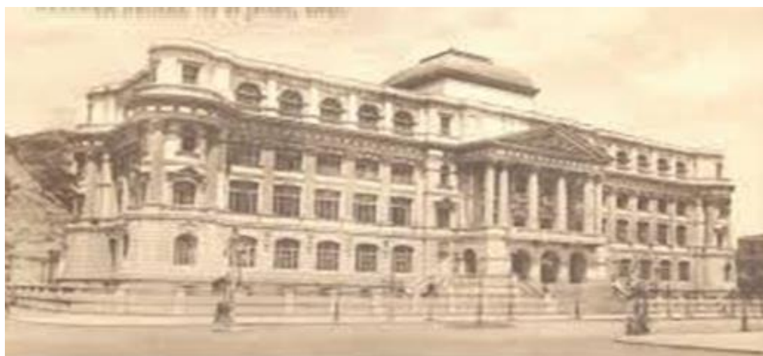
Fig.2. Biblioteca Nacional

Seguida da biblioteca Nacional do Rio de Janeiro, a qual foi fundada em 1814, com as mesmas características das bibliotecas no mundo antigo, cujo acervo não era acessível ao público em geral, o caráter restrito se mantinha, neste caso a biblioteca nacional destinava o acesso somente à família real, já que todo acervo original era oriundo da mesma, alguns eruditos também tinham acesso à biblioteca, mediante autorização para consultar o acervo.