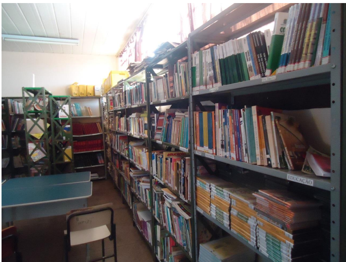
Fig 14 = Excesso de acervo, estantes sinalizadas com raios solares

Referente ao questionamento sobre outros materiais, os responsáveis pelas bibliotecas não souberam responder colocando sim ou existe na resposta.