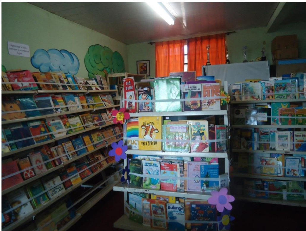
Fig 16 = Estantes junto da parede