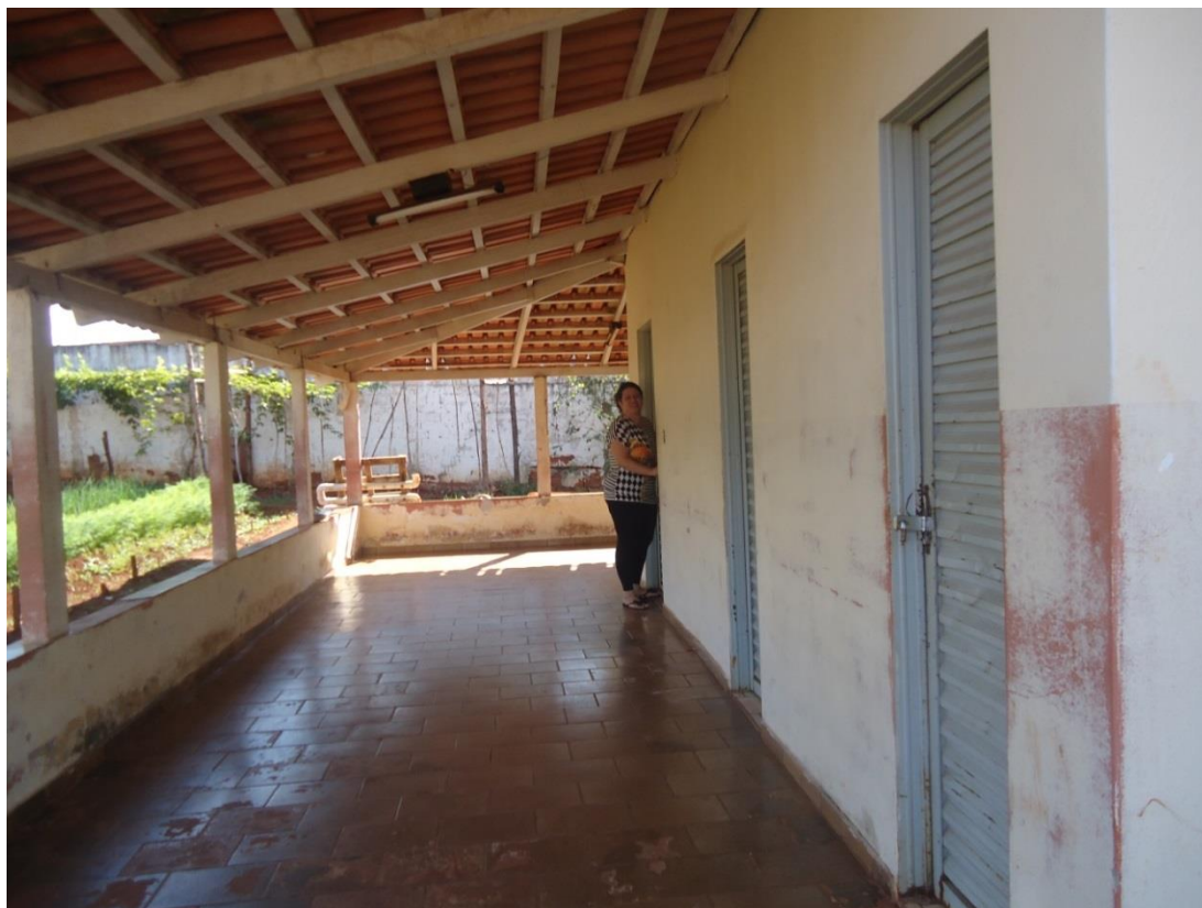
Fig 11 = Biblioteca sem sinalização