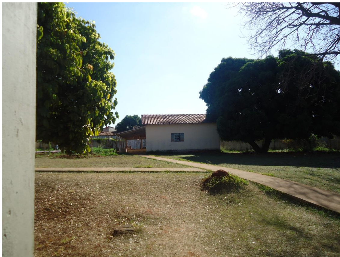
Fig 10 = Biblioteca bem no fundo do Colégio

As doze bibliotecas visitadas têm uma iluminação interna boa com pouca ventilação. A biblioteca do C1 é bem ventilada, possui mais janelas e recebe luz solar todo o período da manhã. A localização em relação ao todo é de fácil acesso, menos as bibliotecas dos C4, C5, E.E1, E.E2, E.M3 que são em casas adaptadas para ser uma biblioteca, sem nenhuma sinalização, ficando assim de difícil acesso, principalmente na época da chuva.