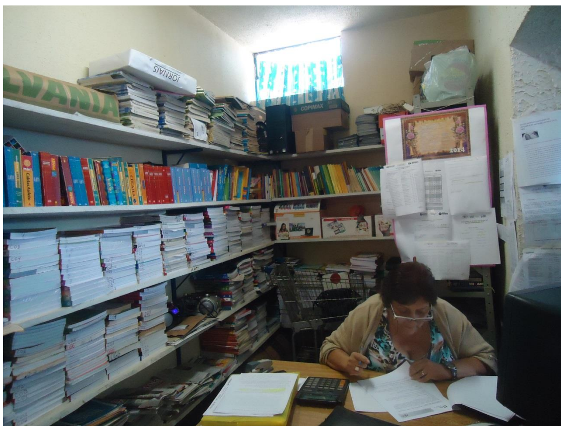
Fig 3 = Biblioteca e sala de Direção

Em nenhuma das bibliotecas existe sistema de segurança e não possuem extintores de incêndios visíveis. O que se mostra preocupante já que o papel permite que o fogo se alastre rapidamente.