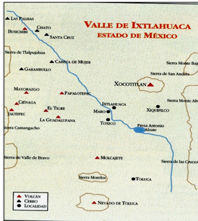
Figura 2: Zona norteña

3,750 msnm 23 ), así como el cerro de Atlacomulco (que rebasa los 3,000 msnm) y otras prominencias más (AHA, caja 207, exp. 1798, fojas 4-5, agosto, 1948 en REYES, 2006 p.26).