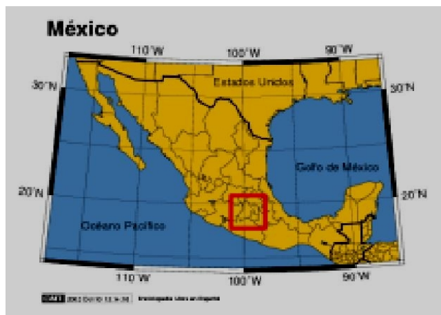
Figura 1- Estado de México

temporal, la mayor altitud que predomina en las dos primeras zonas ha implicado la necesidad de adaptar, en éstas, las respectivas formas agrícolas a ciertas limitantes que imponen las condiciones del entorno natural, debido a que el despliegue anual de las heladas es más amplio que en buena parte de la zona sureña.