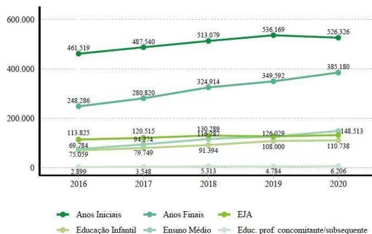
Figura 2. Número de matrículas de alunos com deficiência, transtornos globais do desenvolvimento ou altas habilidades em classes comuns ou especiais exclusivas segundo etapa de ensino – Brasil – 2016 a 2020

Já em 2020, o número de matrículas aumentou 34,7% desde 2016, chegando a 1,3 milhão de matrículas. Assim como no gráfico anterior, o maior número de matrículas está no ensino fundamental, concentrando 69,6% das matrículas da educação especial (BRASIL, 2021).