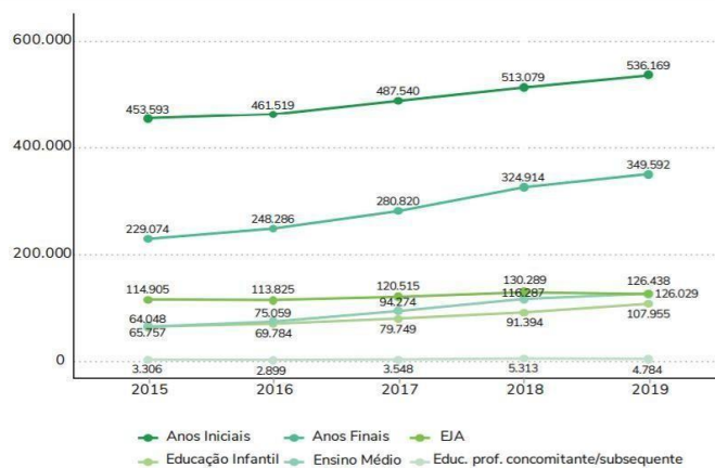
Figura 1. Número de matrículas de alunos com deficiência, transtornos globais do desenvolvimento ou altas habilidades em classes comuns ou especiais exclusivas segundo etapa de ensino – Brasil – 2015 a 2019

percebe-se (na figura 1 que corresponde ao gráfico 30, do Censo) que as matrículas de ensino médio são as que mais cresceram, um aumento de 91,7% (BRASIL, 2020b).