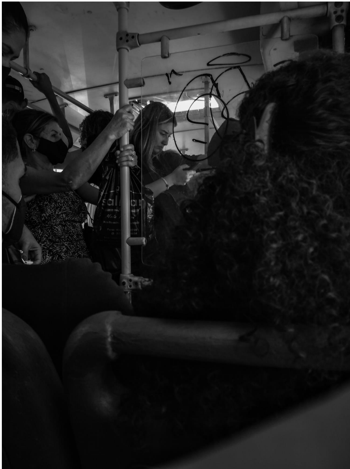
Figura 23 – Alguém e ninguém ao mesmo tempo (2022)