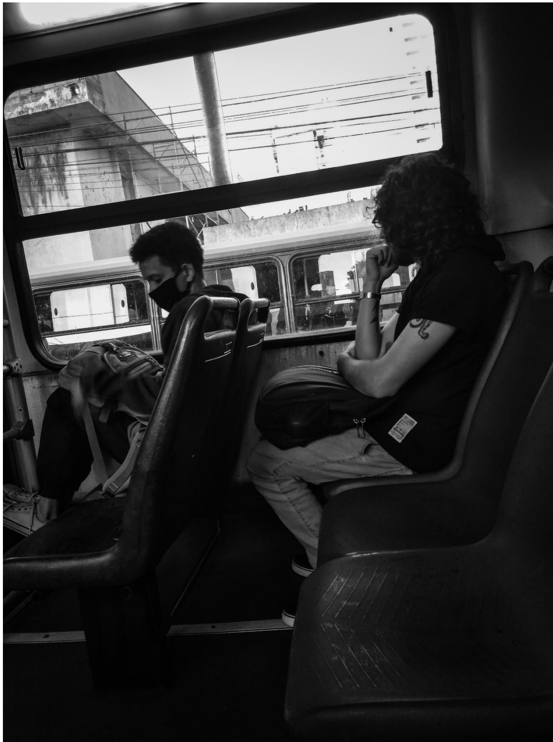
Figura 21 - Fluindo Pela Janela (2022)