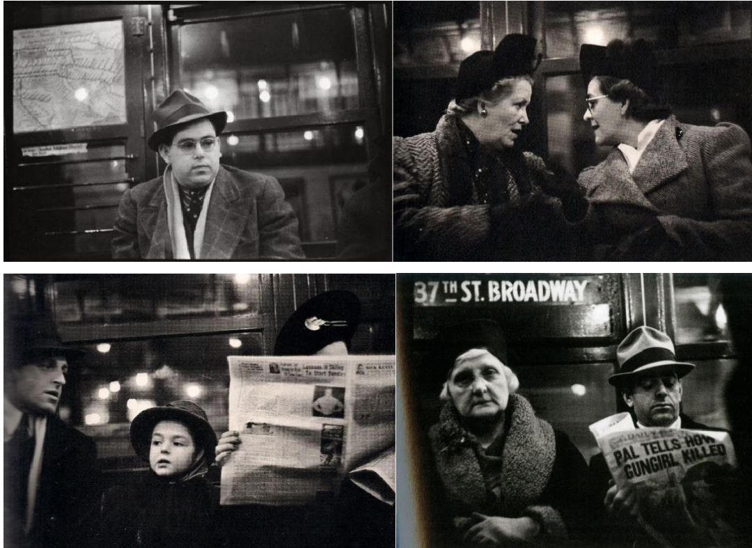
Figura 14,15,16 e 17 – Subway (1938-1941)

Fonte: NYC SUBWAY PORTRAITS BY WALKER EVANS. Aminulnadim. 2015. Disponível em: Retratos do metrô de NYC por Walker Evans - aminulnadim (wordpress.com) acesso em: 6 de agosto de 2022