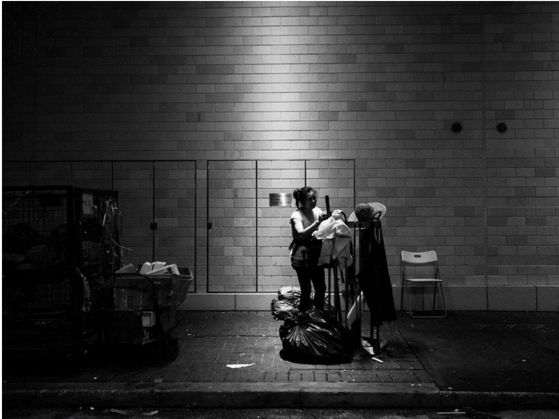
Figura 28 – Xyza Bacani. There Was There Will Be

Fonte: There was and there will be. Xyza Cruz Bacani. Disponível em: There Was and There Will Be - Xyza Cruz Bacani . Acesso em: 10 de outubro de 2022