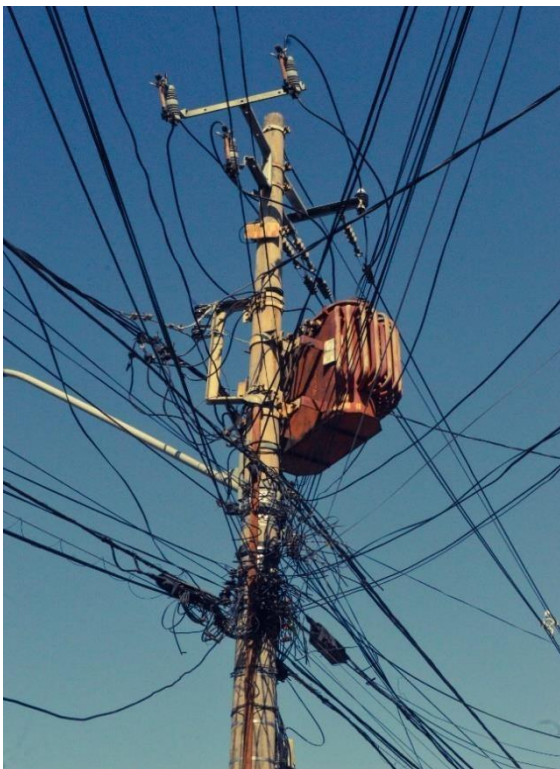
Figura 1,2,3 e 4 - Monumentos Cotidianos (2022)