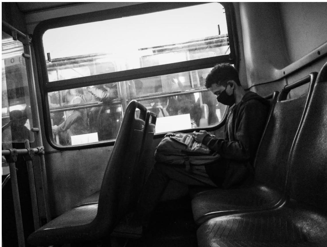
Figura 22 – Contrates Cotidianos (2022)