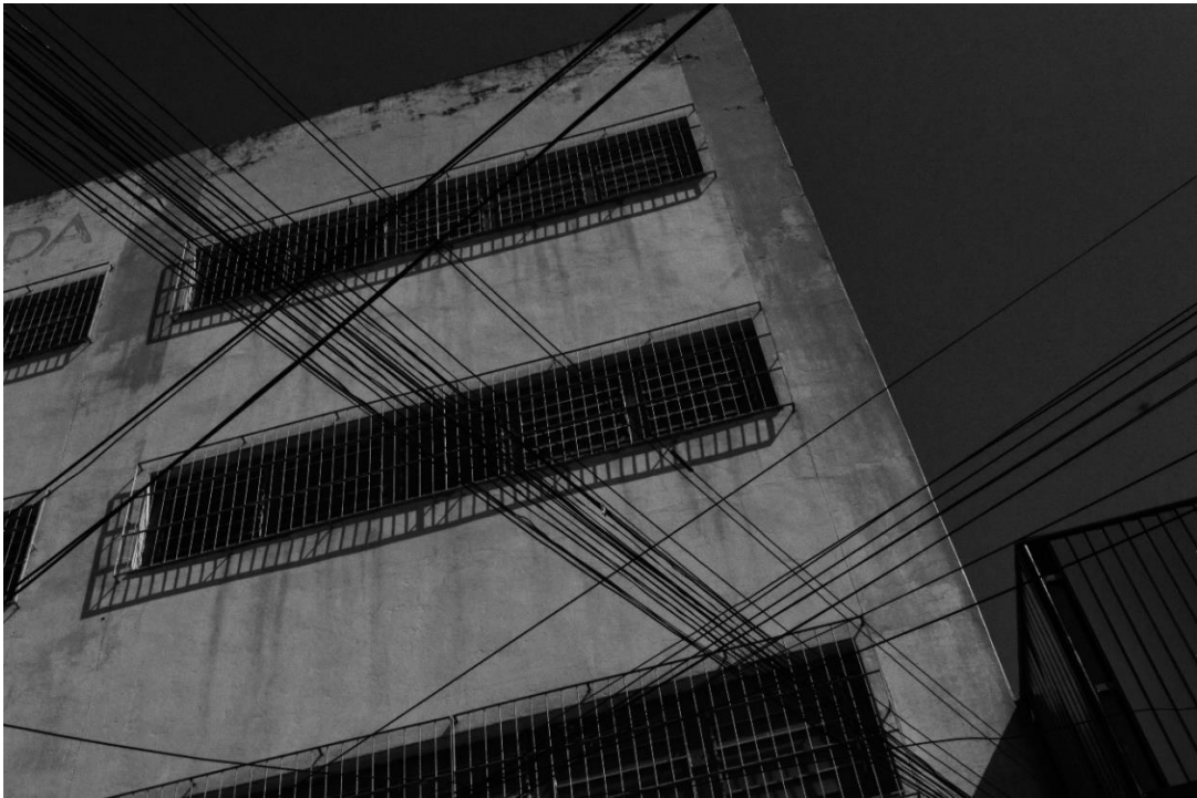
Figura 7 e 8 - Cruzamentos (2022)

É possível perceber uma aproximação poética e visual entre meu interesse pelos postes de energia com o trabalho da Fernanda Moraes, pois ao explorar os fios elétricos como linhas de tensionamento e ligação, ela dialoga diretamente com a forma como percebo os fios, como elementos que conectam e que de alguma forma criam embates com o espaço urbano.