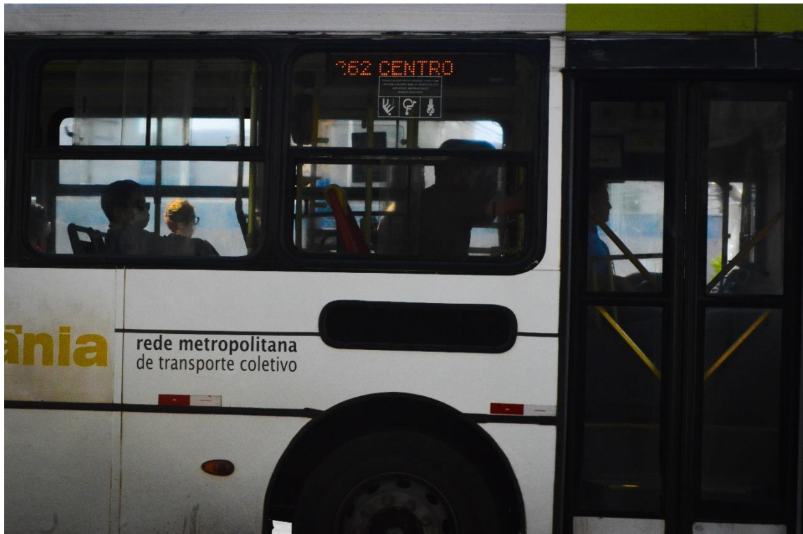
Figura 10 – 362 (2022)