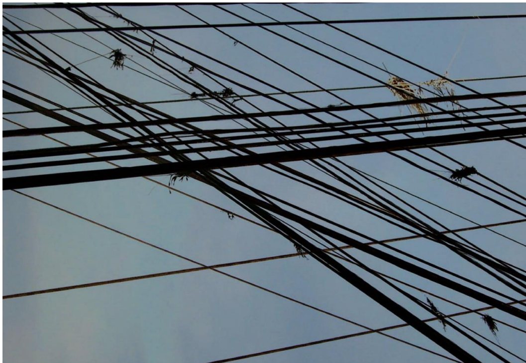
Figuras 5 e 6 - Jogo de Fios (2010), Fernanda Moraes.