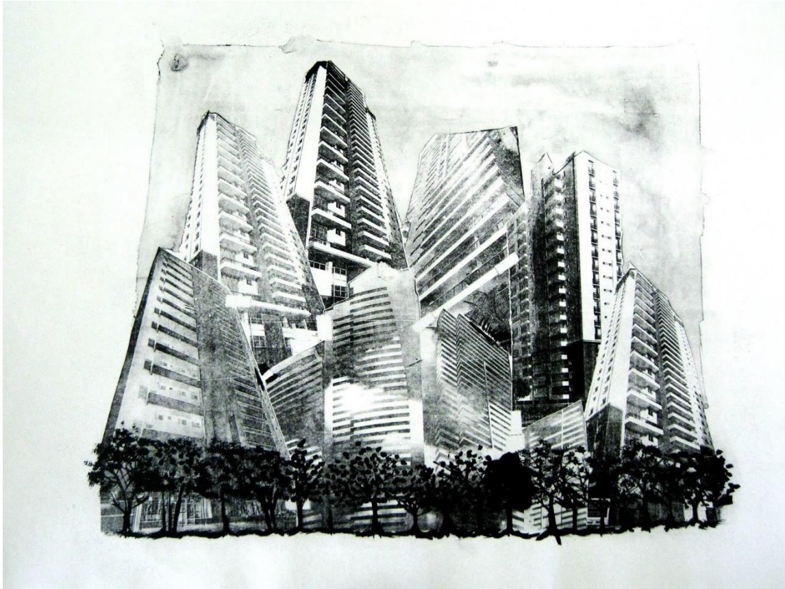
Figura 27: Experimentação com litografia a seco (2014)