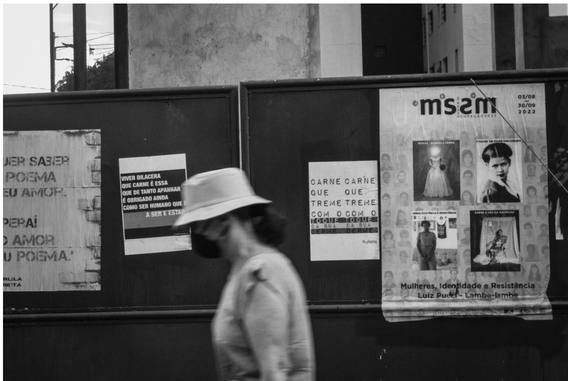
Figura 30 – Sem título ( 2022)