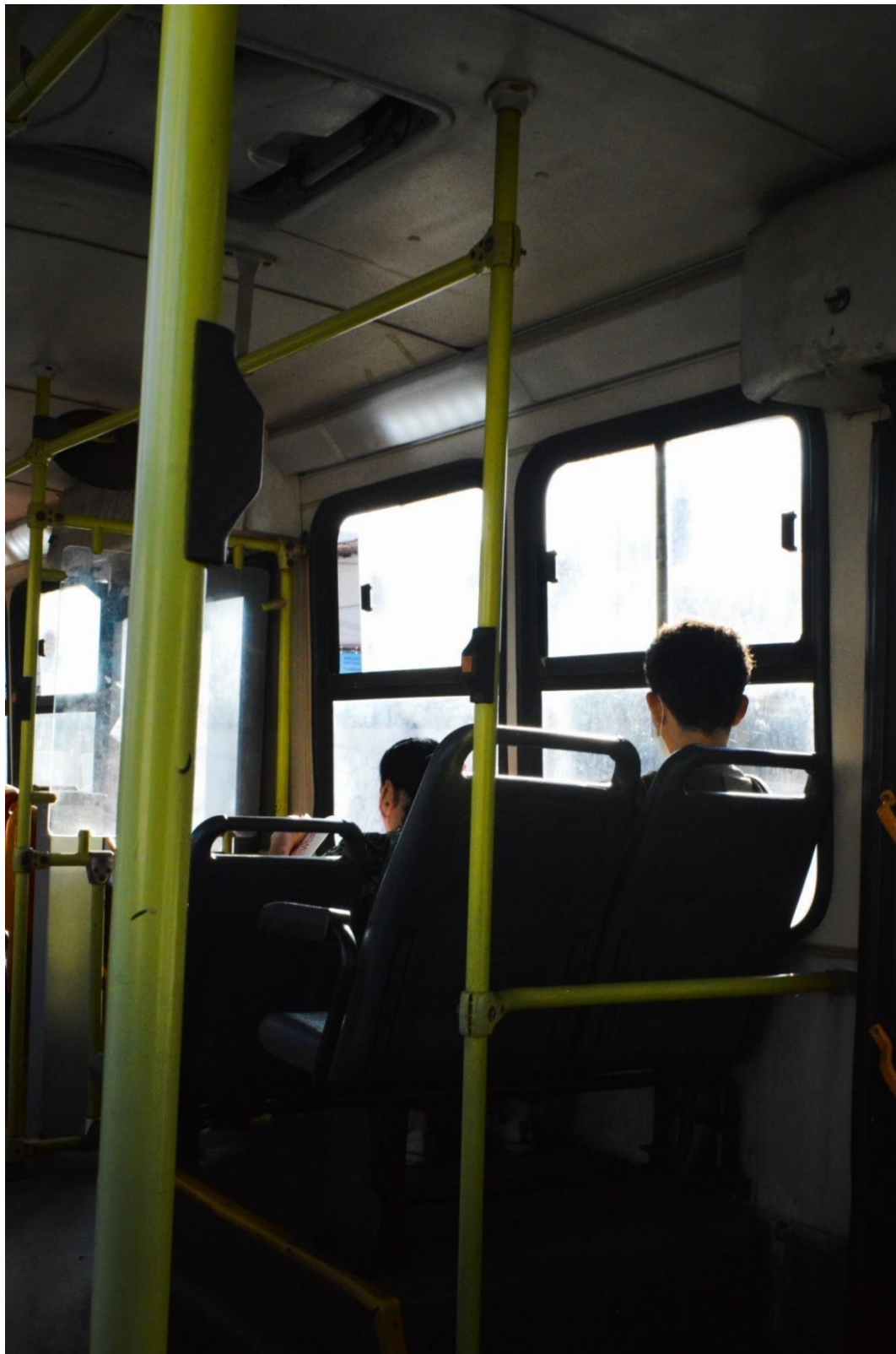
Figura 24: Sozinho (2022)