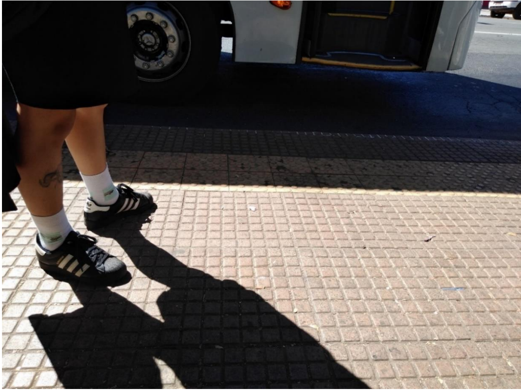
Figura 11,12 e 13 – A espera (2022)