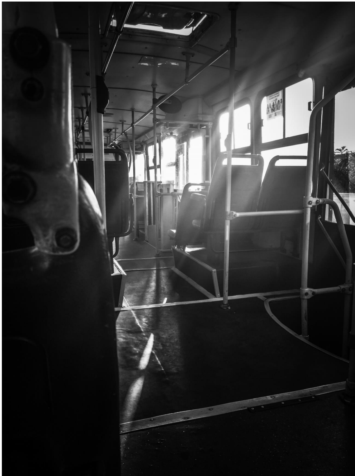
Figura 9 – Catedrais Cotidianas (2022)