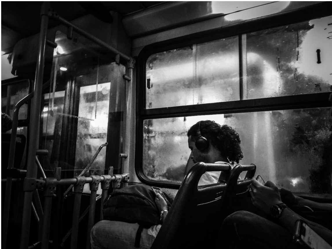
Figura 35 – sem título (2022)

Extrai da cidade seus aspectos que para mim são os mais significativos, assim como trago a caminhada, que funciona como gatilho no meu processo artístico, ela me ajuda a desencadear questões. É através do ato de caminhar que as ideias surgem e as questões se tornam mais claras. É um processo de descoberta, o passo a passo, vai fomentando uma clareza no pensamento e na criação. Faço o recorte dentro da cidade, vou traçando linhas pontilhas que me servem de guia para o corte fotográfico. Um mapeamento do terreno, que posteriormente me servirá como base de uma nova cartografia. Que além do espaço se atenta ao contexto, ao fluxo inexorável dos dias, das pessoas, de tudo; o cotidiano.