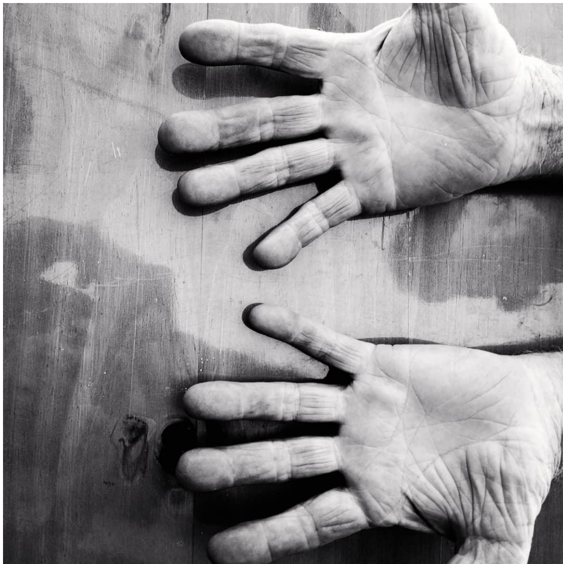
Figuras: 18,19 e 20 – Série Digitais da Vida (2020-2021)

contém a sua história, que de alguma forma mostrem suas identidades, que as pessoas deduzam suas idades, seus trabalhos e os ocorridos em suas vidas.