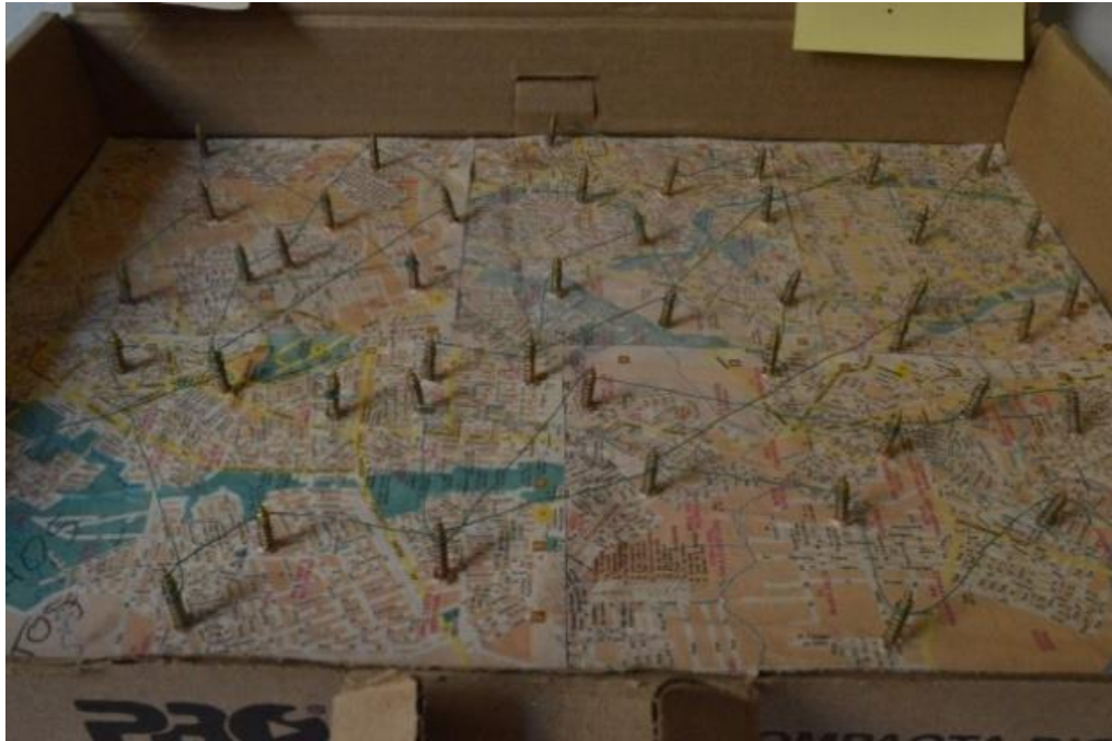
Figuras 31,32,33 e 34 – Cidade compacta (2022)

banal, um fragmento do espaço pois, “o usuário da cidade extrai fragmentos do enunciado para atualizá-los em segredo” (BARTHES apud CERTEAU, 2009, p.178).